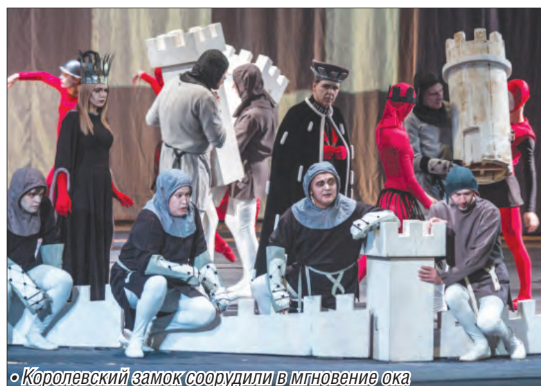
• Королевский замок соорудили в мгновение ока