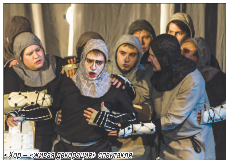
• Хор – «живая декорация» спектакля