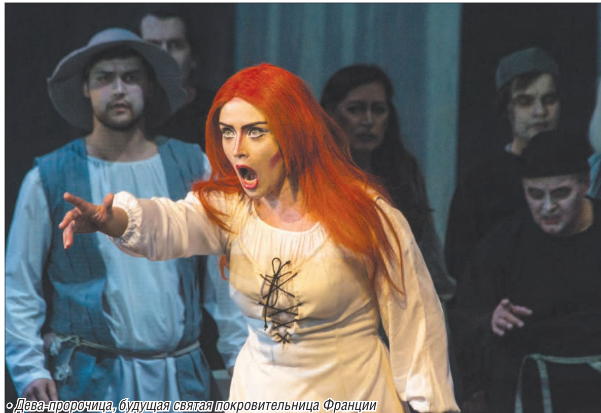
• Дева-пророчица, будущая святая, покровительница Франции