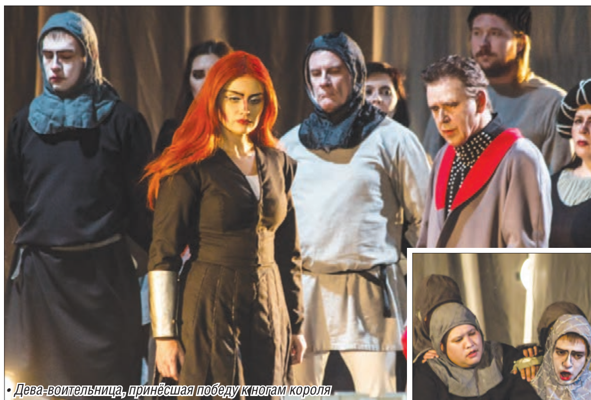
• Дева-воительница, принёсшая победу королю