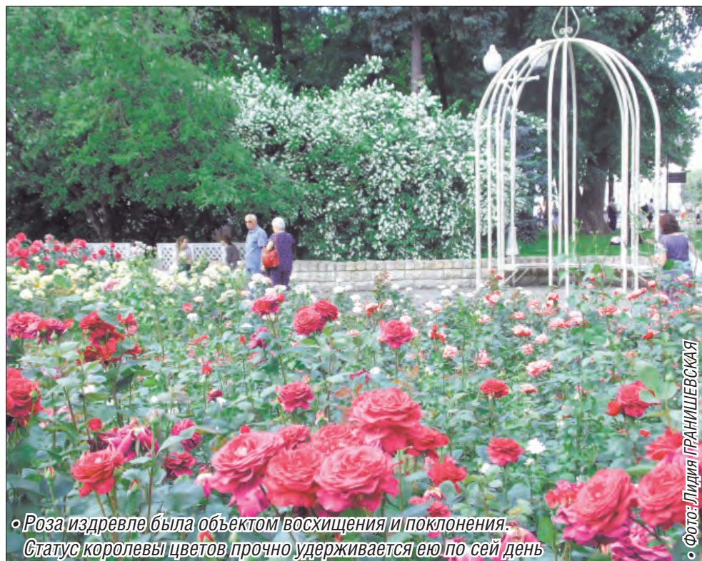
• Роза издревле была объектом восхищения и поклонения. Статус королевы цветов прочно удерживается ею по сей день

Есть сведения, что розовое масло полезно при очищении организма от шлаков, его регулярный прием снижает интенсивность аллергических реакций, смягчает течение бронхиальной астмы, эффективен при болезнях печени и желчного пузыря.