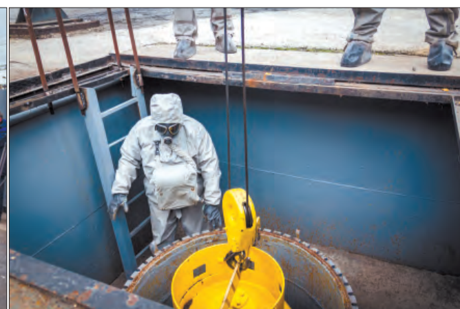
• Главная цель учений — отработка взаимодействия всех служб в условиях чрезвычайной ситуации