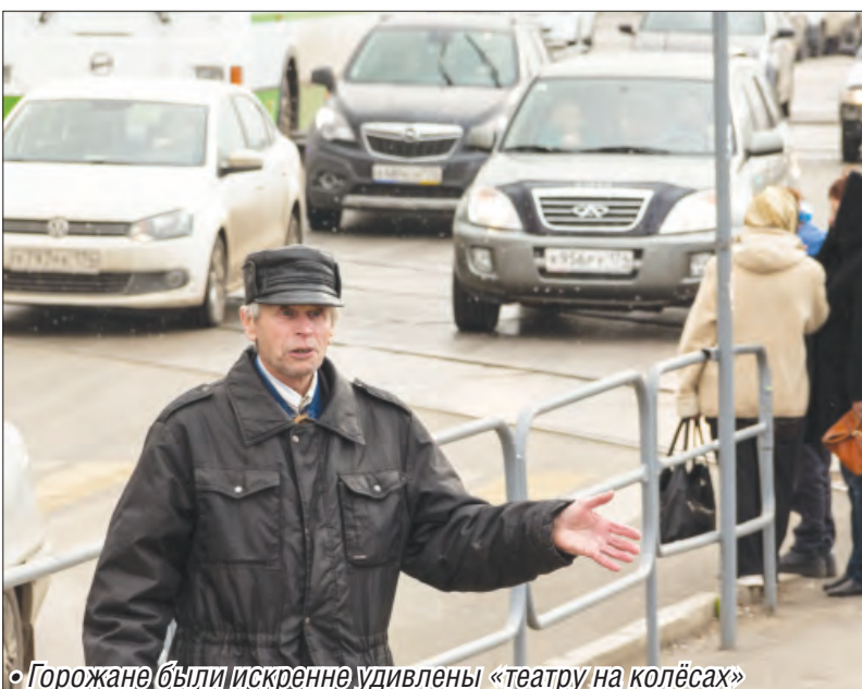
«Горожане были искренне удивлены «театру на колёсах»»