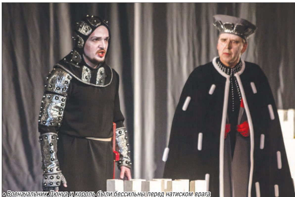
• Военачальник Дюнуа и король были бессильны перед натиском врага