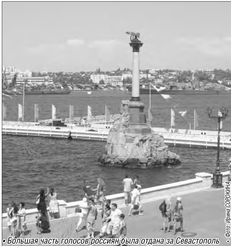
• Большая часть голосов россиян была отдана за Севастополь

Центральный банк РФ подвел итоги всероссийского конкурса по выбору символов для новых купюр. Состязание проходило в несколько этапов. Интересно, что в первых двух из них в числе лидеров был и Магнитогорск с символом города монументом «Тыл и Фронт». Но, к сожалению, в финал Магнитка впоследствии не смогла выйти. И дело даже не в том, что кто-то отверг наш вариант, проблема в том, что города попадали в число лидеров благодаря голосованию. Так, Казань, а, следовательно, варианты изображения Казанского кремля или Приволжского федерального университета поддержали 537 тысяч 843 человека, за Сочи – Роза Хутор, стадион «Фишт» проголосовали 513 тысяч 334 человека. Чуть больше россиян отдали свои голоса за Владивосток (мост на остров Русский) и Севастополь (Херсонес Таврический, памятник затопленным кораблям) – соответственно 546 тысяч 675 и 543 тысячи 858 человек.