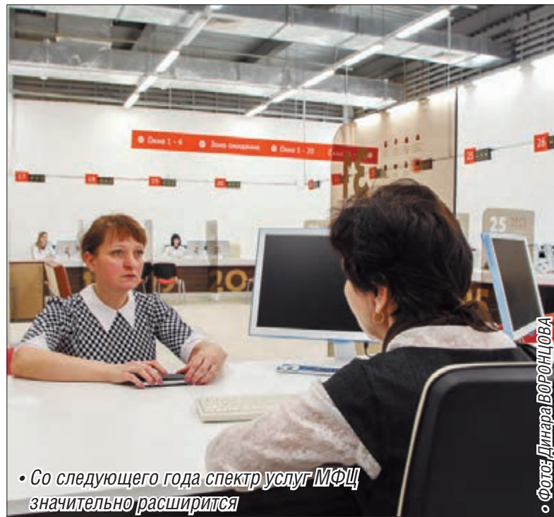
• Со следующего года спектр услуг МФЦ значительно расширится