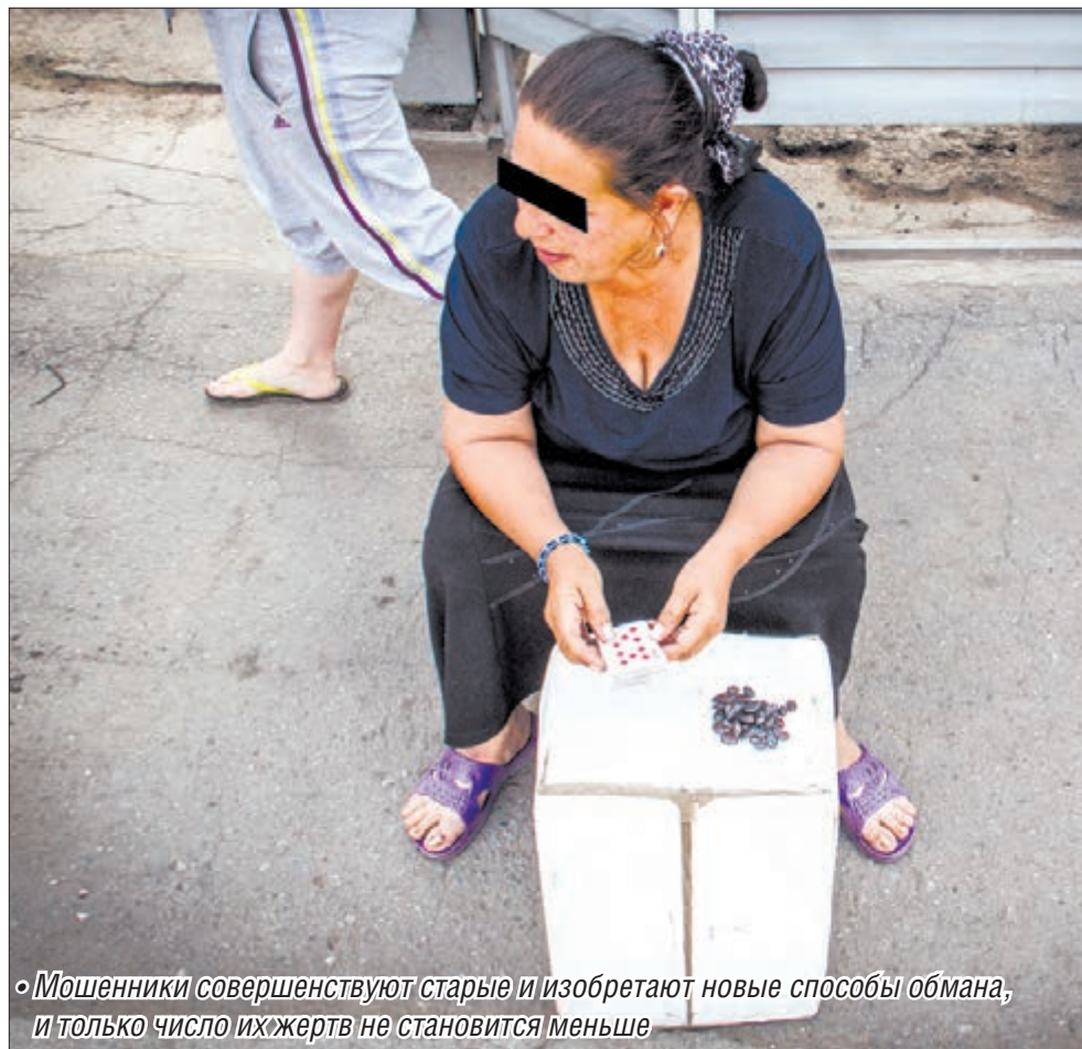
Мошенники совершенствуют старые и изобретают новые способы обмана, и только число их жертв не становится меньше

Пожилая жительница Магнитогорска была вынуждена обратиться в правоохрани-