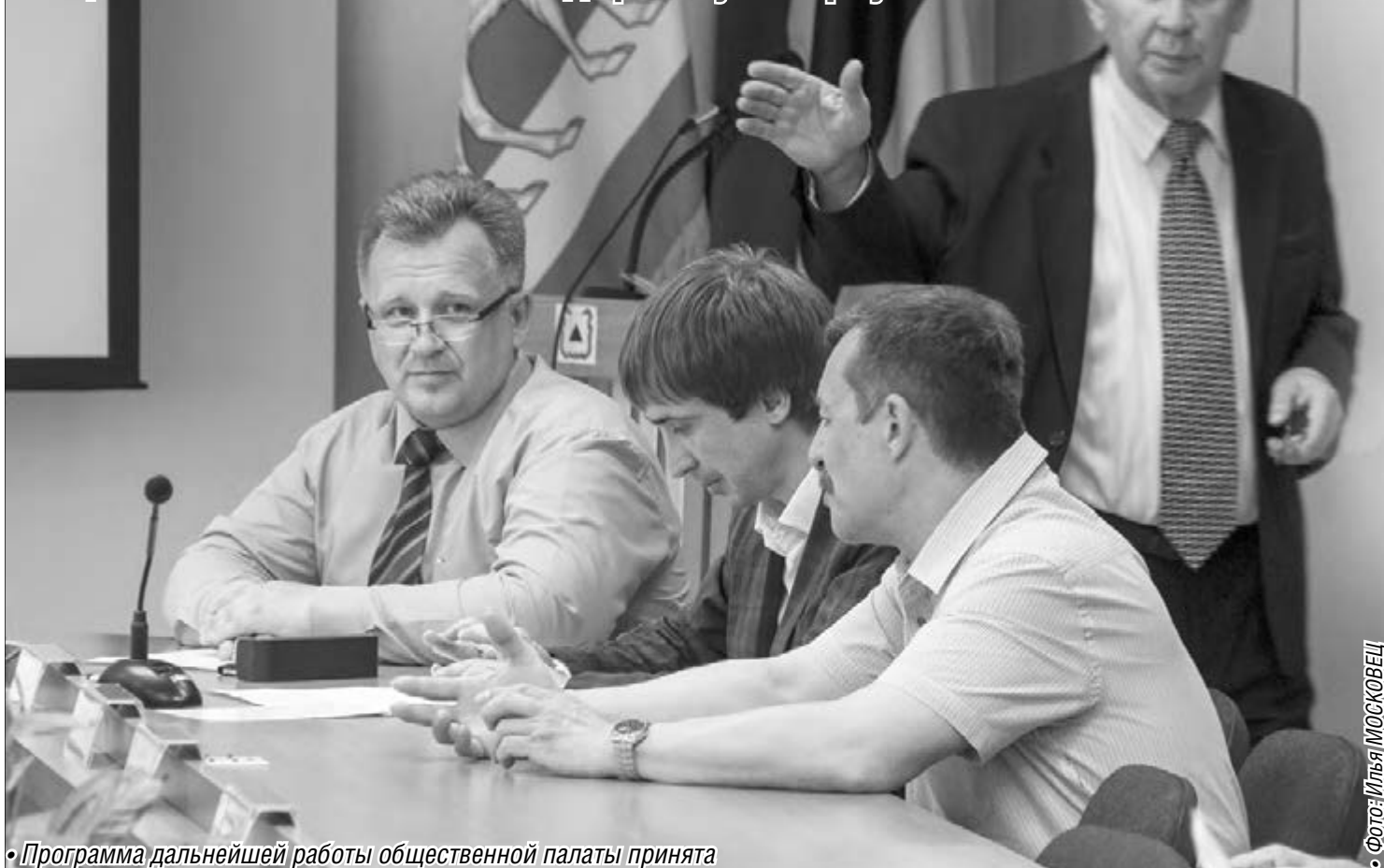
• Программа дальнейшей работы общественной палаты принята

Общественники составили «дорожную карту»