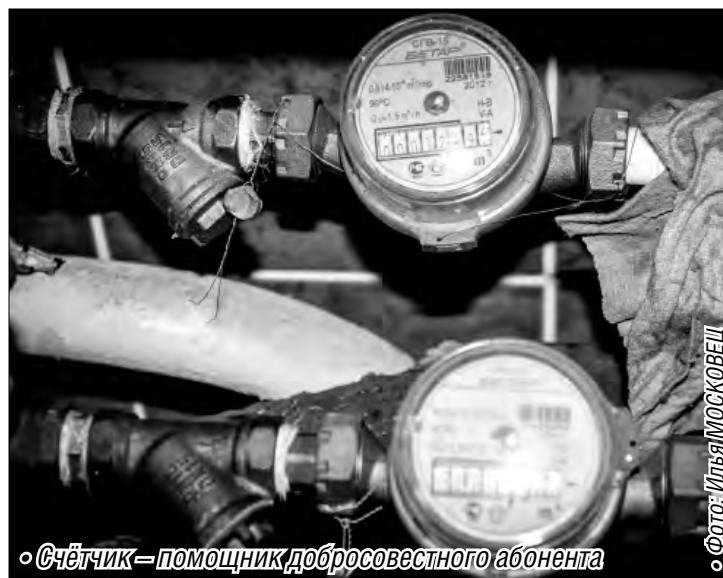
«Счётчик» – помощник добросовестного абонента

На официальном сайте МП Трест «Водоканал» ( www.magvoda.ru ) размещен список более ста должников, проживающих в частном секторе и имеющих на 1 сентября задолженность в сфере водоснабжения и водоотведения на сумму более 20 тысяч рублей. Речь идет о физических лицах, которые пренебрегают обязан-