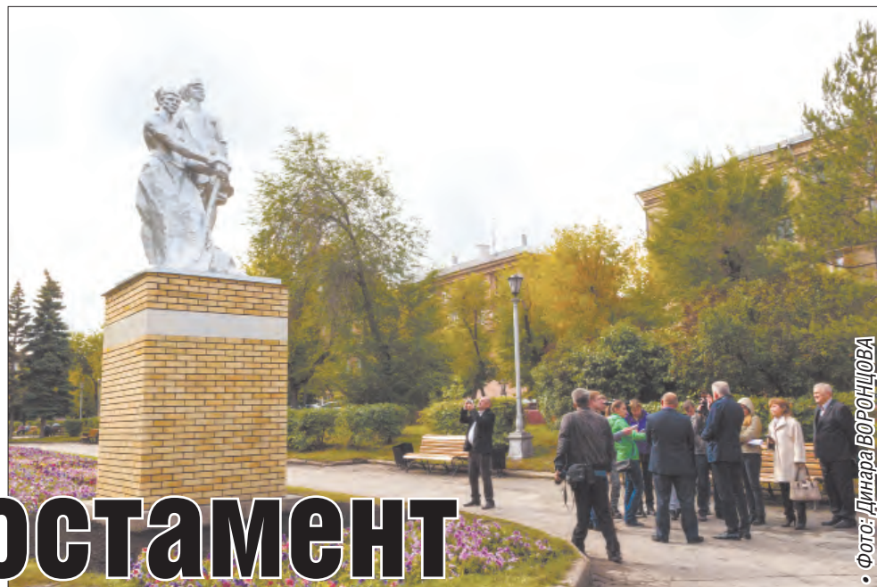
• Фото: Динара ВОРОНЦОВА

Памятник, посвященный комсомольцам-строителям Магнитки, был задуман еще в пятидесятые годы прошлого века. Вариантов было несколько, из них выбрали скульптурную композицию из кованого алюминия заслуженного художника РСФСР Виталия Зайкова: на высоком постаменте юноша и девушка глядят вдаль, в будущее. Постамент был сложен из огнеупорного кирпича, это должно было подчеркивать связь с индустриальной Магниткой. На белом мраморном поясе с лицевой стороны