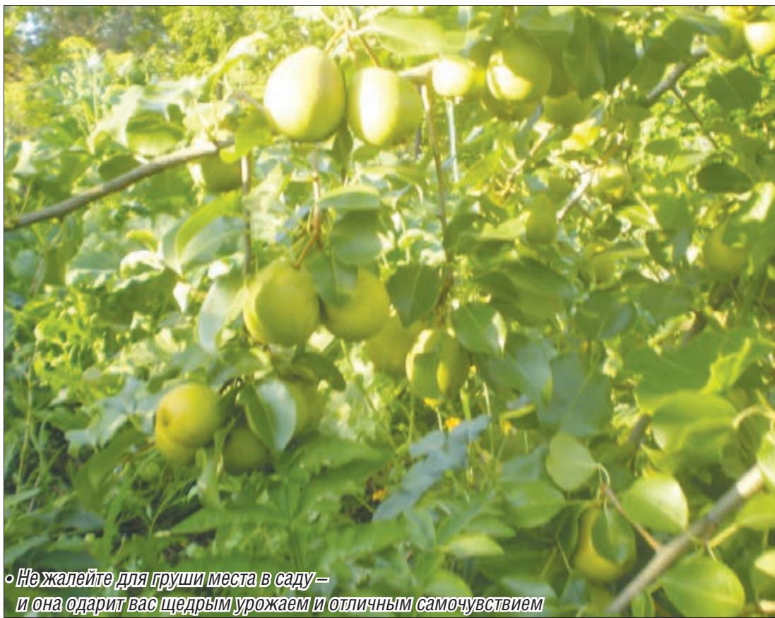
«Не жалейте для груши места в саду – и она одарит вас щедрым урожаем и отличным самочувствием»

Плоды груши содержат сахара – глюкозу, фруктозу, сахарозу, а также витамины А, группы В, Е, Р, каротин, аскорбиновую и фолиевую кислоты, катехины, азотистые вещества, пектины, минеральные соли, железо, марганец, йод, кобальт, медь, калий, молибден, кальций, дубильные вещества, клетчатку. В ранних летних сортах содержится больше марганца, а в поздних – железа. Эти фрукты оказывают общеукрепляющее, антимикробное, противо-