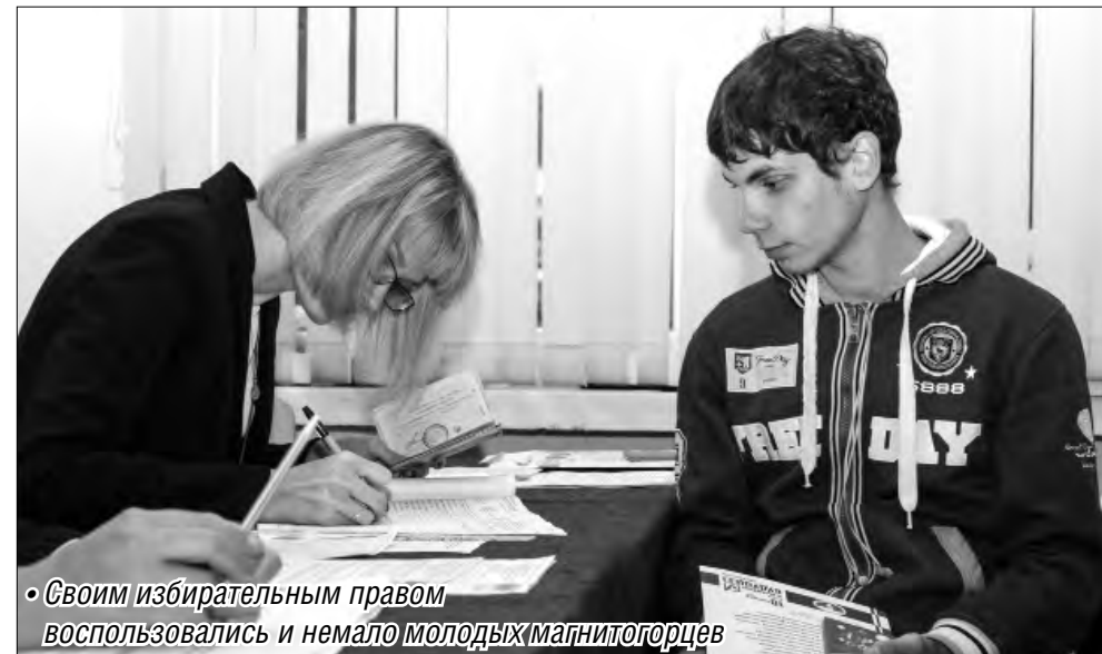
• Своим избирательным правом воспользовались и немало молодых магнитогорцев