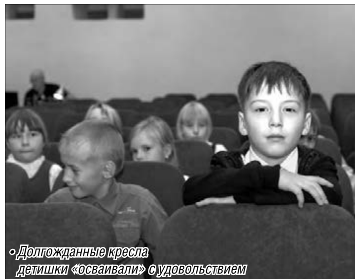
«Долгожданные кресла детишки «осваивали» с удовольствием»

жанием репертуара творческих коллективов может похвастаться руководство Дворца, но и самим обновленным зданием. Помимо установленных в концертном зале кресел благодаря помощи Магни-