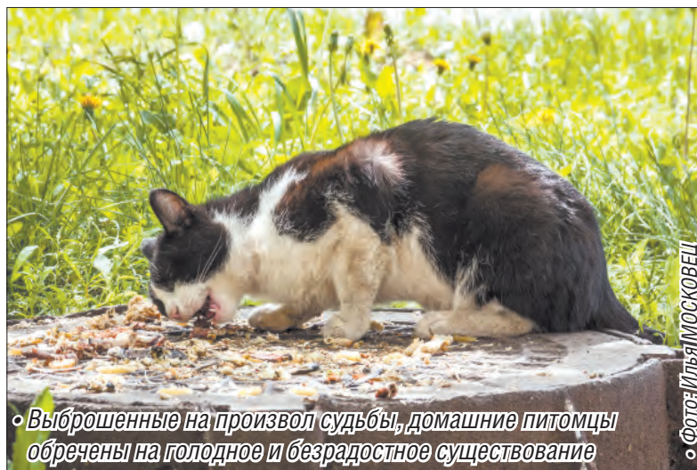
• Выброшенные на произвол судьбы, домашние питомцы обречены на голодное и безрадостное существование

Известно, что «персы» абсолютно не приспособлены к беспризорной жизни. Они не могут сами найти себе пищу, не в состоянии защититься от собак и недобрых людей. Вся надежда у них толь-