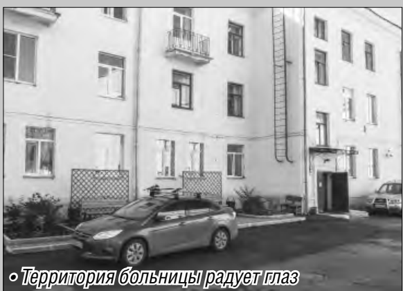
• Территория больницы радует глаз