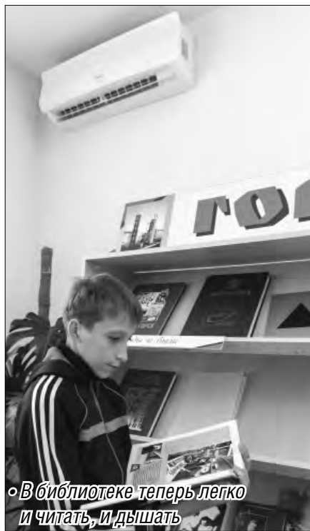
• В библиотеке теперь легко и читать, и дышать

Детская библиотека №4 получила подарок по программе «Реальные дела»