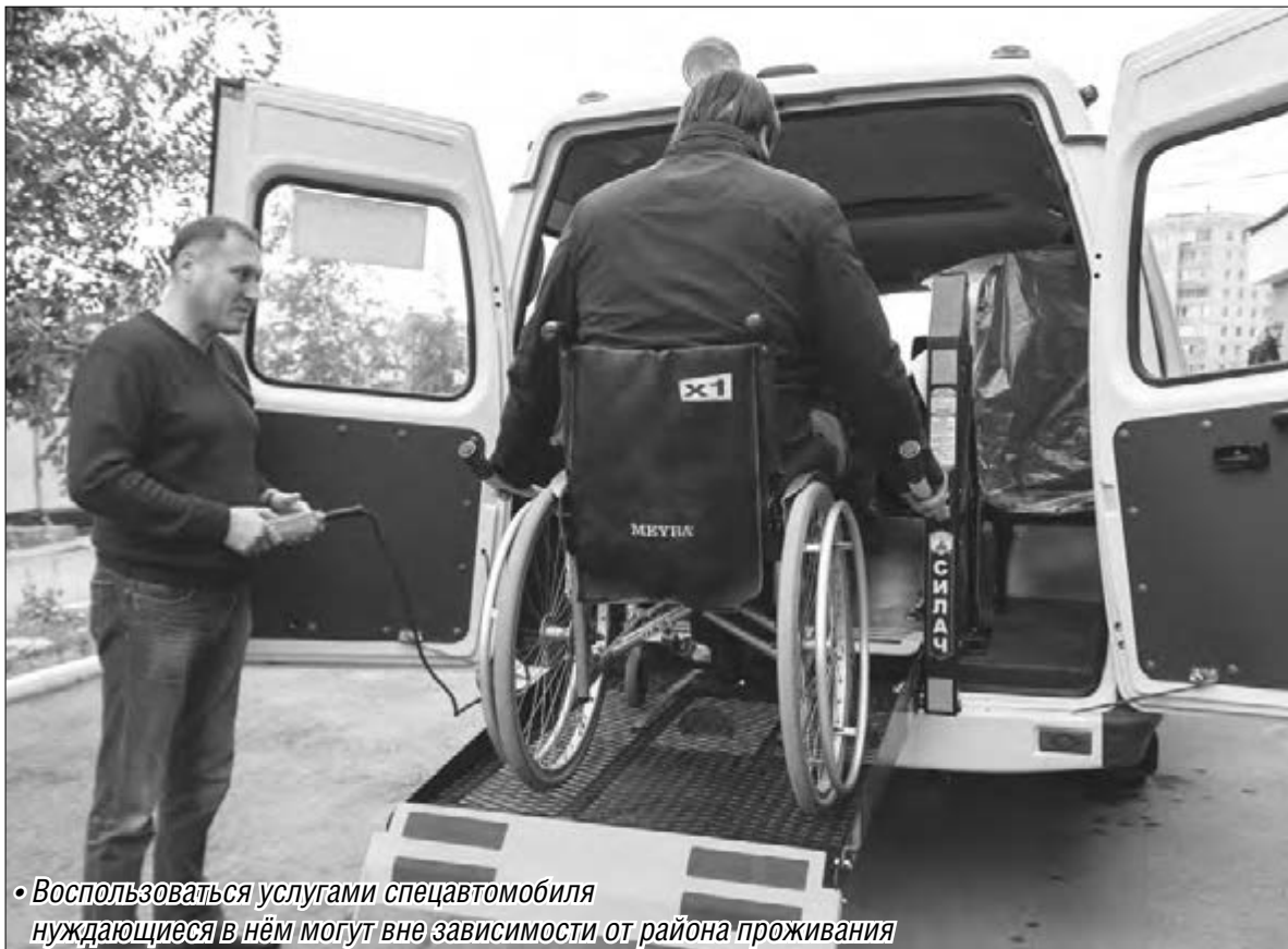
• Воспользоваться услугами спецавтомобиля нуждающиеся в нём могут вне зависимости от района проживания

Специальное такси работает для инвалидов Магнитогорска