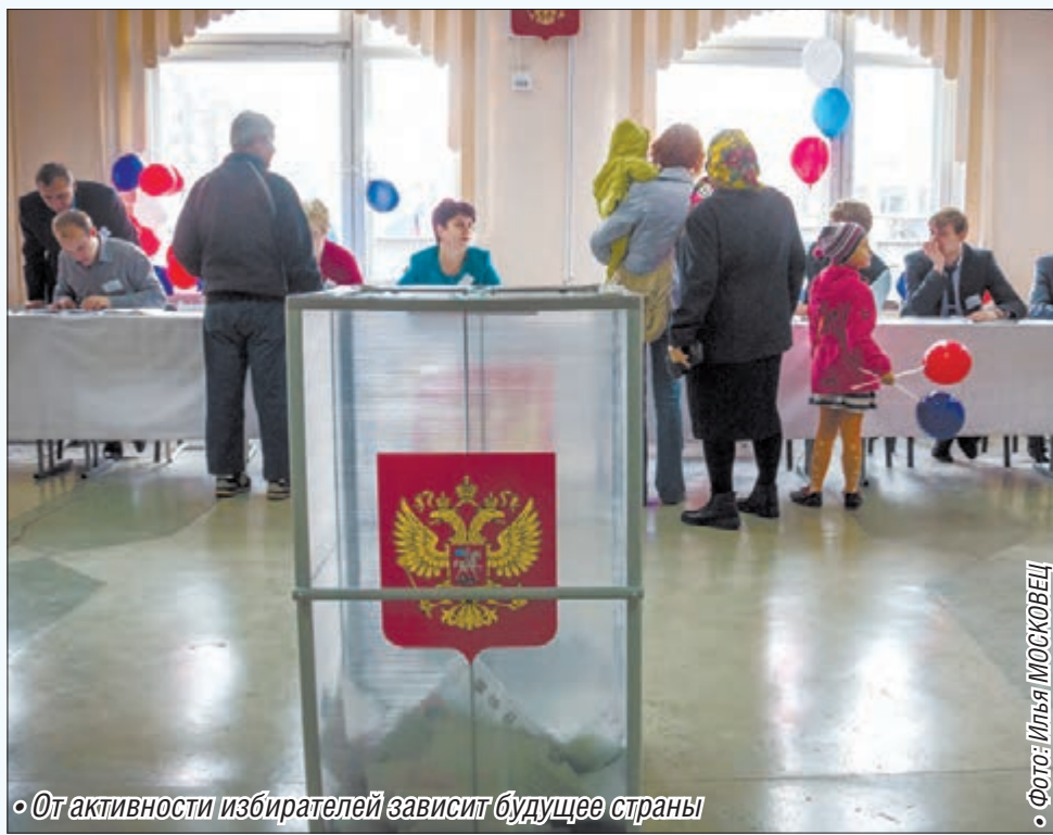
• От активности избирателей зависит будущее страны

На основе этих принципов и свободного волеизъявления граждан единой России в федераль-