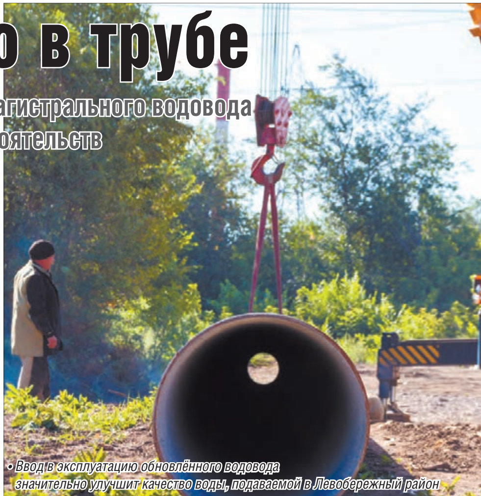
• Ввод в эксплуатацию обновлённого водовода значительно улучшит качество воды, подаваемой в Левобережный район

– Нынешняя реконструкция – одно из мероприятий по улучшению качества воды на левом берегу. Суть ее заключается не только