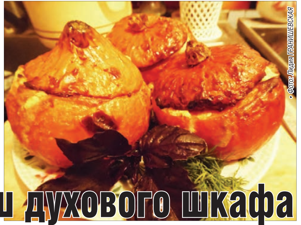
• Фото: Лидия ГРАНИШЕВСКАЯ

начинку. На сковороде обжариваем в масле до мягкости лук, добавляем фарш. Когда фарш будет готов, солим, перчим, добавляем кардамон и корицу и еще немного обжариваем, чтобы приправы «разогрелись». Фарш не должен быть сухим, чтобы он сохранил сочность, при необходимости можно добавить немного воды или топленого молока.