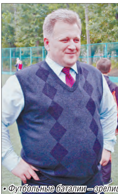
• Футбольные баталии – зрелище увлекательное