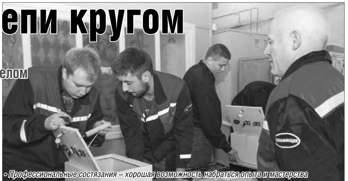
Профессиональные состязания – хорошая возможность набраться опыта и мастерства

Задачи для конкурсантов были понятны и привычны. Первая часть представляла собой теорию, вторая – практическое выполнение задания. Ответы на тест из десяти вопросов не заняли у рабочих много времени, и как только первая пара справилась с этой частью, они смогли приступить к следующему этапу. Там требовалось найти нарушения в электрической цепи и благополучно запустить от шкафа управления «двигатель», в роли которого представляла обычная лампа. То есть, как только загорался свет, это служило сигналом, что с поставленной задачей ребята справились.