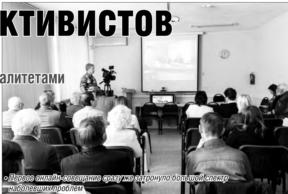
«Первое онлайн-совещание сразу же затронуло большой спектр наиболее актуальных проблем»