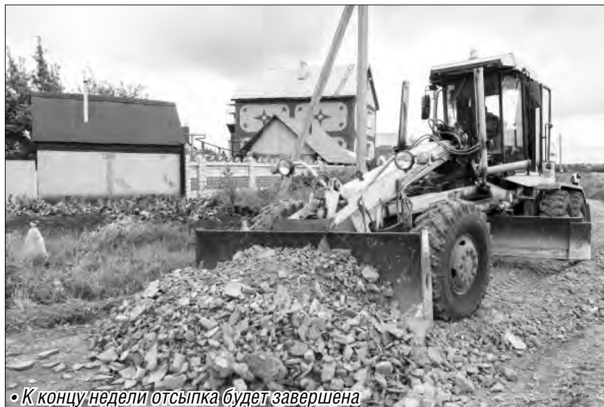
• К концу недели отсыпка будет завершена

– На сегодняшний день засыпано 34 тысячи квадратных метров. Мы работаем по перечню улиц, предоставленному нам районными администрациями. Улицу Лихачева отсы-