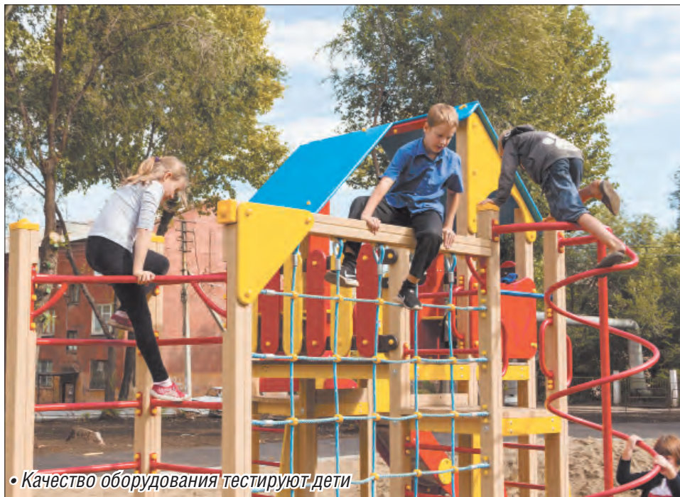
• Качество оборудования тестируют дети

Благодаря дополнительному финансированию в левобережье обустраивают семь спортивно-игровых зон отдыха