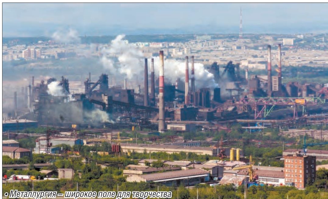
• Металлургия – широкое поле для творчества