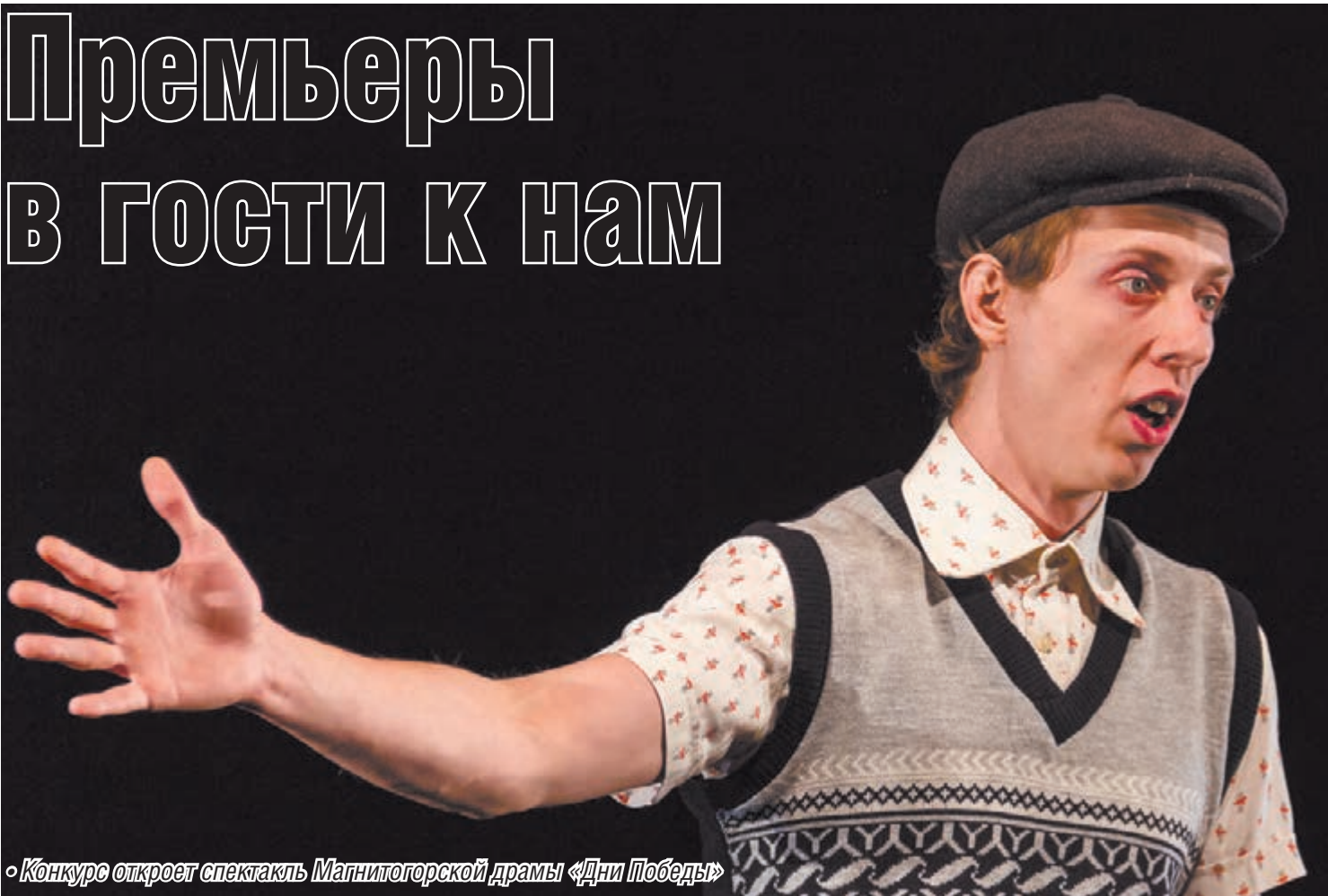
Конкурс откроет спектакль Магнитогорской драмы «Дни Победы»