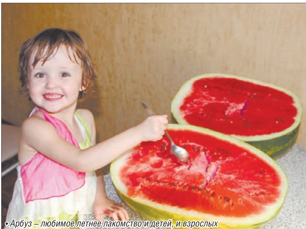
• Арбуз – любимое летнее лакомство и детей, и взрослых

Знатоки даже мини-бахчи на своих участках устраивали. И не прогадали: полосатые плоды порадовали размерами и вкусом.