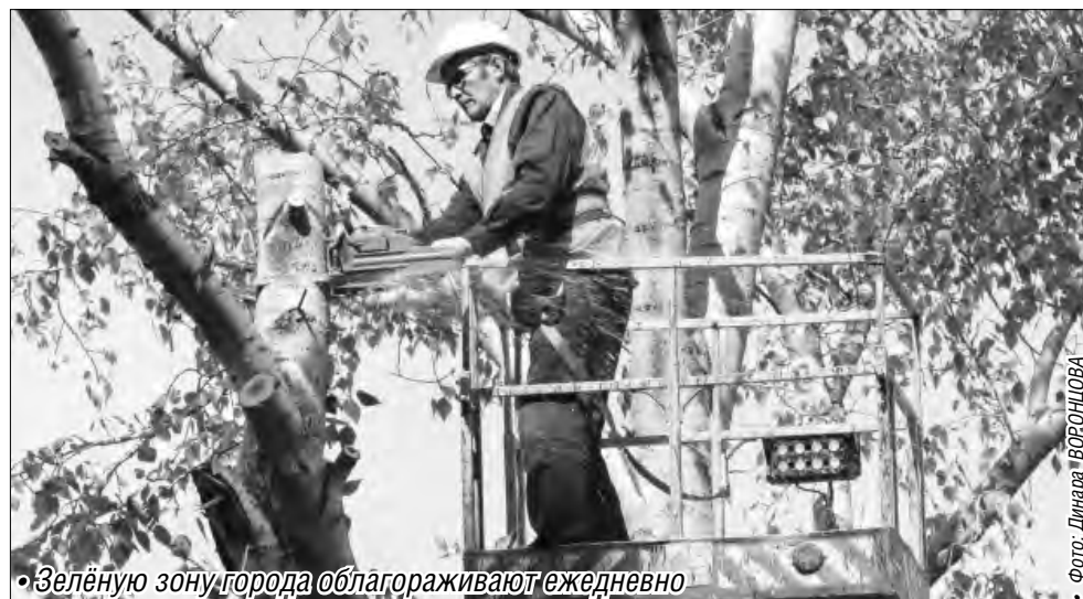
• Зелёную зону города облагораживают ежедневно

В понедельник одну из бригад ДСУ мы застаем в Орджоникидзевском районе. Вблизи домов №50 и 52 по улице 50-летия Магнитки рабочие с раннего утра осуществляют об-