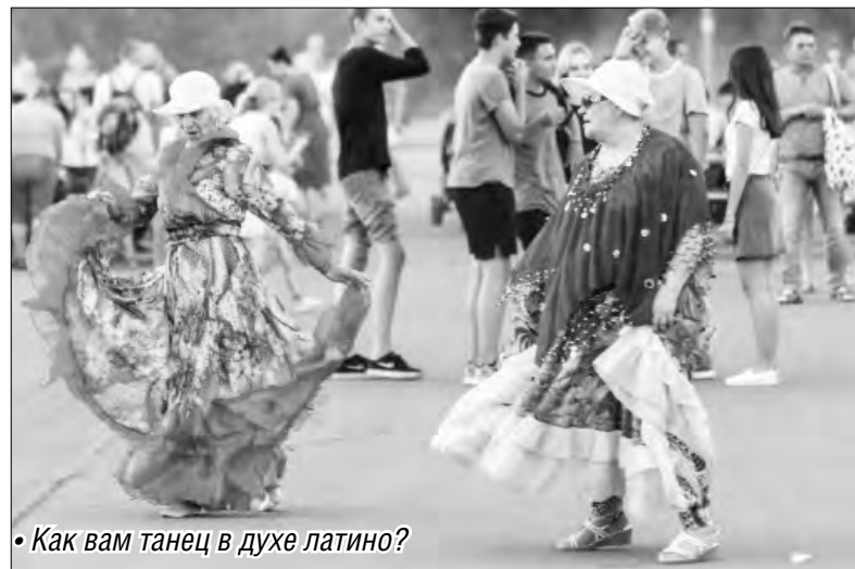
• Как вам танец в духе латино?