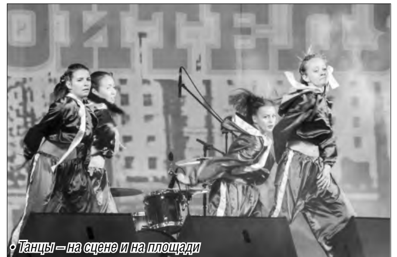
• Танцы – на сцене и на площади