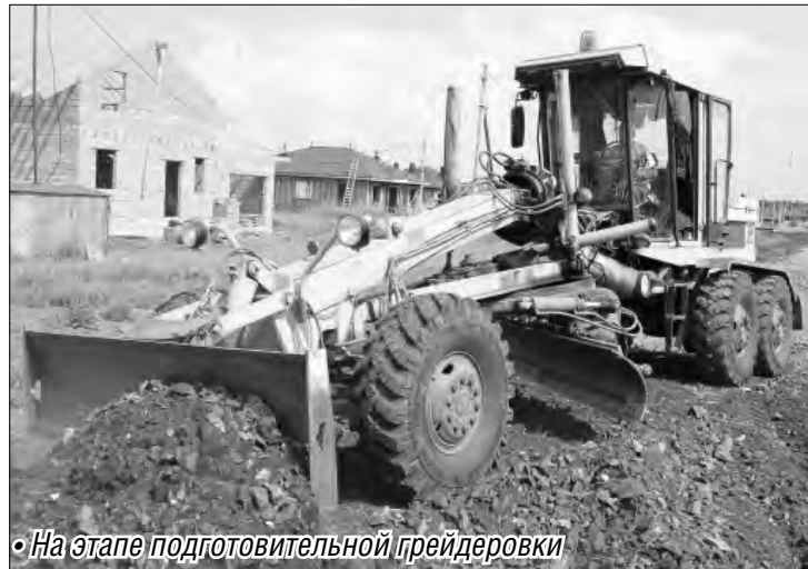
• На этапе подготовительной грейдеровки

Разнообразна программа «Реальных дел» и в Магнитогорске. Многие уже выполнены. А