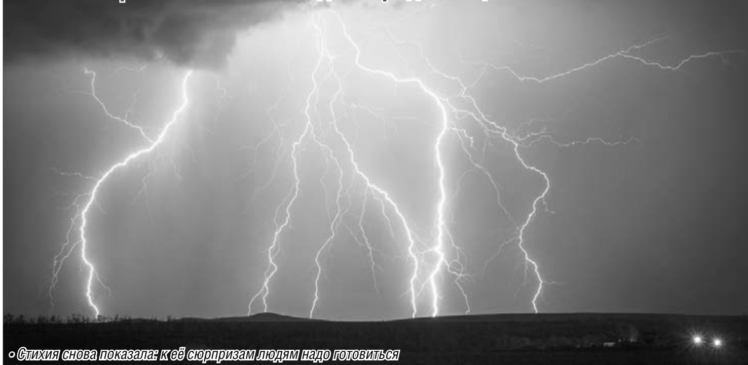
«Стихия снова показала: к её сюрпризам людям надо готовиться»

Магнитогорск готов к непогоде и предстоящей зиме