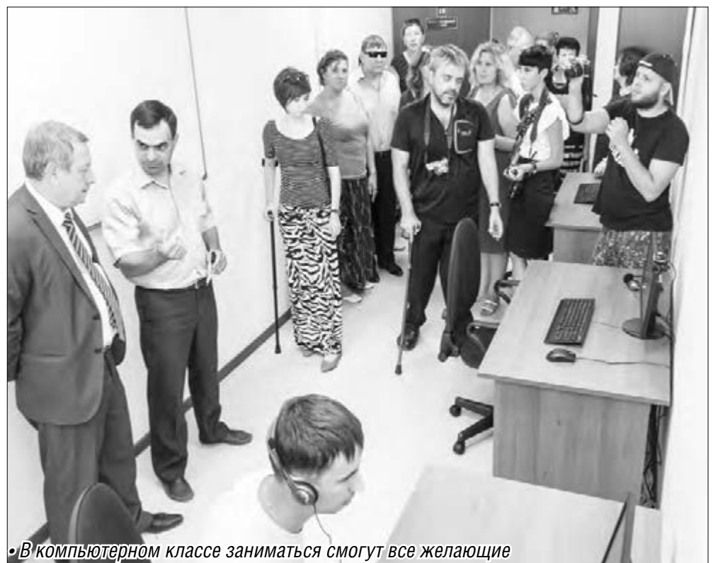
• В компьютерном классе заниматься смогут все желающие

– Для современного человека компьютер – большое подспорье, а особенно для человека с ограниченными возможностями здоровья, – сказал на презентации ком-