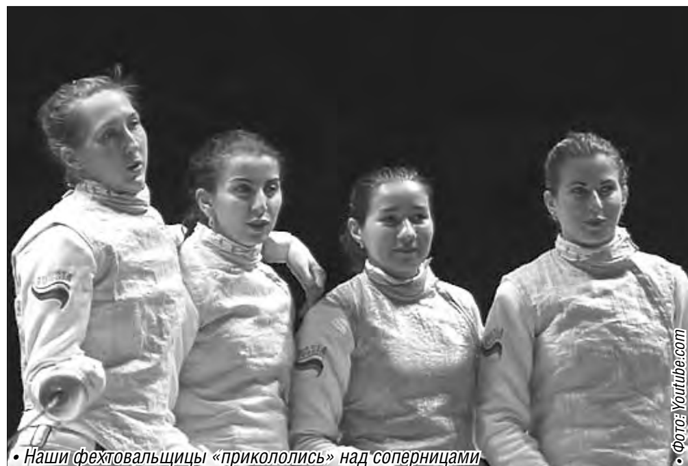
• Наши фехтовальщицы «приколосились» над соперницами

образование. Вот это и есть то самое «не так» в игре нашей команды: на площадке мы не увидели Екатерину Гамову и Любовь Соколову. Накануне игр обе суперзвезды, двукратные чемпионки мира, много раз выведившие игры нашей команды на победный уровень, объявили, что заканчивают спортивную карьеру и не будут принимать участие в Олимпийских играх в Бразилии. Каждая объяснила свое решение состоянием здоровья.