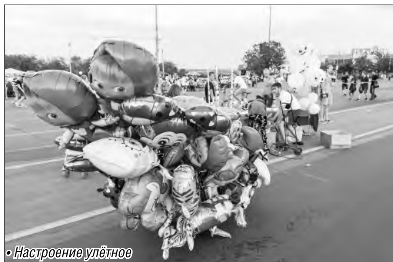
• Настроение улетное

со сцены. Собравшись в 1999 году, «Цветы» отметили 30-летие юбилейным концертом, но не возвратились в шоу-бизнес, не писали новых песен и не гастролировали, а работали в Театре музыки и драмы Стаса Намина, участвуя в создании мюзикла «Волосы», рок-оперы «Иисус Христос – супер-звезда» и других проектах. Через 10 лет коллектив неожиданно для всех снова начал активную творческую жизнь с записями альбомов и гастролями.