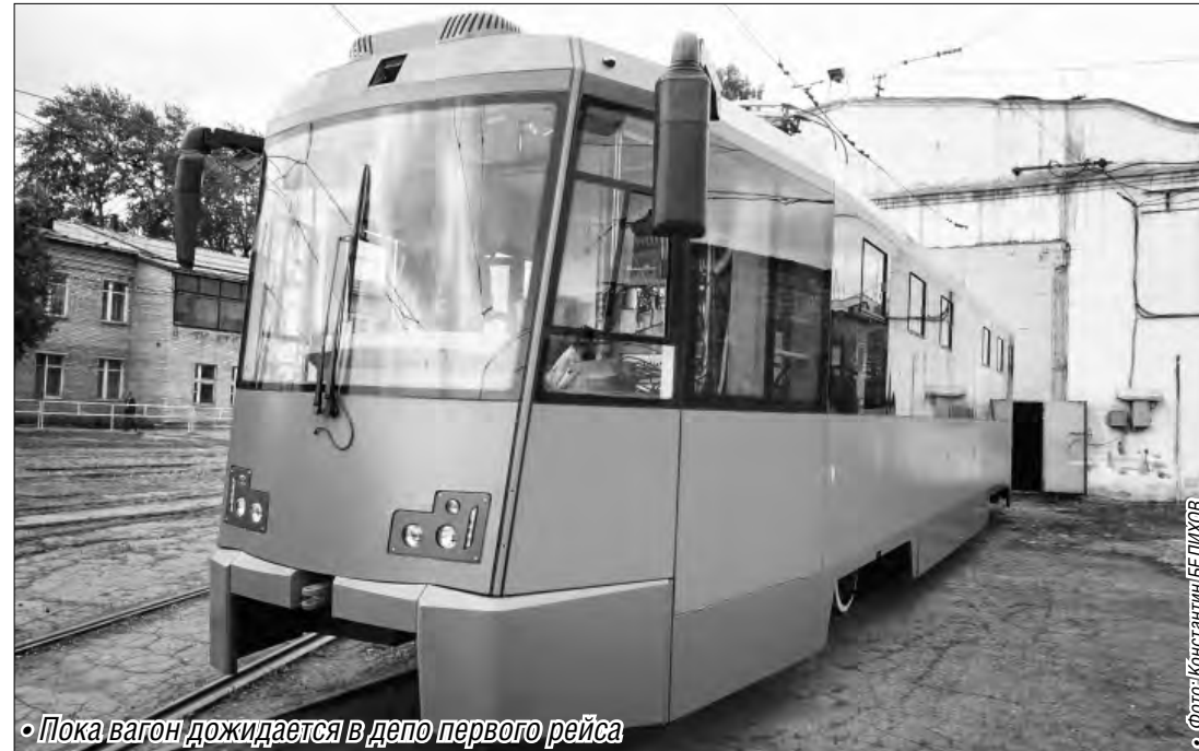
• Пока вагон дожидается в депо первого рейса

«Маггортранс» увеличил выпуск подвижного состава на маршруты