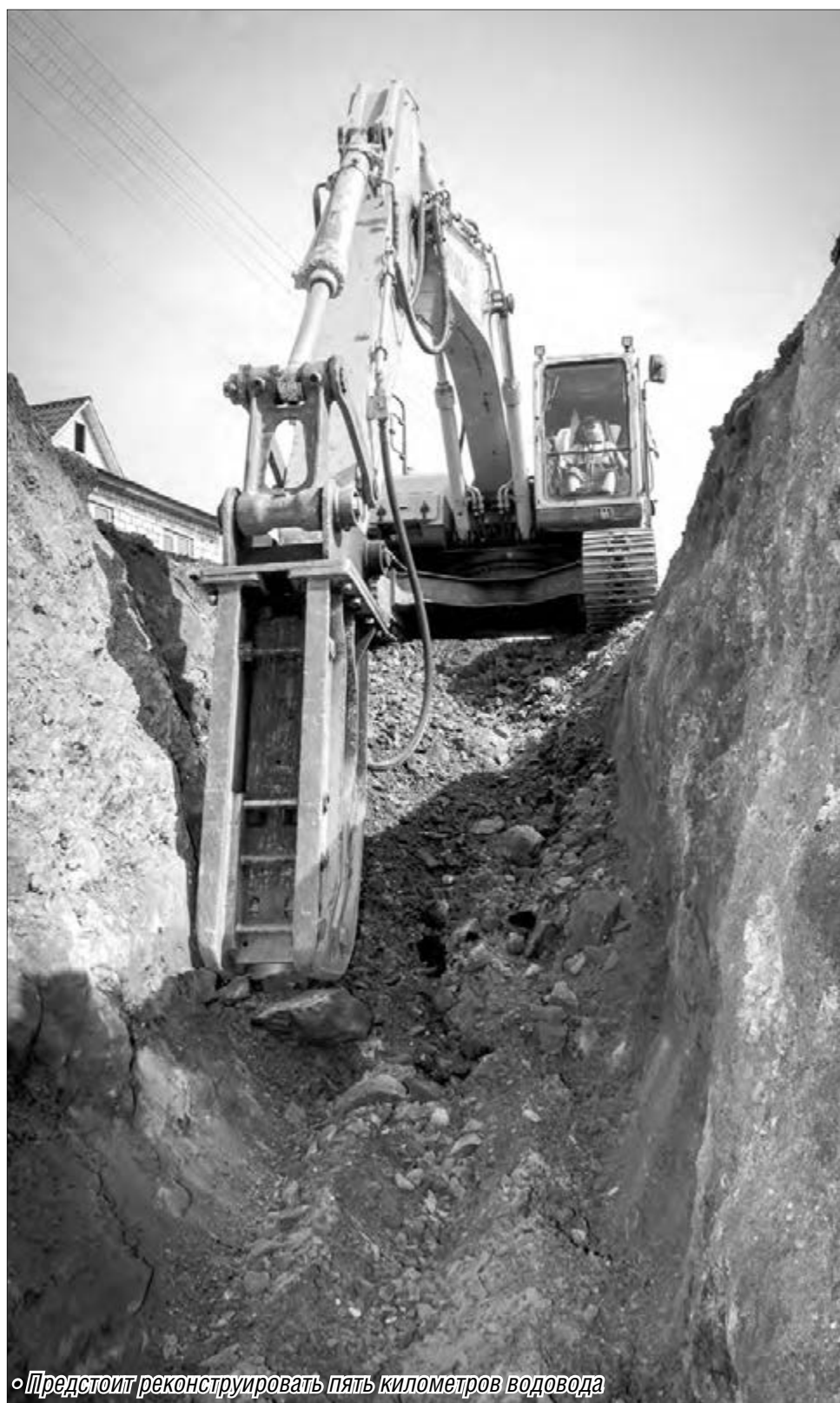
Предстоит реконструировать пять километров водовода