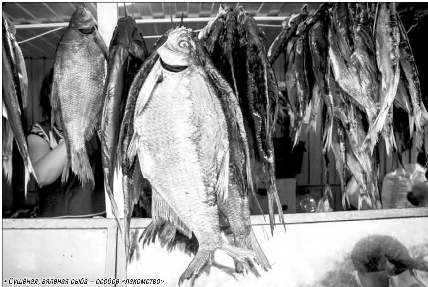
• Сушёная, вяленая рыба – особое «лакомство»

на ночь, либо используем готовую стружку для копчения, благо в магазинах ее огромный выбор. Поверх опилок ставим решетку, на нее спинками вниз кладем рыбу таким образом, чтобы она не сопри-