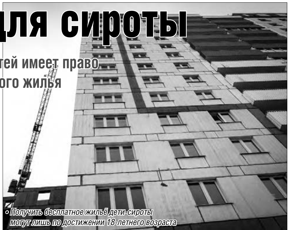
Получить бесплатное жилье дети-сироты могут лишь по достижении 18-летнего возраста

На 33 процента, или на 9,3 миллиона рублей, увеличилась выручка предприятия, связано это с ростом тарифа на потребление воды и водоотведения. Чистая прибыль треста составила 12,2 миллиона рублей, а затраты несколько превысят доходы – 14,3 миллиона рублей. Именно столько намерены в муниципальном предприятии вложить в обновление сетей и модернизацию производства. Уровень потерь воды на сетях в этом году снизился и достиг отметки в 30 процентов, в прошлом году этот показатель был 37 процентов. При этом в тарифе заложено около 33 процентов всех потерь.