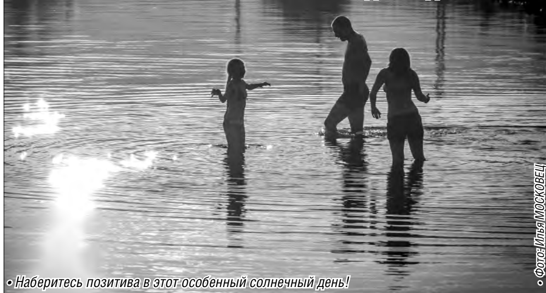
Наберитесь позитива в этот особенный солнечный день!