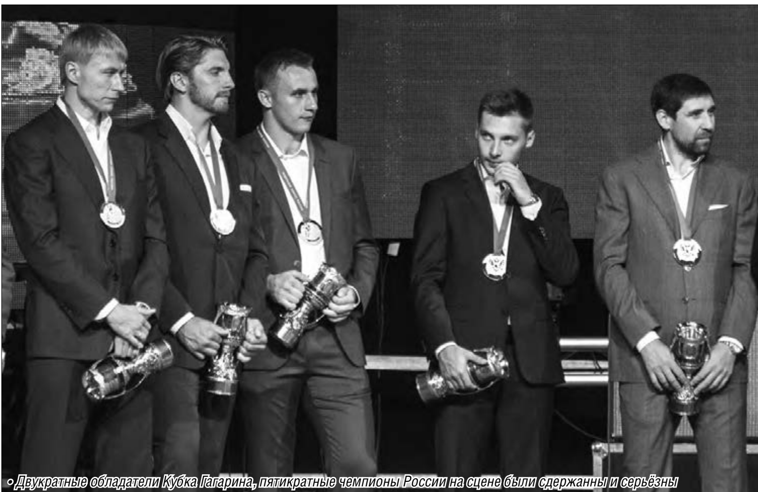
• Двукратные обладатели Кубка Гагарина, пятикратные чемпионы России на сцене были сдержанны и серьезны