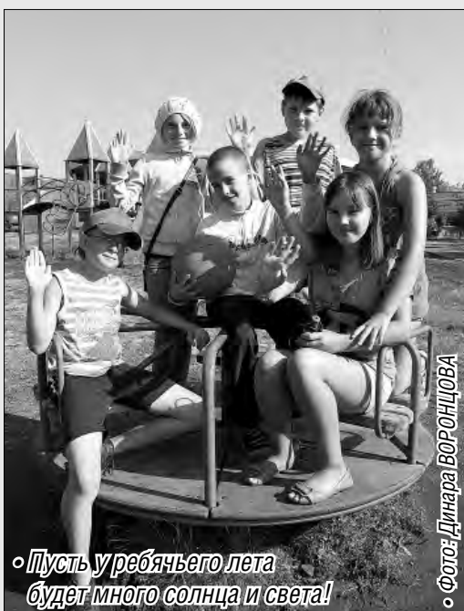
• Пусть у ребячьего лета будет много солнца и света!

По традиции работники Группы ОАО «ММК» имеют возможность приобрести путевки для своих детей по более низкой цене. Родительский взнос за путевку в «Горное ущелье» и «Уральские зори» составит, как и в прошлом году, от 8 до 9,5 тысячи рублей, в зависимости от смены. При этом 9,5 тысячи рублей составит компенсация работнику, три тысячи рублей – материальная помощь профсоюзного комитета. В стоимость путевки входят пятиразовое питание, медицинское обслуживание, различные секции и кружки, сообщает управление информации и общественных связей ОАО «ММК».