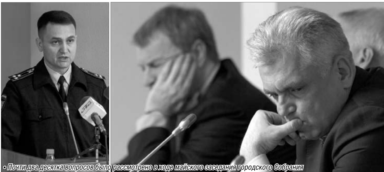
• Почти два десятка вопросов было рассмотрено в ходе майского заседания городского Собрания

Бюджет города, Закон о тишине, летний отдых детей – это далеко не полный перечень вопросов, которые обсудили депутаты горсовета.