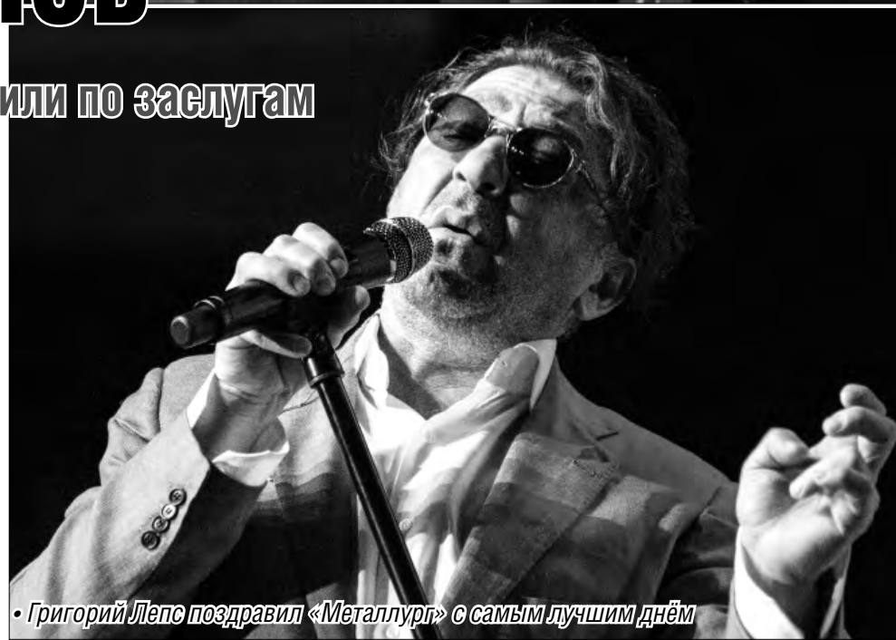
• Григорий Лепс поздравил «Металлург» с самым лучшим днём

– Мы снова с вами в этом Дворце, который стал талисманом, приносящим нам удачу. В этом сезоне, тяжело, непредсказуемо,