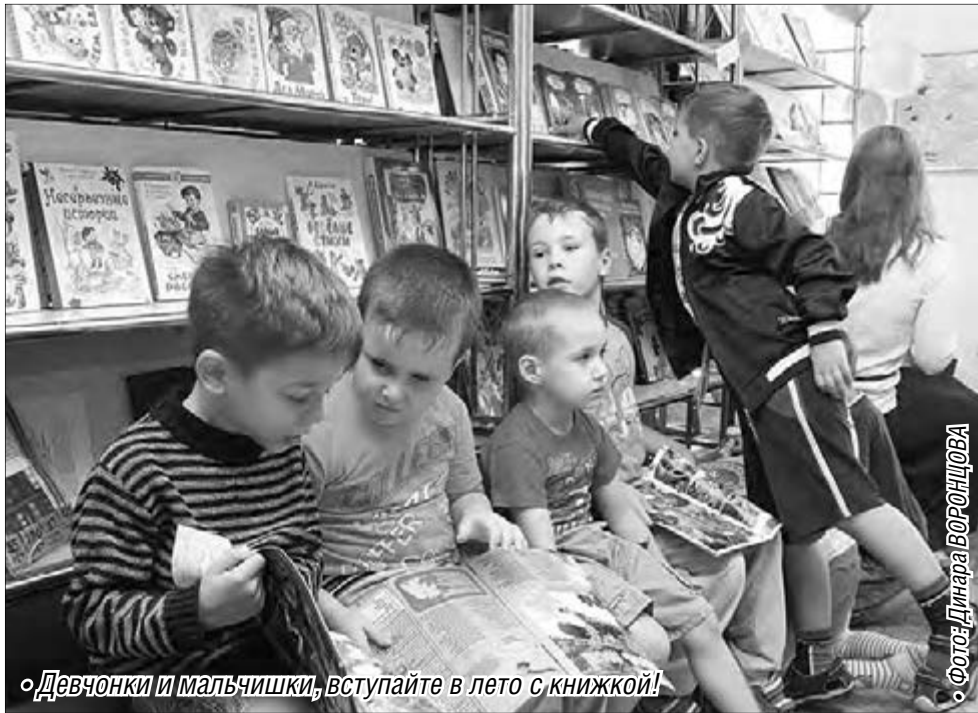
«Девчонки и мальчишки, вступайте в лето с книжкой!»

«Библиотеку под открытым небом», в которой оживут любимые сказочные персонажи. Там найдется место игре, знаниям и творчеству. Дети будут танцевать, водить хоро-воды, отвечать на вопросы познавательной викторины, участвовать в литературных конкурсах, познакомиться с выставкой новых книг. Отражением радостного настроения этого праздника станут рисунки на асфальте. Всех ребят и их родителей ждут 1 июня в 15.00 на площадке возле центральной детской библиотеки имени Кондратовской по адресу: пр. Ленина, 124.