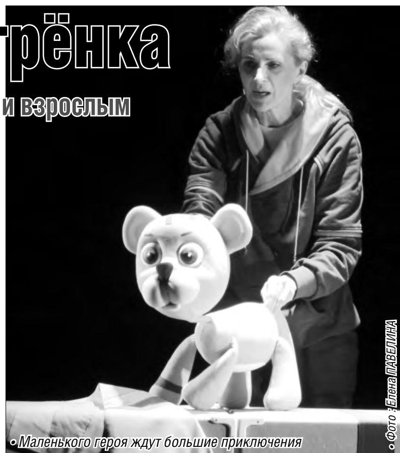
«Маленького героя ждут большие приключения»