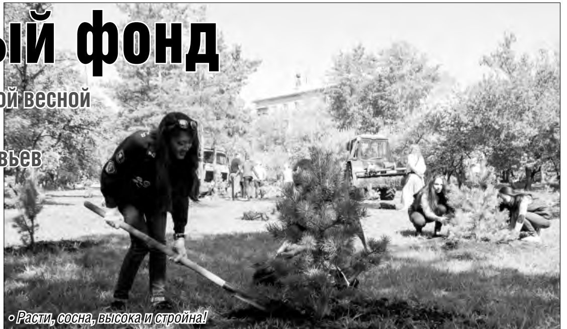
• Расти, сосна, высока и стройна!

Этой весной силами МГТУ территория Магнитогорска пополнилась 150 саженцами. 60 сосенок стройотрядовцы разместили в сквере Трех поколений, еще столько же посадили