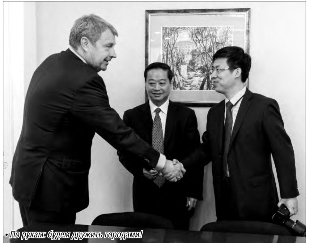
• По рукам: будем дружить городами!

На встрече с главой города представители Китая обсудили перспективы сотрудничества. По словам и. о. начальника отдела