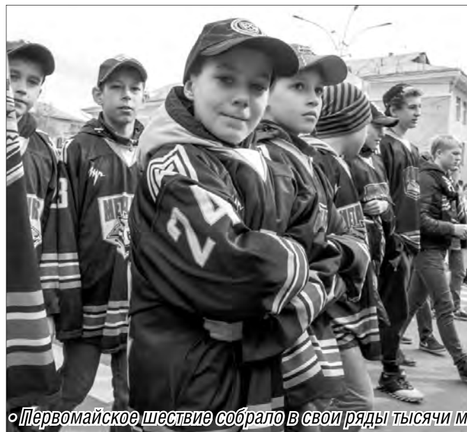
Первомайское шествие собрал в свои ряды тысячи магнитогорцев от мала до велика