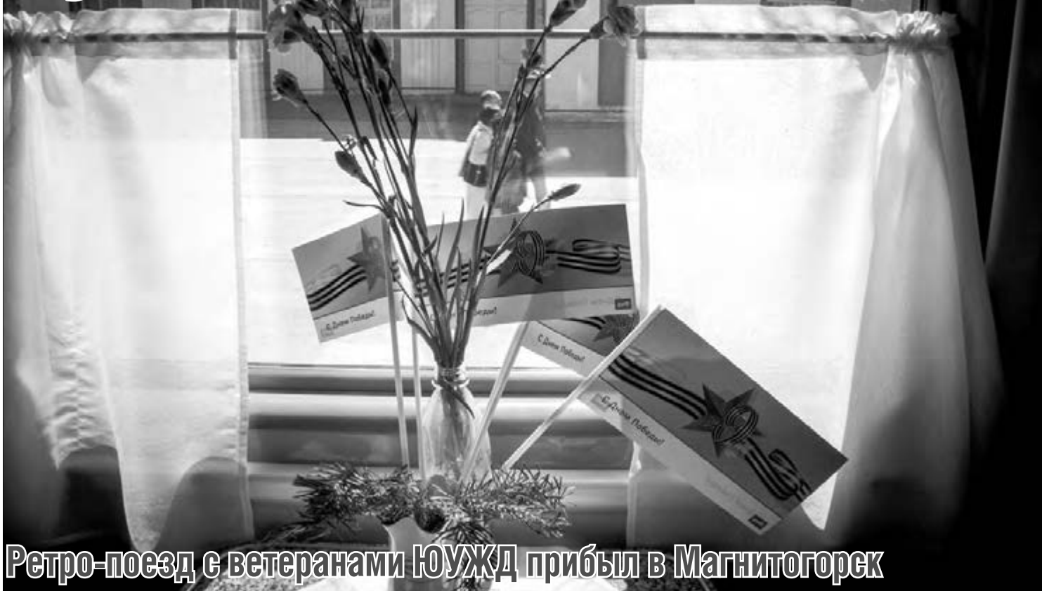
Ретро-поезд с ветеранами ЮУЖД прибыл в Магнитогорск

Традиционный маршрут посвящен Великой Победе, его пассажиры – 90 ветеранов железной дороги, 12 из которых – магнитогорцы.