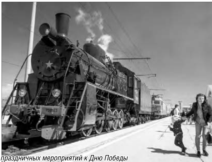
Ретро-поезд положил символическое начало череде праздничных мероприятий к Дню Победы