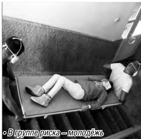
В группе риска – молодёжь

Перед участниками собрания выступил нарколог подросткового наркологи-