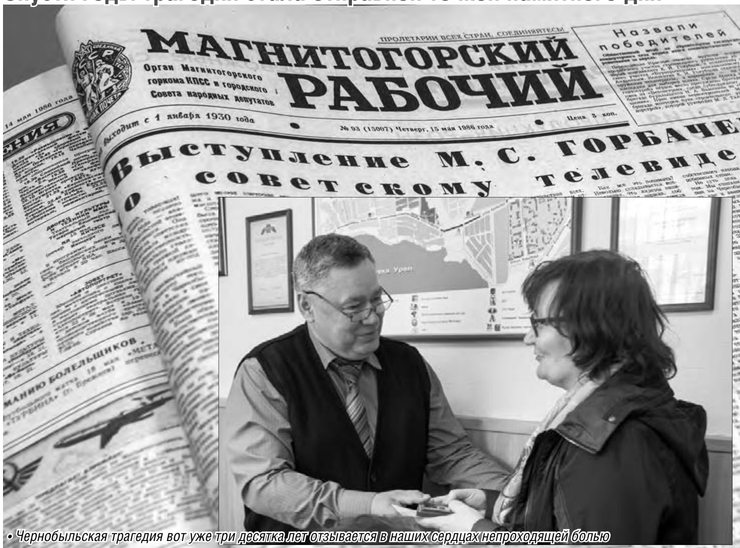
• Чернобыльская трагедия вот уже три десятка лет отзывается в наших сердцах непроходящей болью

Спустя годы трагедия стала отправной точкой памятного дня