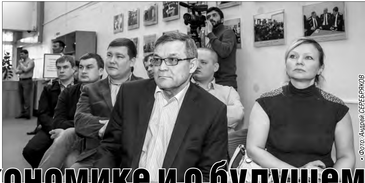
• Фото: Андрей СЕРЕБРЯКОВ