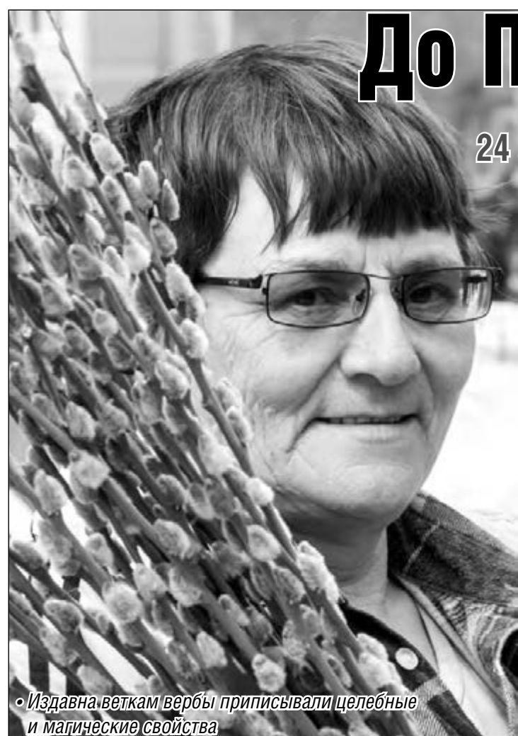
• Издавна веткам вербы приписывали целебные и магические свойства

Православные христиане готовятся к великому празднику.