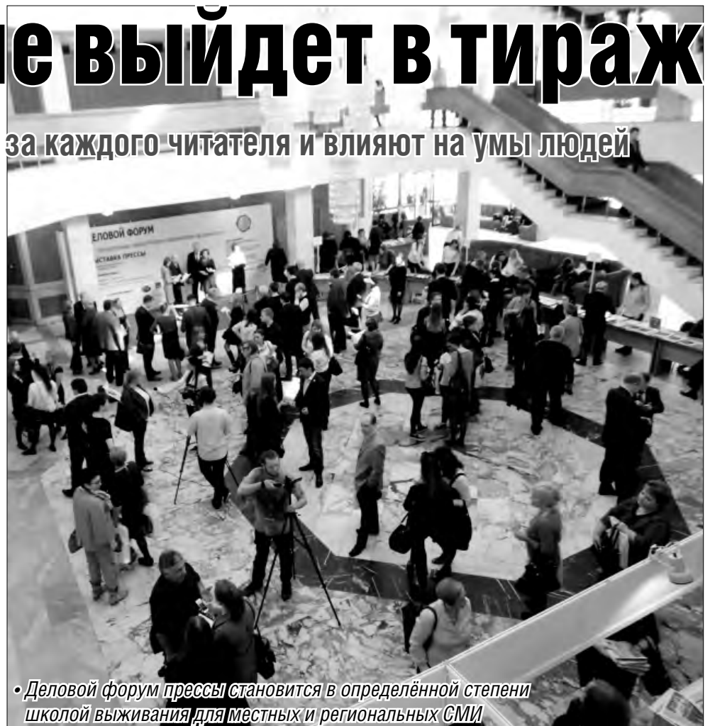
• Деловой форум прессы становится в определённой степени школой выживания для местных и региональных СМИ