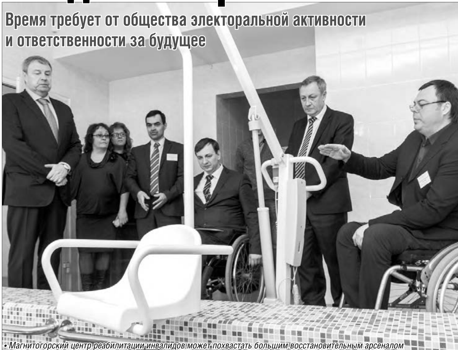
• Магнитогорский центр реабилитации инвалидов может похвастаться большим восстановительным арсеналом

Время требует от общества электоральной активности и ответственности за будущее