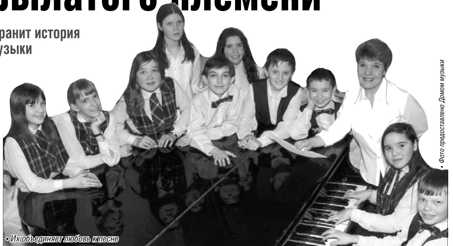
• Их объединяет любовь к песне

Спустя ровно четыре года после создания «Жаворонок» появился хор «Орленок», своеобразное которого заключалось в смешении мальчишеских и девчоночьих голосов.