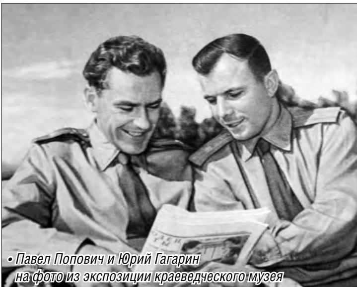
• Павел Попович и Юрий Гагарин на фото из экспозиции краеведческого музея

Тем, кто хочет с пользой провести юбилейный День космонавтики, нужно обязательно посетить постоянно действующую экспозицию «Магнитка и космос» Магнитогорского историко-краеведческого музея. Здесь представлены не только экспонаты, связанные с нашим земляком, почетным гражданином Магнитогорска космонавтом Павлом Поповичем. Выставка подробно знакомит и