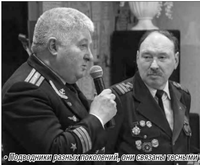
«Подводники разных поколений, они связаны тесными узами морского братства»