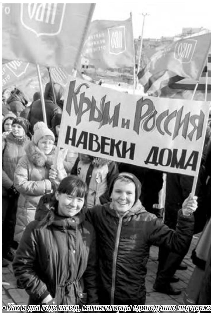
• Как и два года назад, магнитогорцы единодушно поддержали воссоединение Крыма с Россией

Все мы – очевидцы образования очередной славной вехи в истории нашего государства