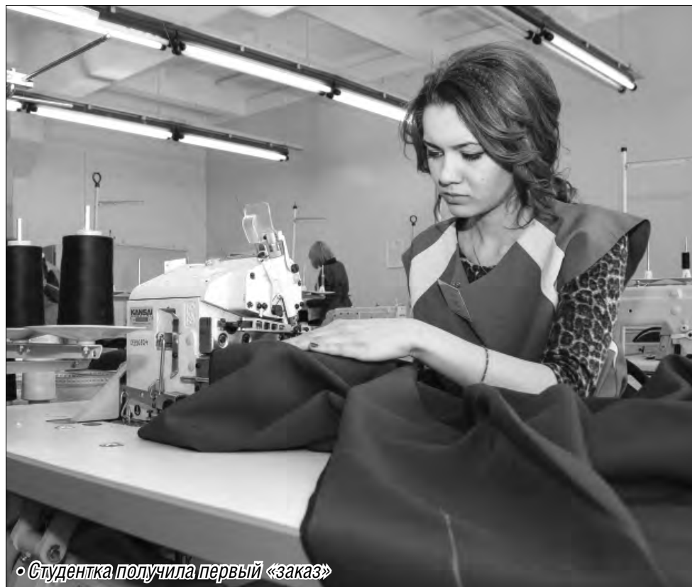
• Студентка получила первый «заказ»