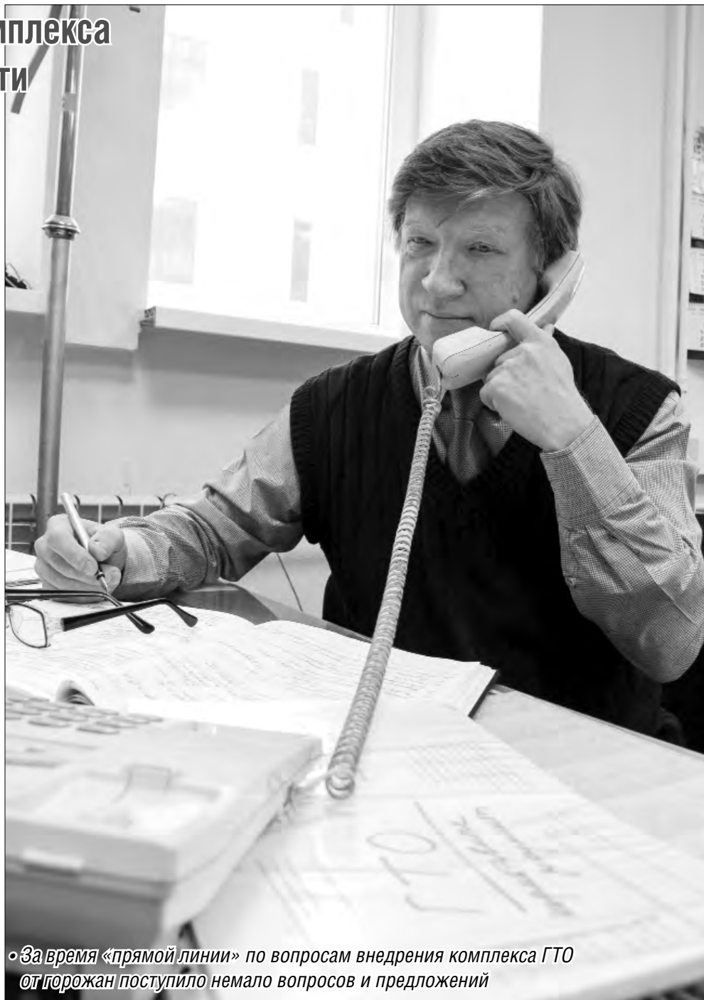
«Во время «прямой линии» по вопросам внедрения комплекса ГТО от горожан поступило немало вопросов и предложений»

– На Всероссийском интернет-портале комплекса ГТО по адресу: www.gto.ru мож-