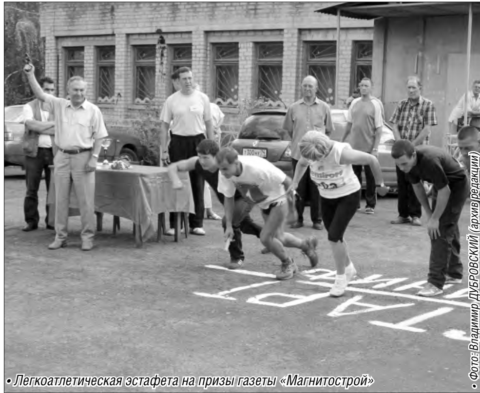
• Легкоатлетическая эстафета на призы газеты «Магнитострой»

История движения ГТО в Магнитогорске ведёт отсчёт с 1931 года