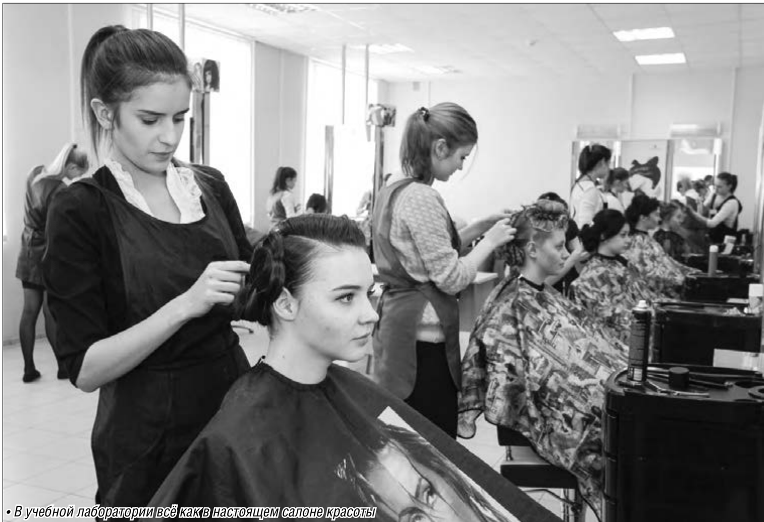
• В учебной лаборатории всё как в настоящем салоне красоты