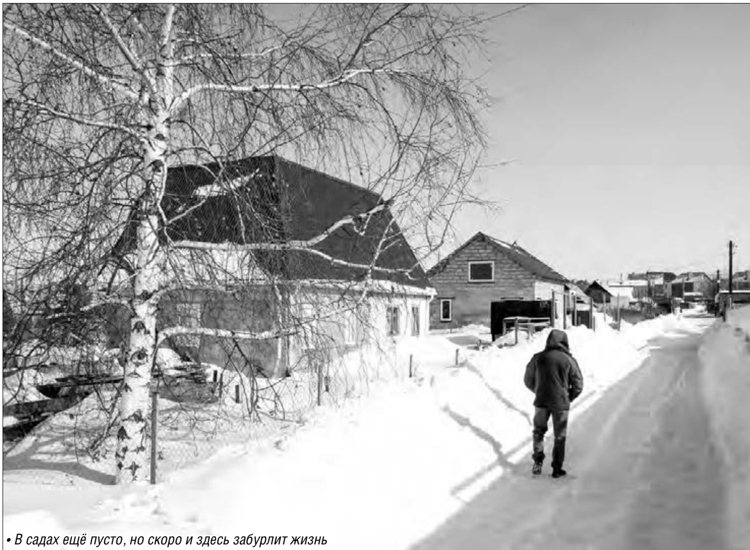
• В садах ещё пусто, но скоро и здесь забурлит жизнь

Считавшийся элитным сад сегодня в упадке