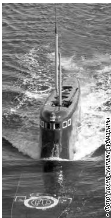
• На подводной лодке магнитогорцев всегда встречают как дорогих гостей