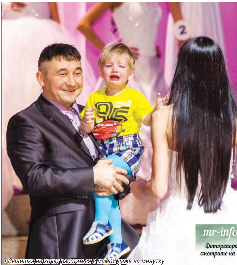
◦ Сынишка не хочет расстаться с мамой даже на минутку

mr-info.ru Фоторепортаж смотрите на сайте