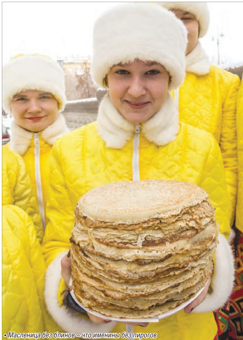
• Масленица без блинов – что именины без пирогов

Разогреваем сковороду, выпекаем тонкие блинчики. Готовые складываем стопкой на тарелке, смазывая края каждого блина маслом и накрывая крышкой или большой тарелкой. Пока блинчики набирают эластичность под крышкой, занимаемся начинкой. Творог