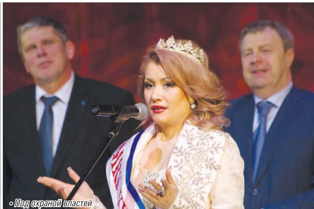
◦ Под охраной Властей