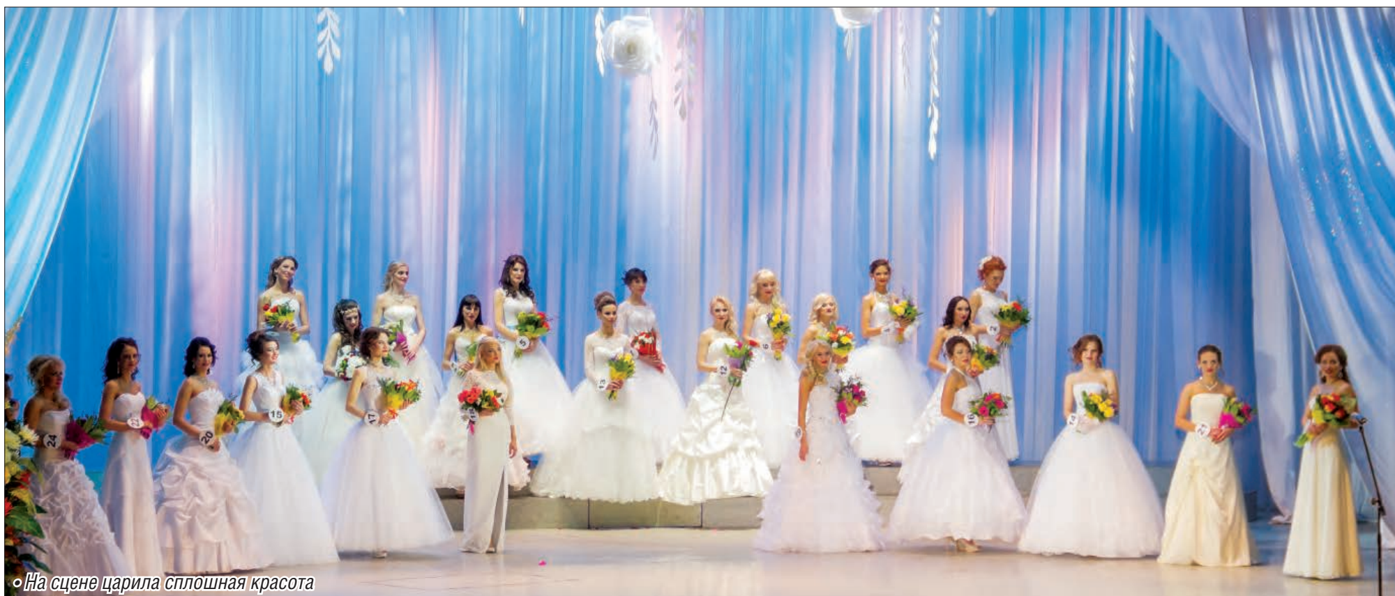
◦ На сцене царила сплошная красота

В нашем городе состоялась коронация самой красивой женщины 2016 года