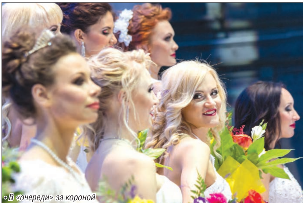
◦ В «очереди» за короной