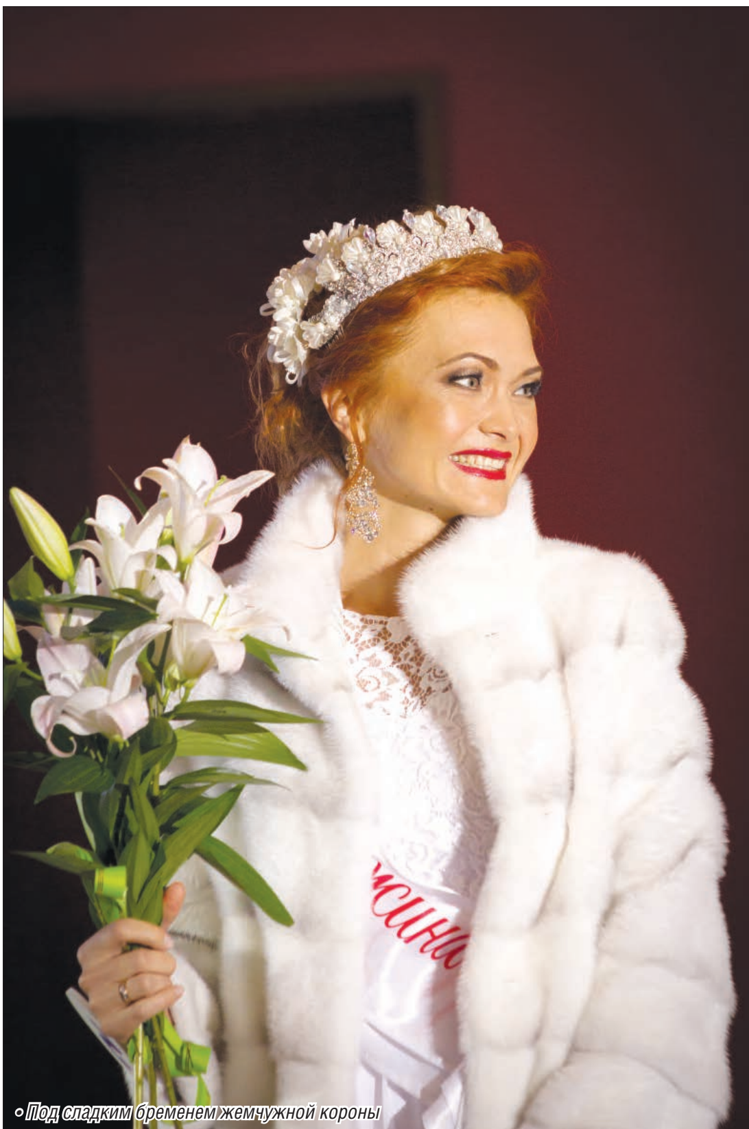
◦ Под сладким бременем жемчужной короны