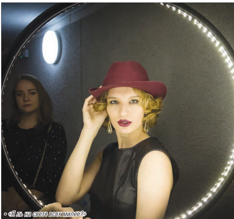
◦ «Я ль на свете всех милее?»