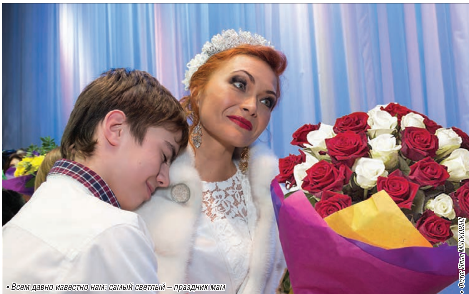
• Всем давно известно нам: самый светлый – праздник мам