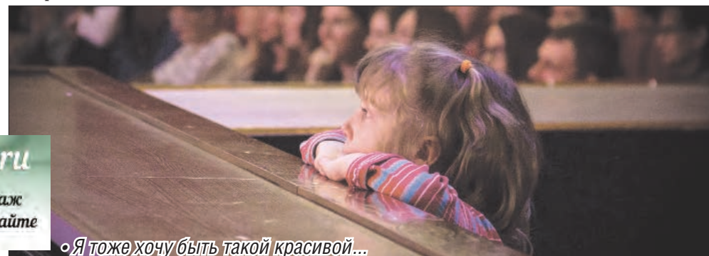
◦ Я тоже хочу быть такой красивой...