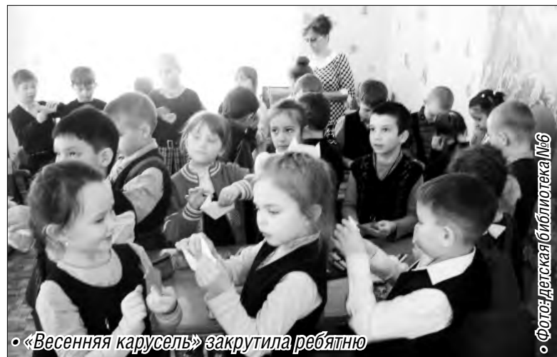
• «Весенняя карусель» закрутила ребятню

Для маленьких читателей гостеприимно распахнула двери творческая мастерская «Мягкие лапки, а в лапках цапаки».