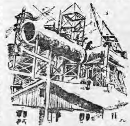
Прокладка газопроводов на домне № 4

Треугольнике доменного цеха решительную борьбу и работу, но и за частоту раб