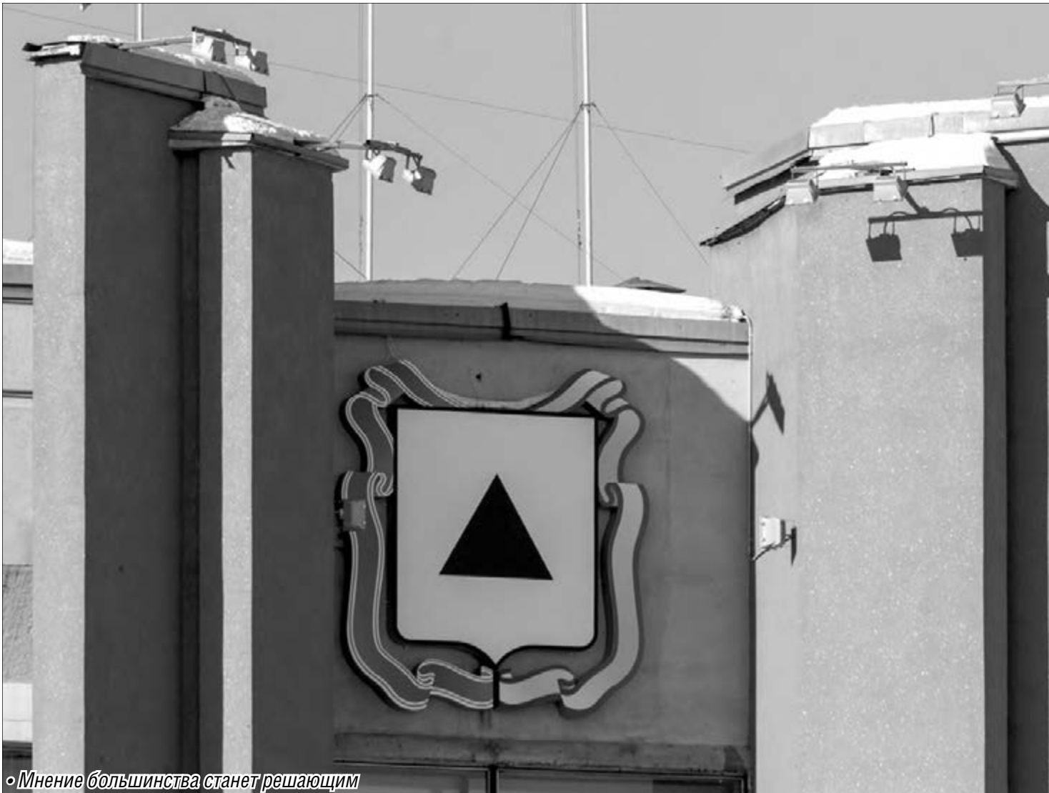
Мнение большинства станет решающим

Магнитогорцам предлагают дать оценку деятельности местной власти