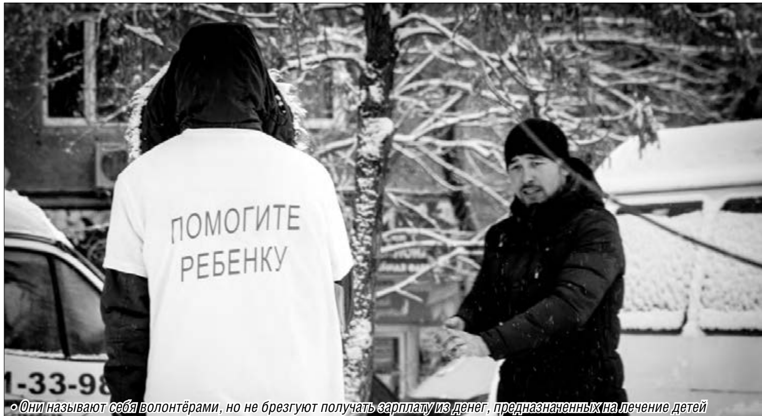
• Они называют себя волонтерами, но не брезгают получать зарплату из денег, предназначенных на лечение детей

Предприимчивость граждан порой не знает границ