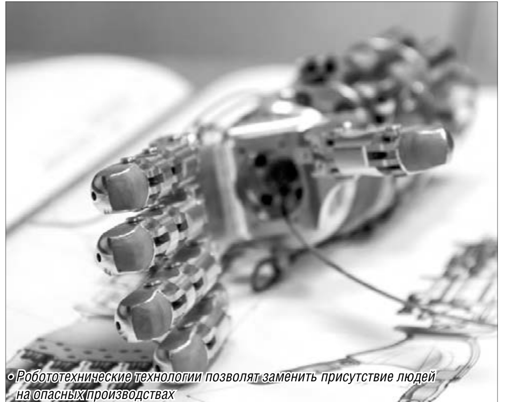
Робототехнические технологии позволят заменить присутствие людей на опасных производствах

В ходе совещания с участием руководства предприятия «Андроидная техника» и ведущих вузов главе региона представили несколько проектов на базе компании, предполагающих государственную поддержку. Речь идет о создании технопарка «Робототехника» и робототехнического кластера. В частности, инновационным технопаркам после прохождения аккредитации предо-