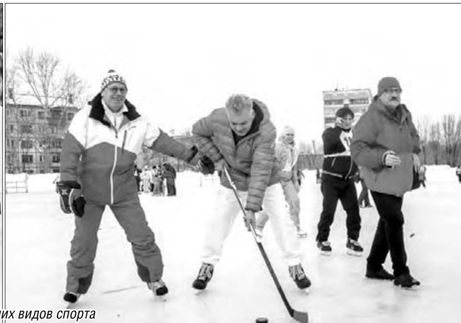
• Городской праздник привлек большое число участников и зрителей – поклонников зимних видов спорта

В рамках общероссийской акции, организованной Министерством спорта Российской Федерации и Союзом конькобежцев России, в состязаниях на спортивном празднике «Лед надежды нашей» приняли участие более двух сотен горожан.