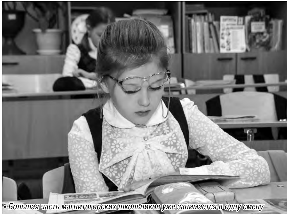
• Большая часть магнитогорских школьников уже занимается в одну смену