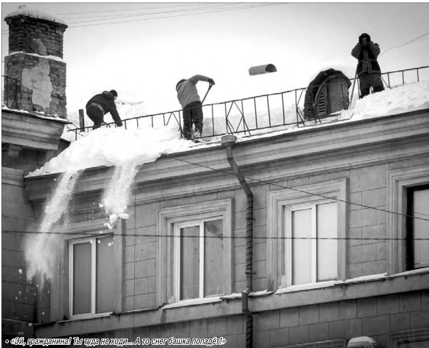
«Эй, гражданина! Ты туда не ходи... А то снег башка попадёт!»

Из-за оттепели возрастает опасность схода снега с крыш