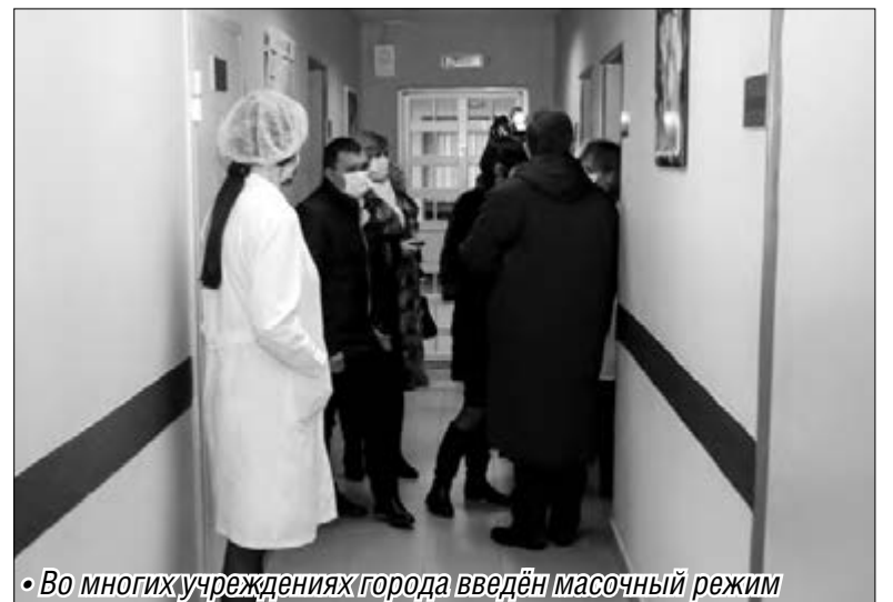
• Во многих учреждениях города введен масочный режим

На заседании штаба было отмечено, что в сложных условиях роста заболеваемости без перебоев работают медицинские учреждения, ПЦР-лаборатория, где определяют вирусы, в том числе и H1N1. В аптеках города ситуация в сравнении с минувшей неделей, когда не