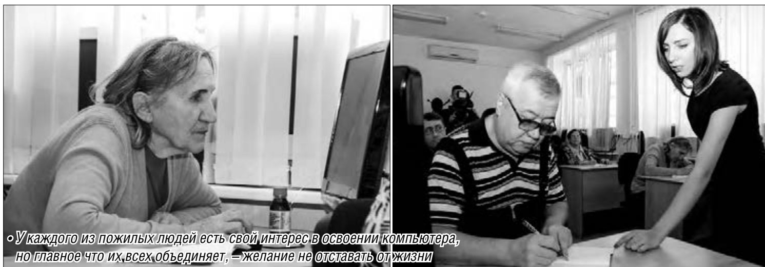
«У каждого из пожилых людей есть свой интерес в освоении компьютера, но главное что их всех объединяет, – желание не отставать от жизни»

Работать с клавиатурой, выходить в Интернет, скачивать фотографии, отправлять письма по электронной почте – все это будут уметь пожилые магнитогорцы.