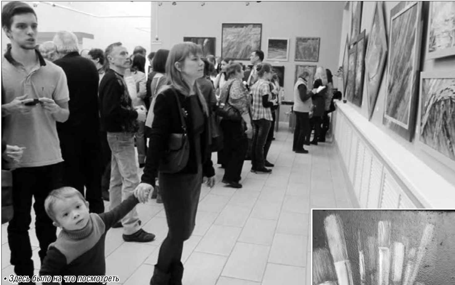
• Здесь было на что посмотреть

В Магнитогорской картинной галерее открылась выставка, посвященная мифологии