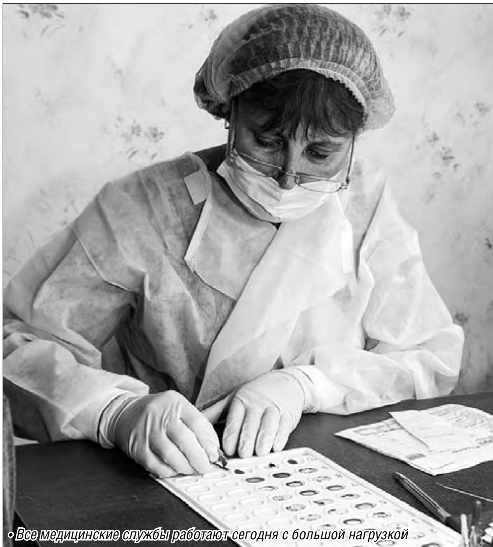
«Все медицинские службы работают сегодня с большой нагрузкой»

По итогам заседания штаба всем лечебным учреждениям было рекомендовано по-прежнему соблюдать требования Роспотребнадзора по профилактике распространения вирусных инфекций. Специалистам