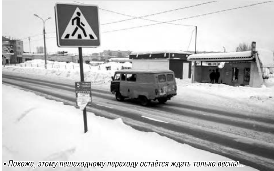
• Похоже, этому пешеходному переходу остаётся ждать только весны!

Глава региона обратил внимание на эффективность уборки улиц