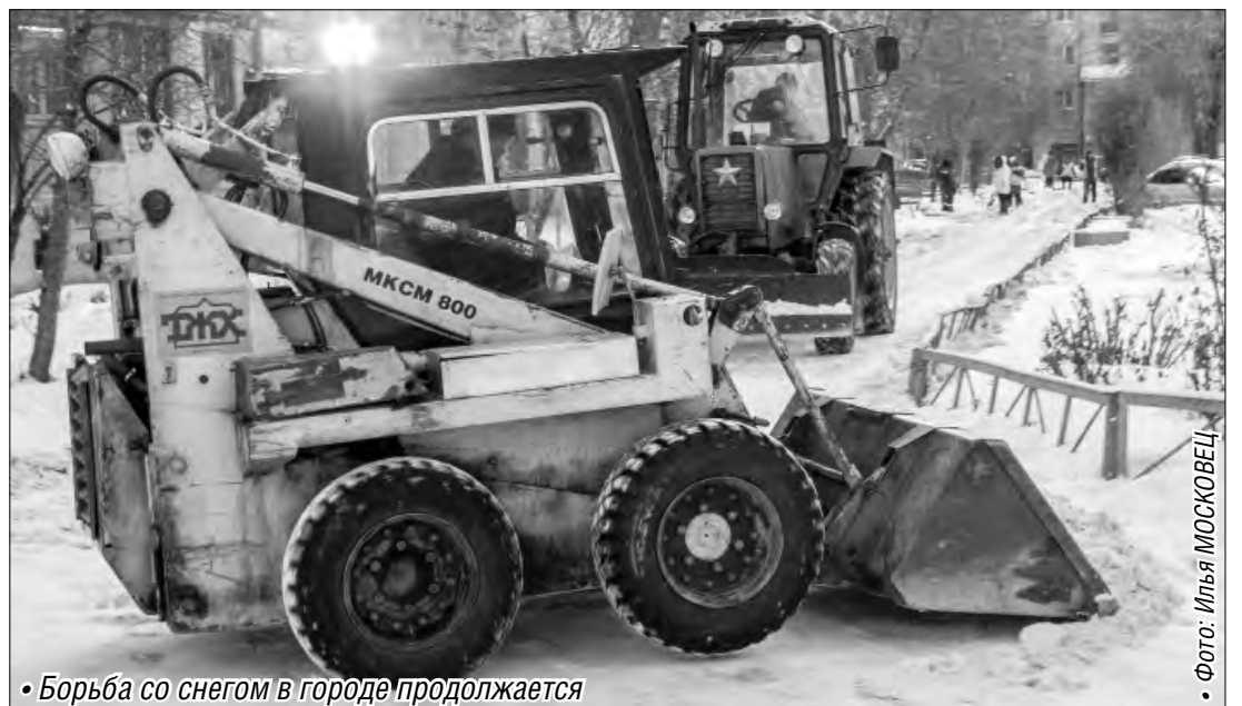
• Борьба со снегом в городе продолжается

«Насколько заметны для простых горожан такие усилия?» – спросили мы у жителей Магнитогорска. И выяснили, что, несмотря на все старания служб, уровень нареканий со стороны горожан велик. Некоторые магнитогорцы обращают внимание на то, что существующие нормы Градостроительного кодекса не соблюдаются, тогда как местные власти обязаны следить за вы-