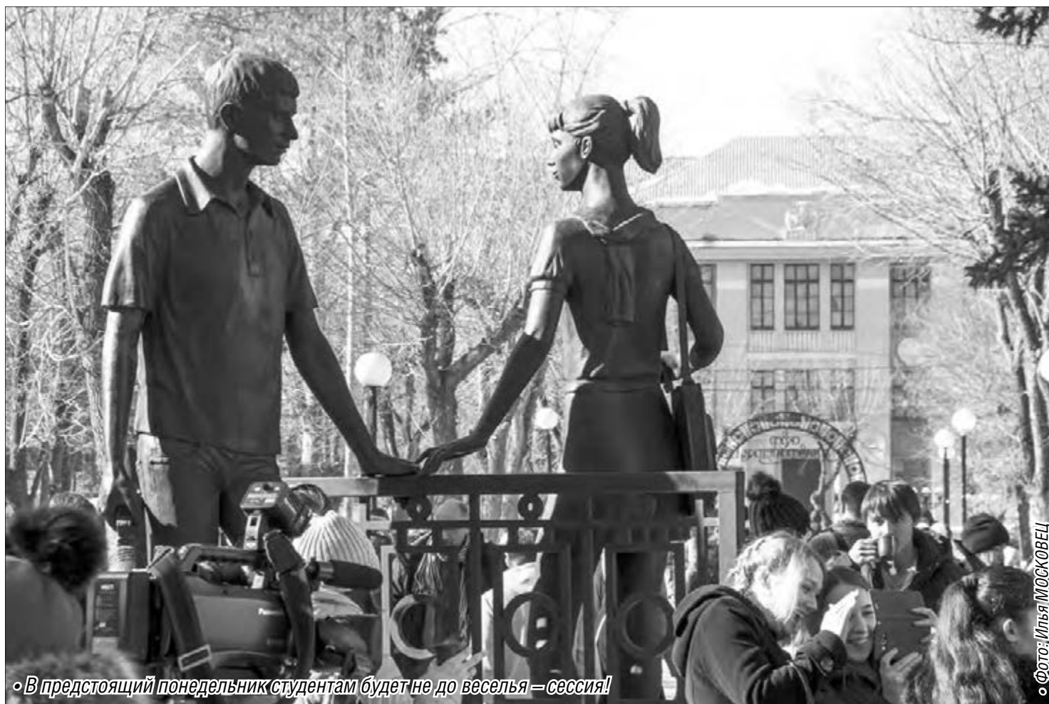
«В предстоящий понедельник студентам будет не до веселья – сессия!»

В понедельник студенты отмечают свой праздник – Татьянин день