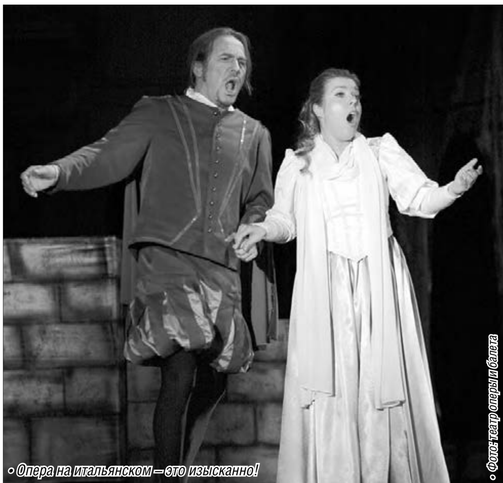
«Опера на итальянском — это изысканно!»

Театр оперы и балета приглашает на «Риголетто»