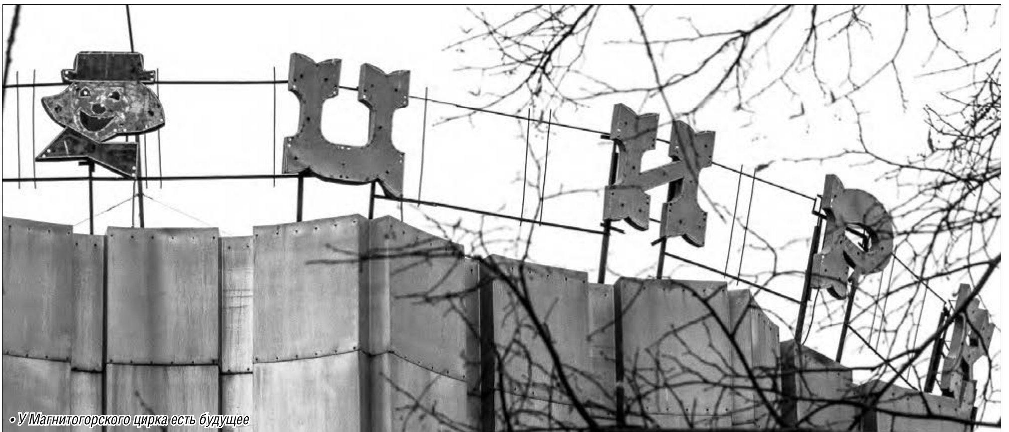
• У Магнитогорского цирка есть будущее