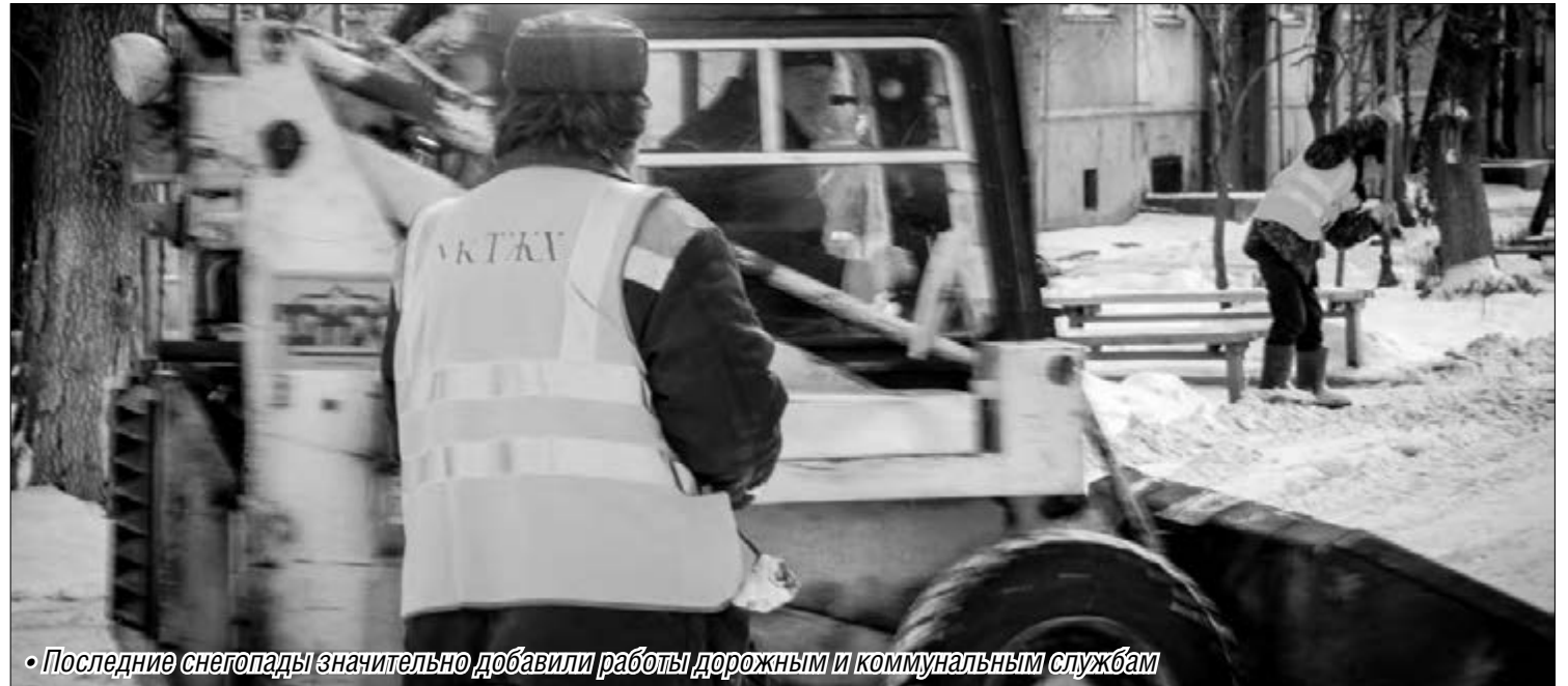
• Последние снегопады значительно добавили работы дорожным и коммунальным службам