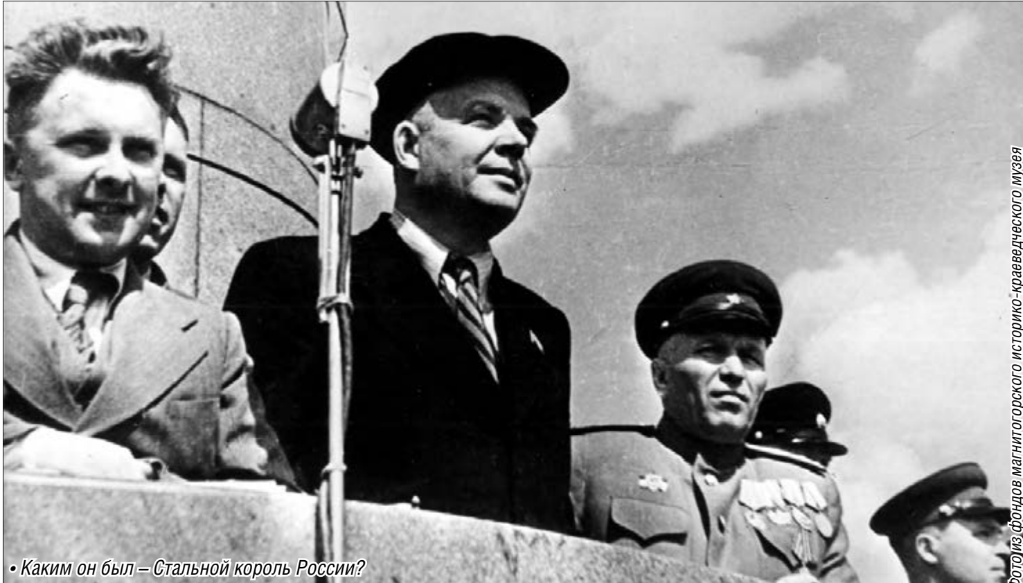
• Каким он был – Стаальной король России?

Личность «военного директора» Магнитки отразилась в книгах советских писателей