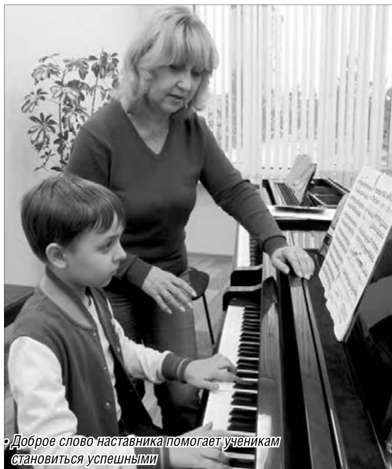
Доброе слово наставника помогает ученикам становиться успешными

С детства будущего педагога окружала классическая музыка. Мама – скрипачка, отец – виолончелист из Кракова с прекрасным голосом, который ценили и в театре Ла Скала, где он выступал, а позднее и в Магнитогорской хоровой капелле. Девочка участвовала в домашних концертах, усваивала для себя музыкальные образы.