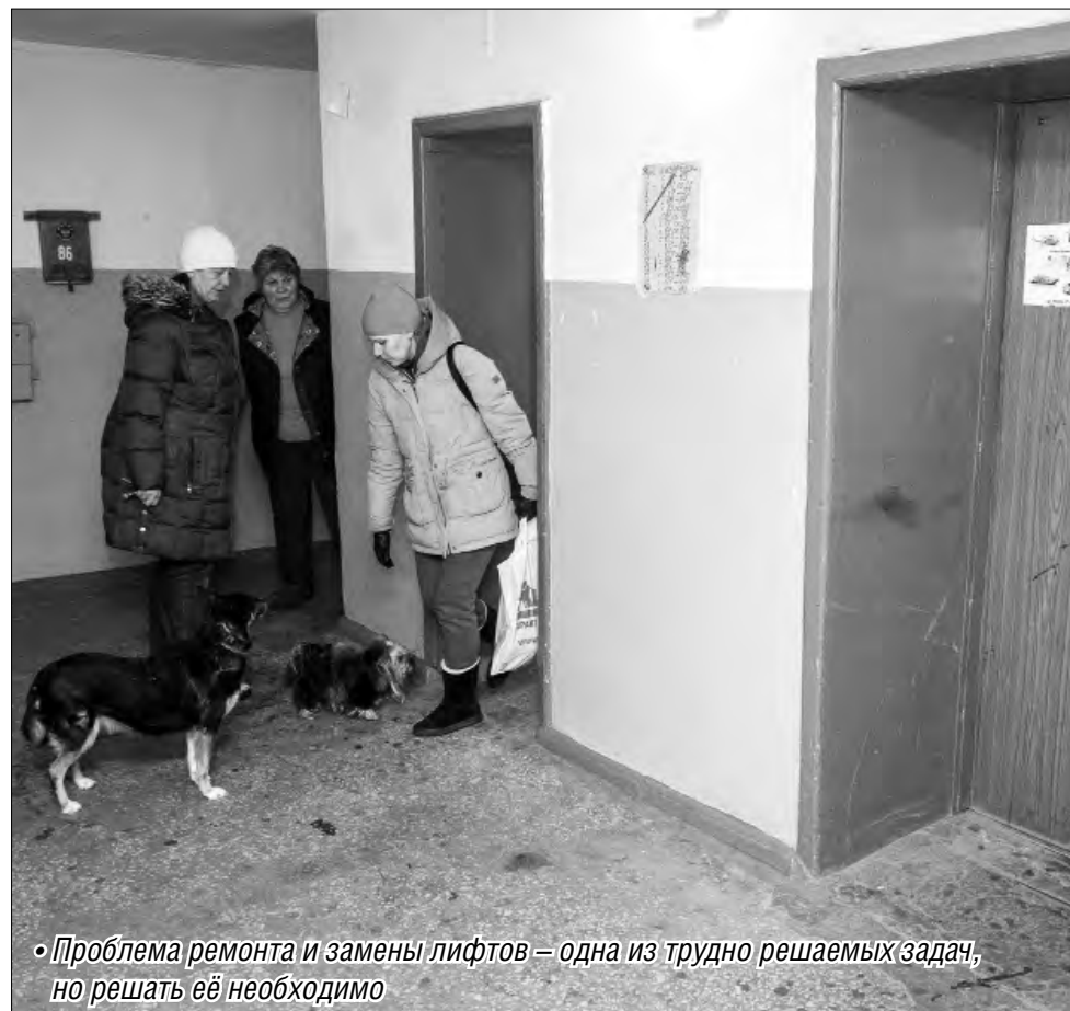
• Проблема ремонта и замены лифтов – одна из трудно решаемых задач, но решать её необходимо