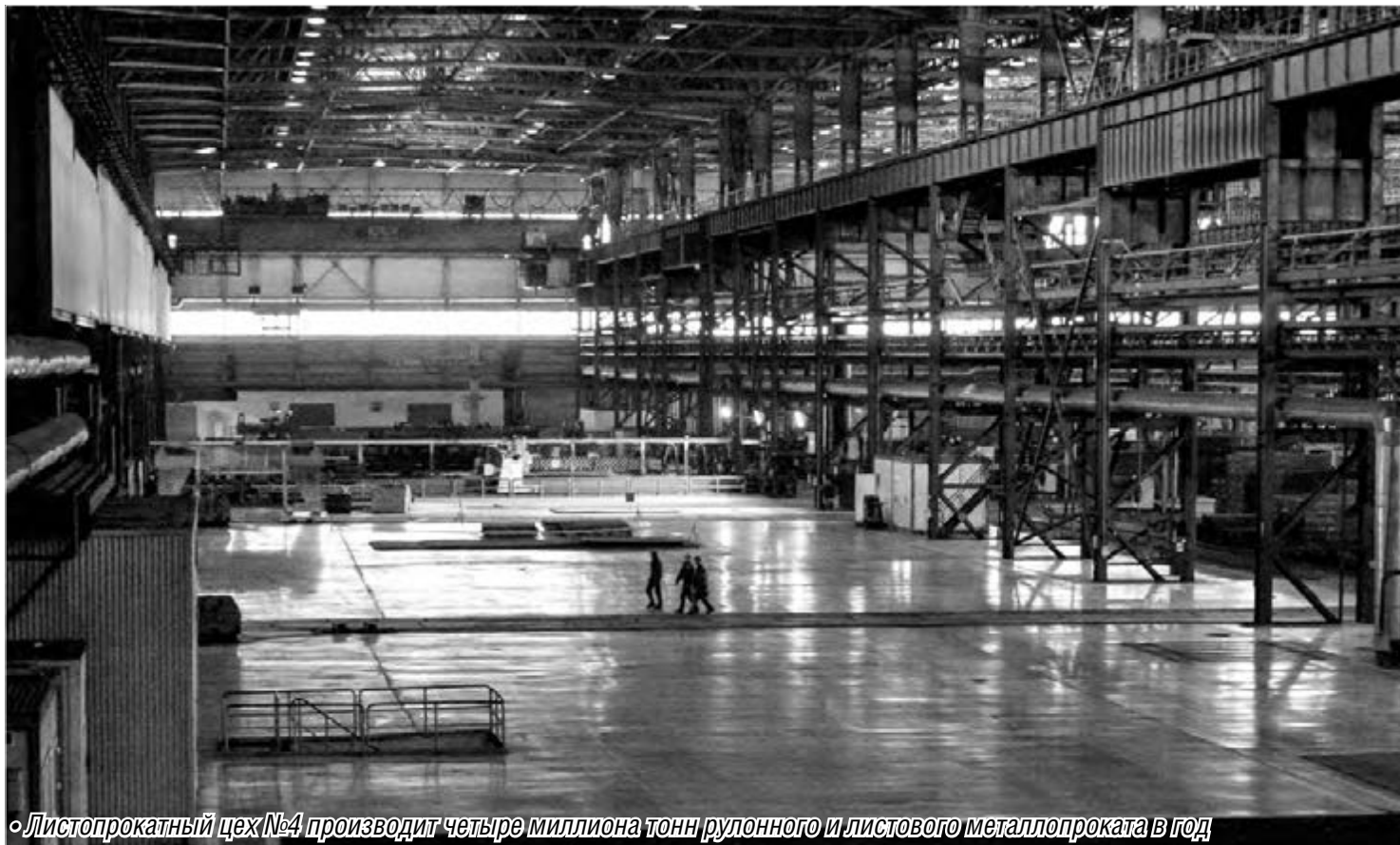
«Листопрокатный цех №4 производит четыре миллиона тонн рулонного и листового металлопроката в год»

Листопрокатному цеху №4 ОАО «ММК» – 55 лет