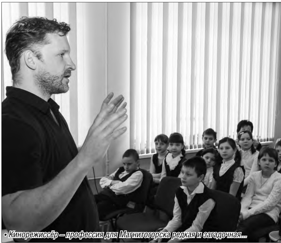
• Кинорежиссёр — профессия для Магнитогорска редкая и загадочная...

Школьники узнали тайны волшебного мира кино