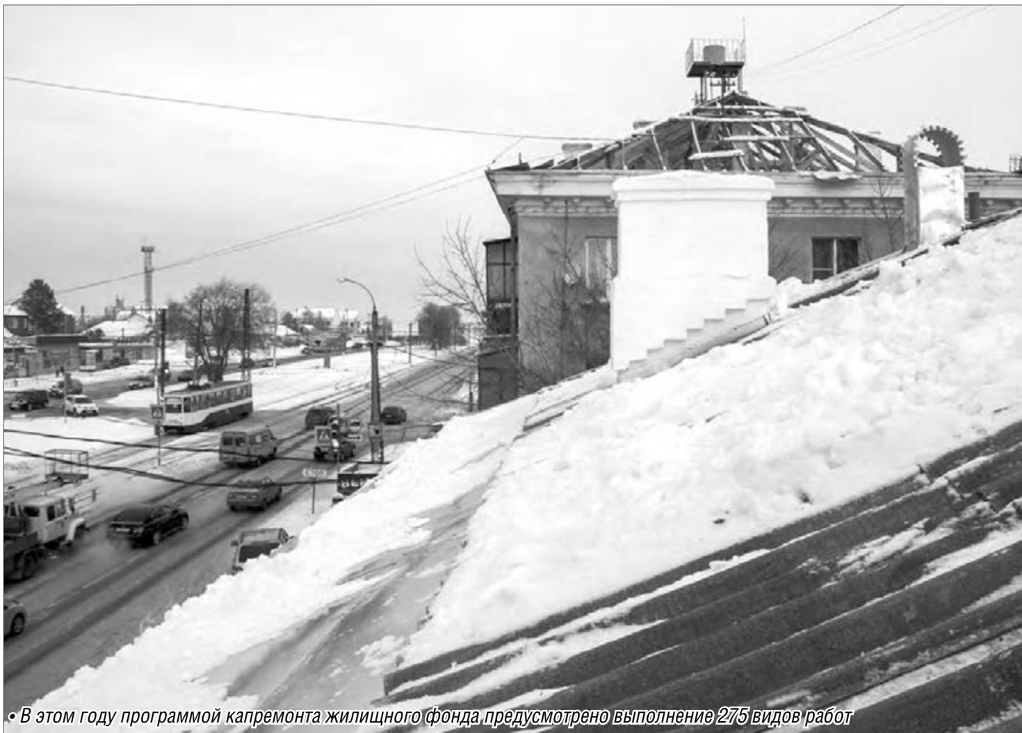
• В этом году программой капремонта жилищного фонда предусмотрено выполнение 275 видов работ

В Магнитогорске продолжают работы в соответствии с региональной программой капремонтов многоквартирных домов