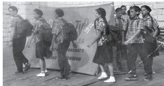
Выступление «Веселых туристов», 1960-е гг. /