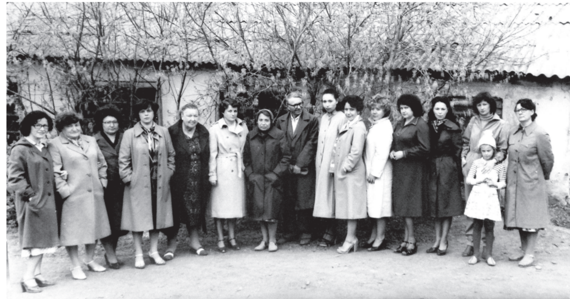
У литературного барака

На учебной экскурсии были сама Нина Георгиевна, поэт Михаил Люгарин, представители городской админист-