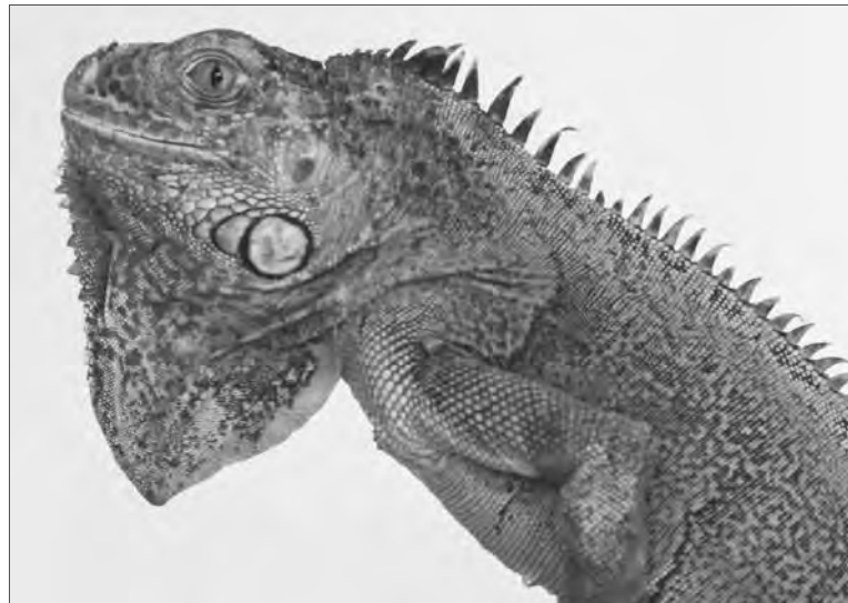
Редкие животные – под охраной

Документы на животных челябинца предоставить не смог, как не предъявил и таможенную декларацию, которую необходимо оформить при перемещении животных, говорится в сообщении. «По словам сотрудников отдела герпетофауны Екатеринбургского зоопарка, среди изъятых земноводных и пресмыкающихся есть довольно редкие и дорогие виды. Например, новозеландские зеленые гекконы, скальные психоделические гекконы и жабы-клоуны, одни из самых маленьких жаб в мире. Часть животных входит в категорию широко распространенных видов, такие, как африканские ля-