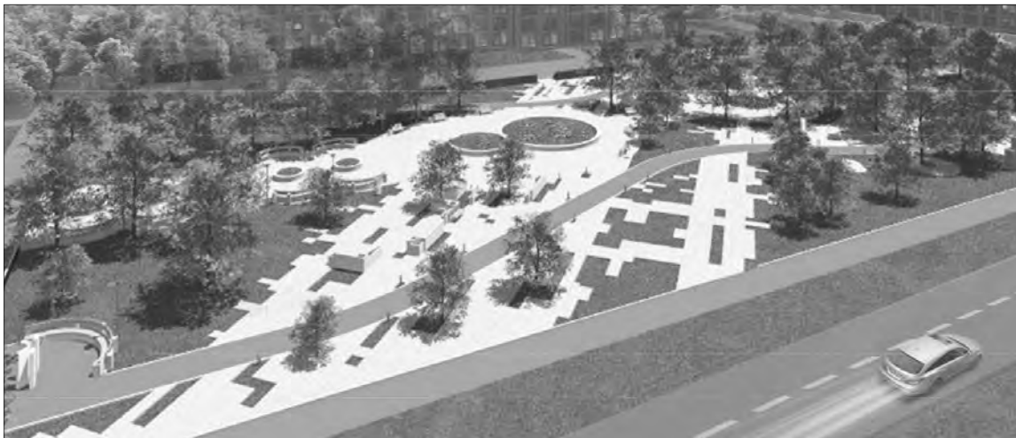
Эскизный проект благоустройства сквера имени Бориса Ручьева

Сотрудники управления архитектуры и градостроительства администрации города призвали на помощь науку. Активно откликнулись на их просьбу в Институте строительства, архитектуры и искусства МГТУ имени Носова. Совместный опыт оказался успешным. Проект благоустройства сквера имени Бориса Ручьева приятно удивил своей новизной и неординарностью.