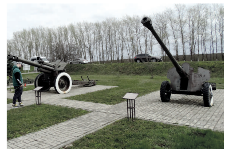
На мемориале «Тербунский рубеж»