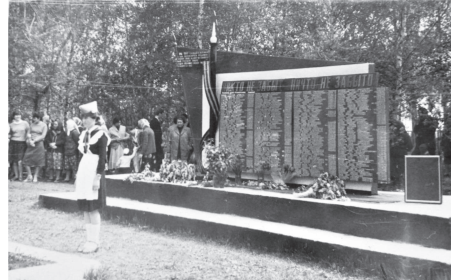
На митинге у мемориала в Большой Поляне, 1980-е годы /