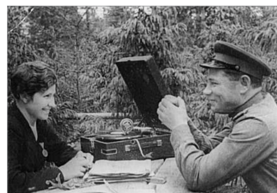
Поездка на фронт