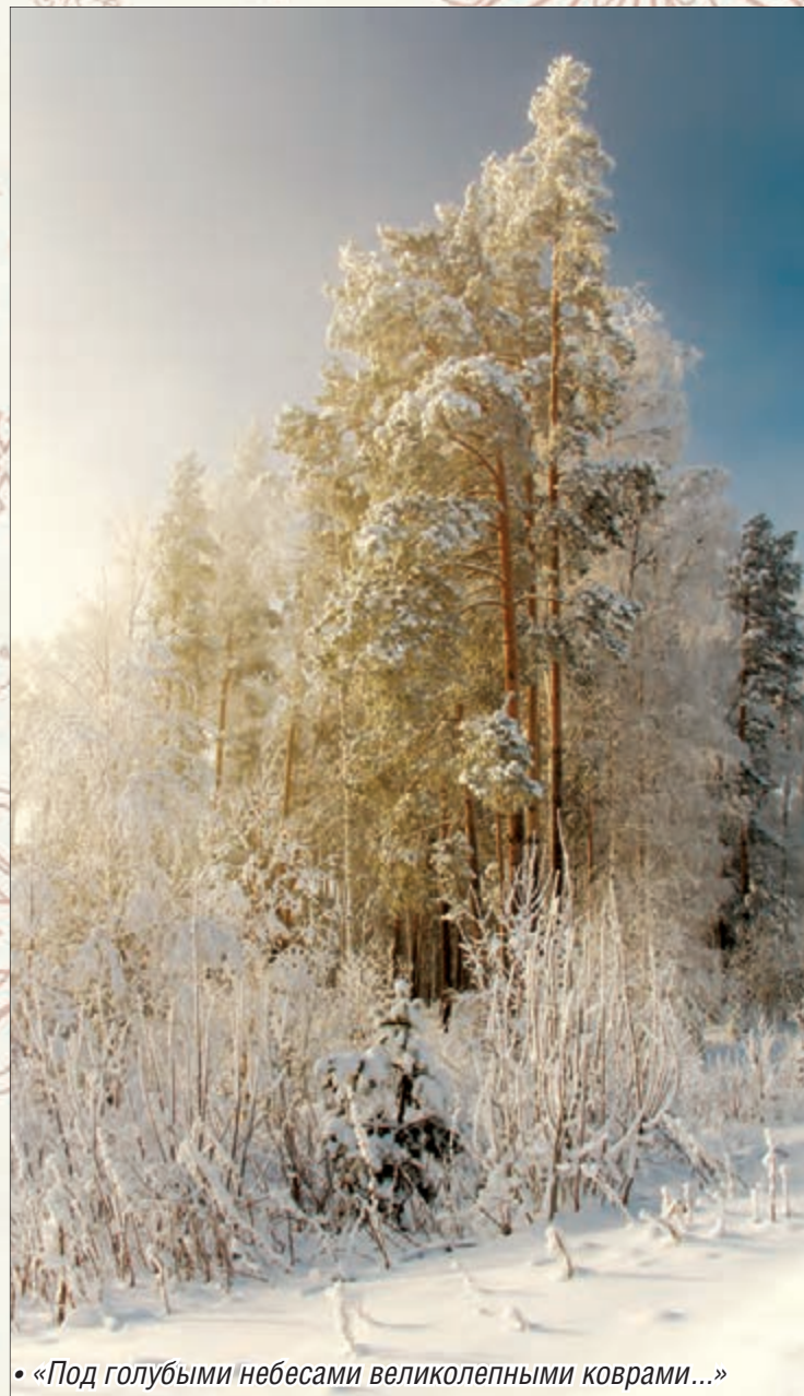
• «Под голубыми небесами великолепными коврами...»