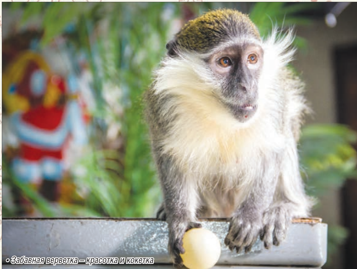
◦ Забавная верветка – красotka и кокетка

Мартышка может быть и задиристой, и капризной, и мсти-