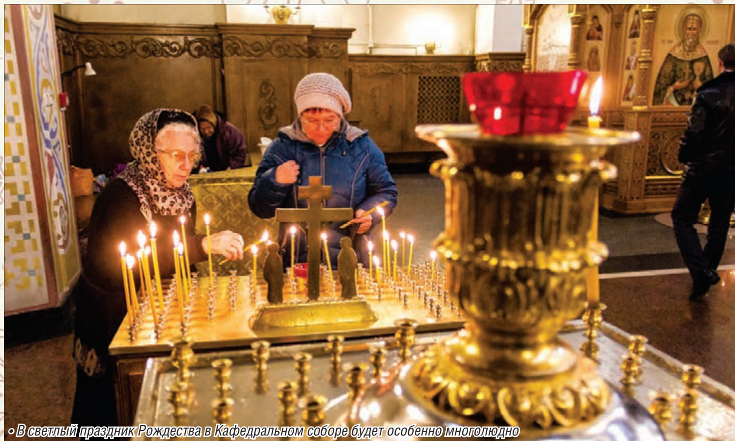
◦ В светлый праздник Рождества в Кафедральном соборе будет особенно многолюдно

Скоро для православных наступит один из главных христианских праздников – Рождество