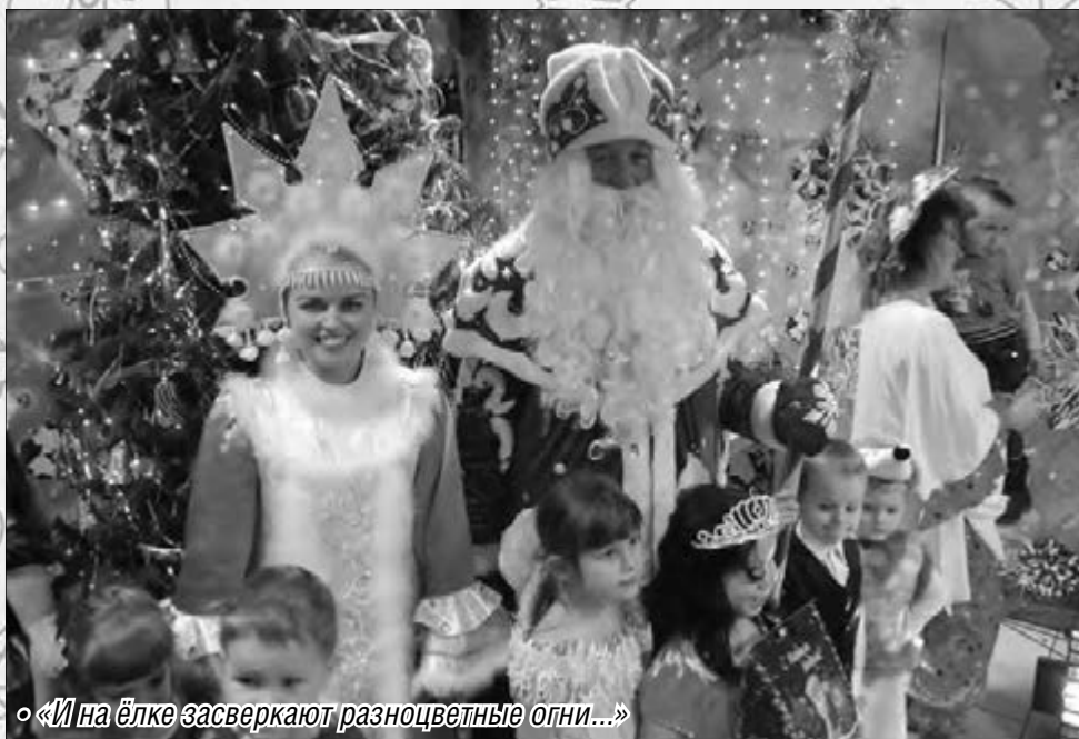
«И на ёлке засверкают разноцветные огни...»

Его главными героями стали тигр, обезьяна, черепаха, попугай и синий бегемот, задумавшиеся, как же им встретить любимый праздник. Вставить колючки в лоскутную шкуру тигра или нарядить игрушками пальму – все это выглядело бы смешно. А тут еще злючка Дюдюка Дормидонтовна, которая делает все наоборот: начала отгадывать с малышами загадки, она неверные ответы подсказывает, песню затеяли – снова мешает. Хорошо хоть семь нот дала с ребятами разучить. Сначала тигр и его друзья попросили назвать слова, где спряталась каждая из ноток. Из «до» получился домик, из «ре» – ребячья болтовня, из «ми» – микстура, нота «фа» дала основу для слова «фантазия», «оль» превратилась в средство послонить, «ля» напомнила о лягушке, «си» прозвучала как сирена. Из всех этих назва-