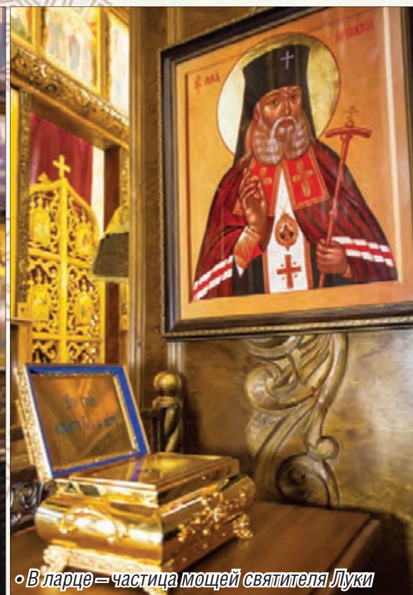
◦ В ларце – частица мощей святителя Луки