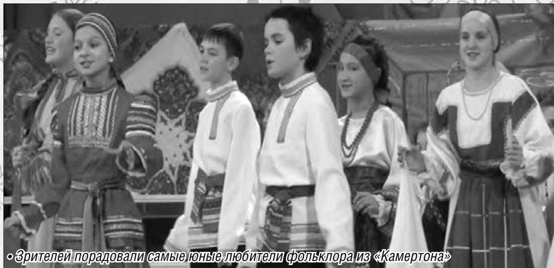
«Зрителей порадовали самые юные любители фольклора из «Камертона»

– В середине двора три высоких терема, как во первом терему светил месяц в окно, во втором терему – красно солнышко,