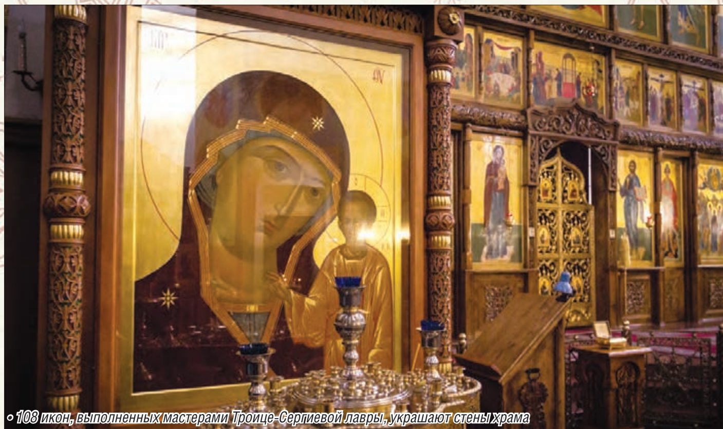
◦ 108 икон, выполненных мастерами Троице-Сергиевой лавры, украшают стены храма