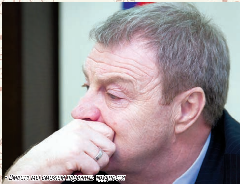
• Вместе мы сможем пережить трудности