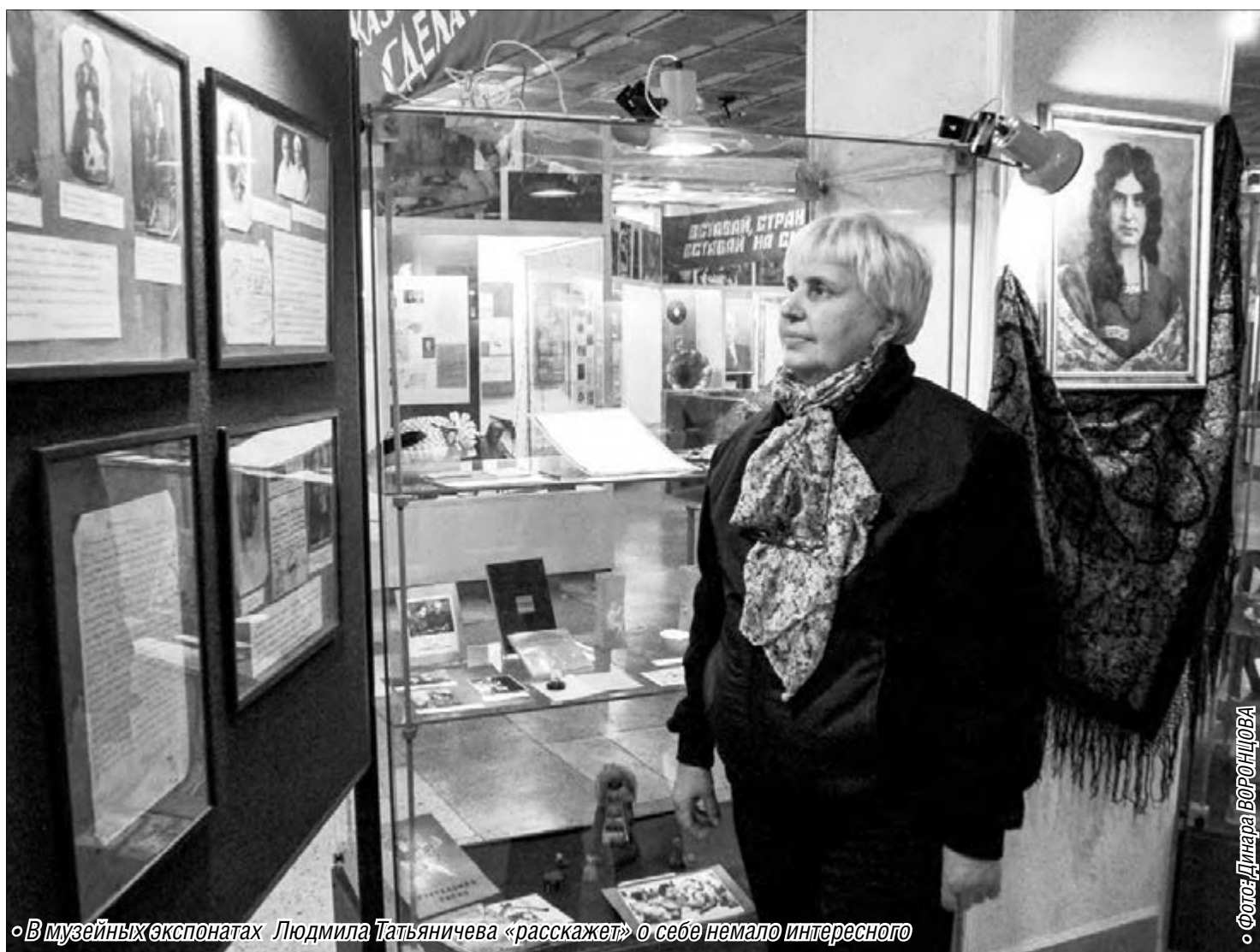
В музейных экспонатах Людмила Татьяничева «расскажет» о себе немало интересного