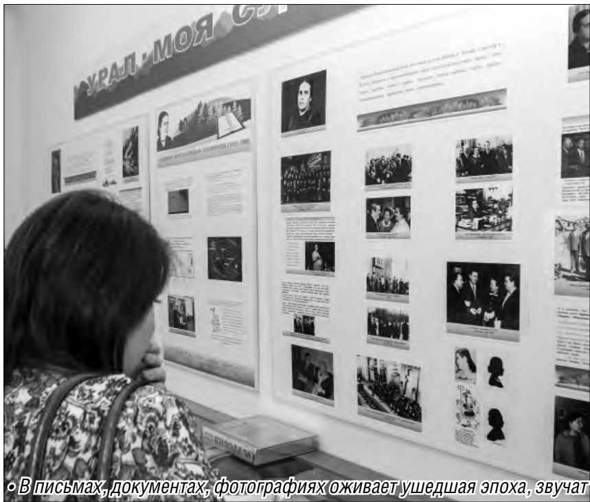
В письмах, документах, фотографиях оживает ушедшая эпоха, звучат нетленные стихи...

Людская память бережно хранит события далёких лет и дорогих сердцу людей