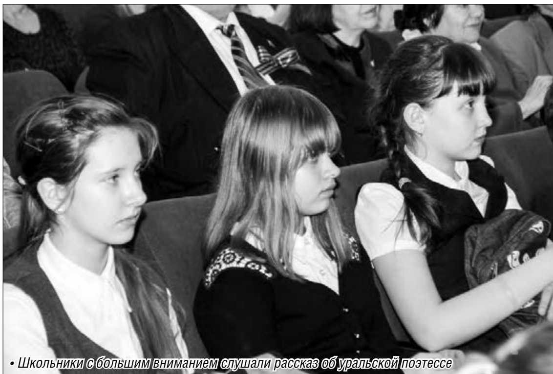
• Школьники с большим вниманием слушали рассказ об уральской поэтессе