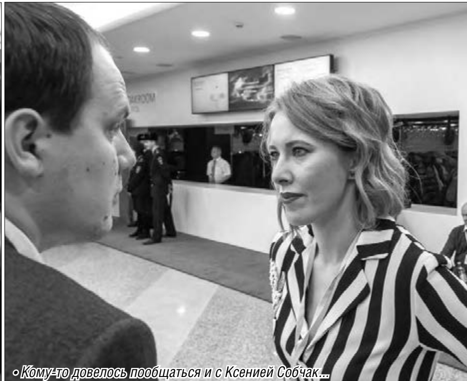
◦ Кому-то довелось пообщаться и с Ксенией Собчак...

«Кубанские»: часть названия держащий закрывает ладонью). Слева – «Школьная страна», «Путин град», «Владимир из Владимира», «Омск за Ангару», «Миграция сегодня», «Оренбург – столица мира»... Никто из этих изданий слова, к слову, так и не получил.