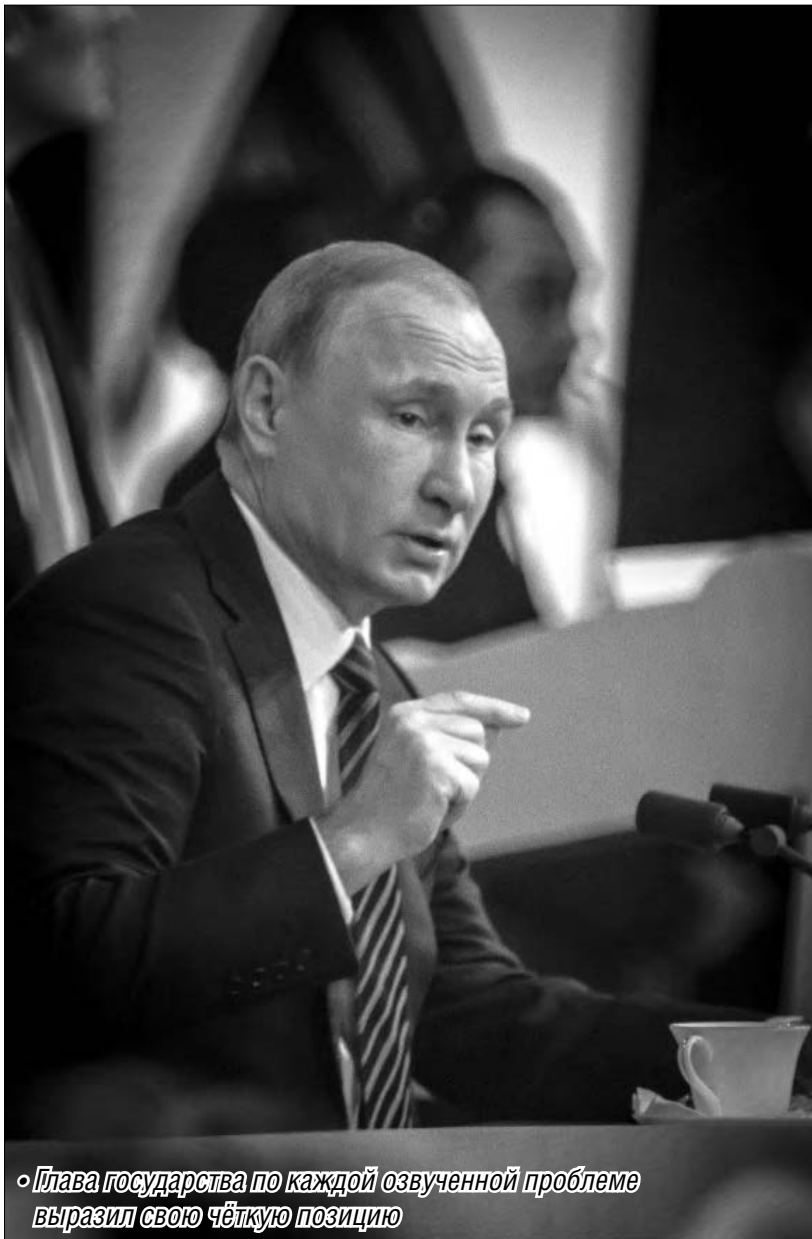
◦ Глава государства по каждой озвученной проблеме выразил свою четкую позицию