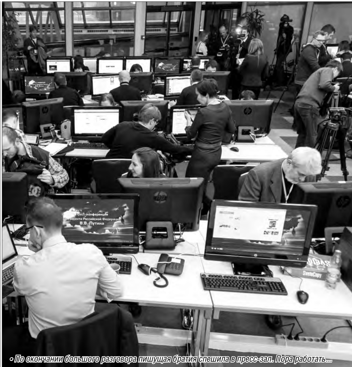
◦ По окончании большого разговора пишущая братия спешила в пресс-зал. Пора работать...