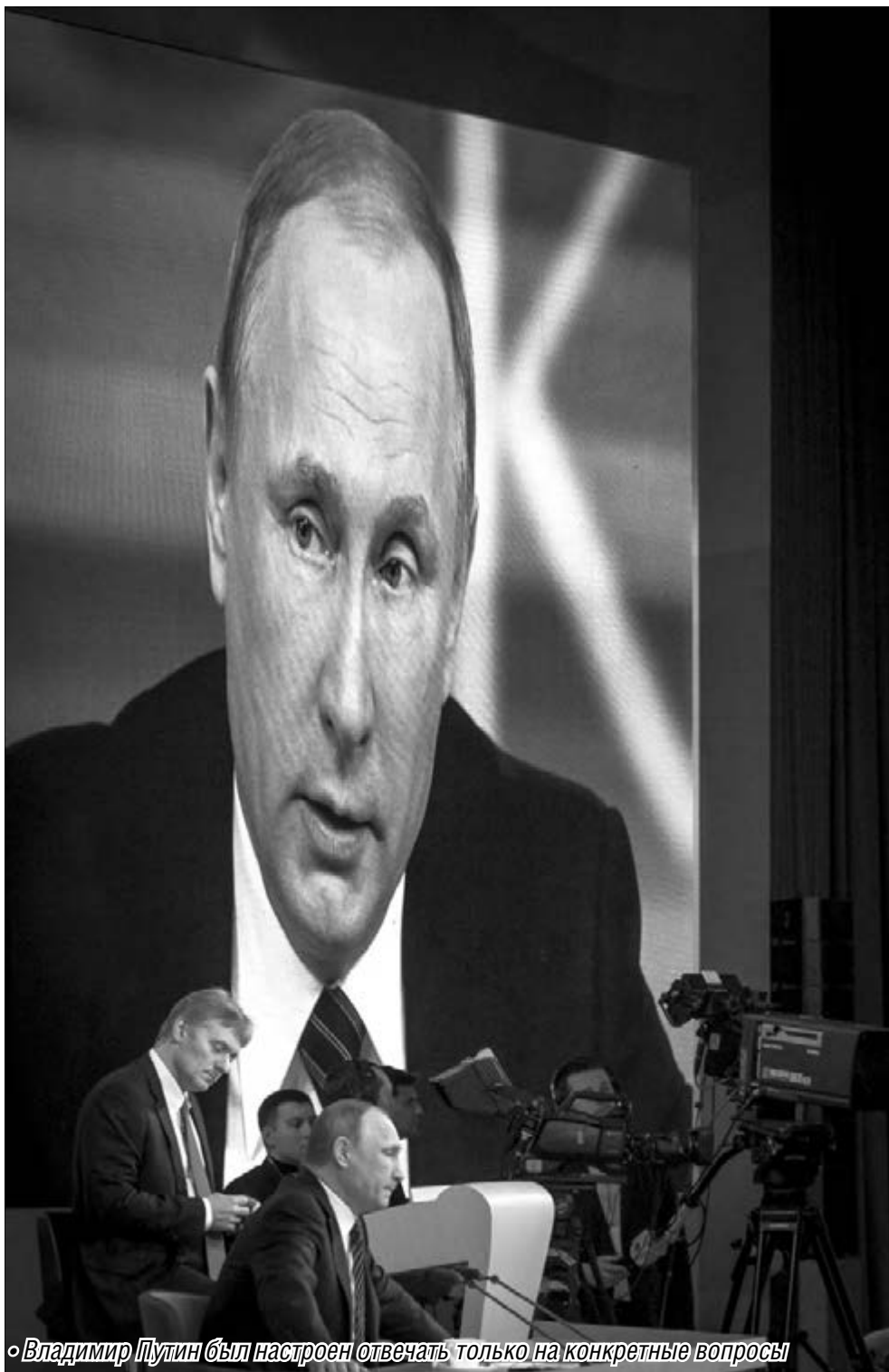
◦ Владимир Путин был настроен отвечать только на конкретные вопросы

Только раз в году бывает встреча... с президентом