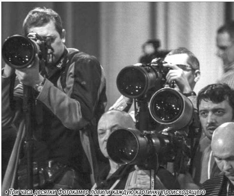
◦ Три часа десятки фотокамер ловили каждую картинку происходящего