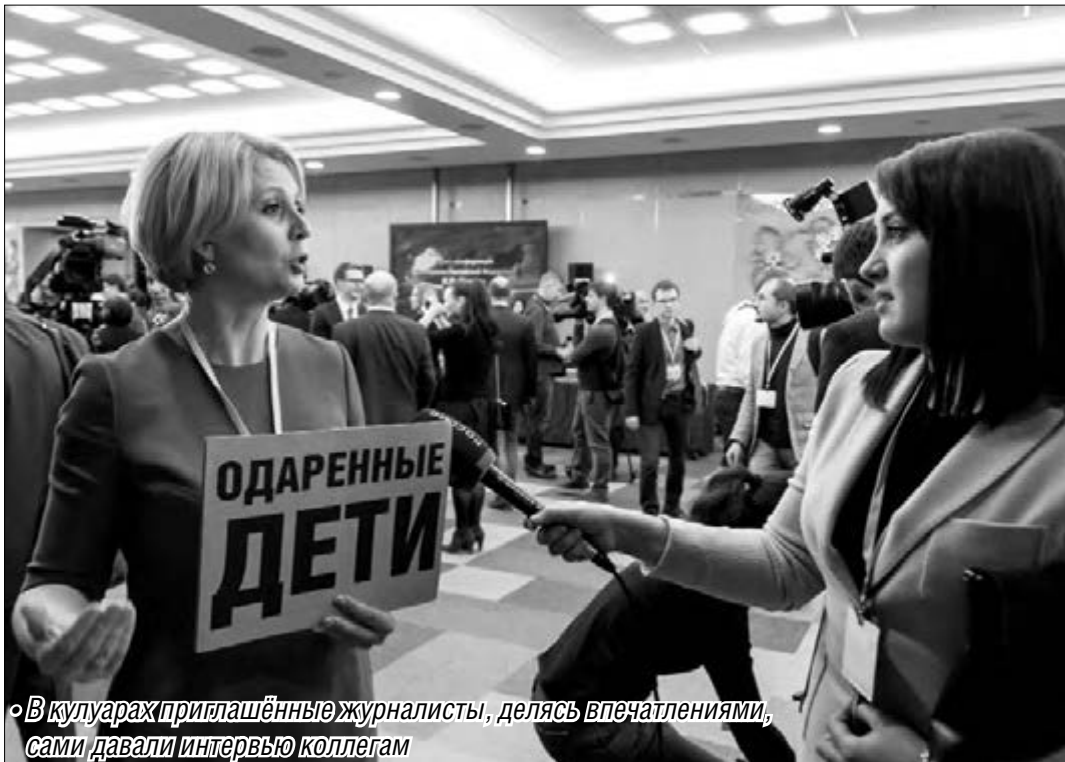
◦ В кулуарах приглашённые журналисты, делясь впечатлениями, сами давали интервью коллегам