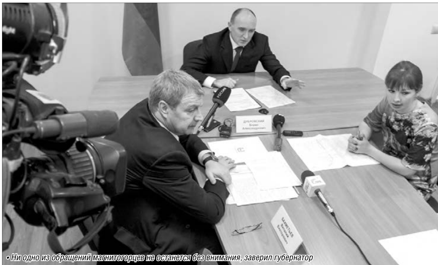
• Ни одно из обращений магнитогорцев не останется без внимания, заверил губернатор

Губернатор Всероссийский день приёма провёл в Магнитогорске