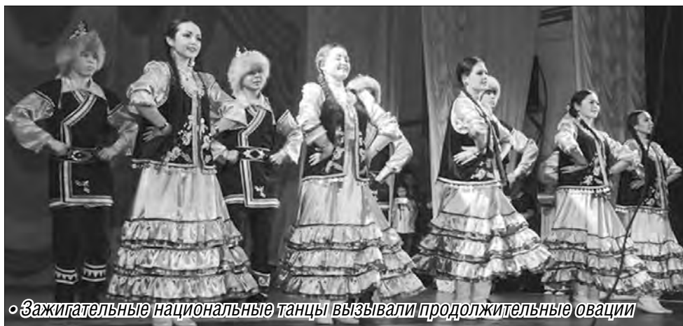
Зажигательные национальные танцы вызвали продолжительные овации