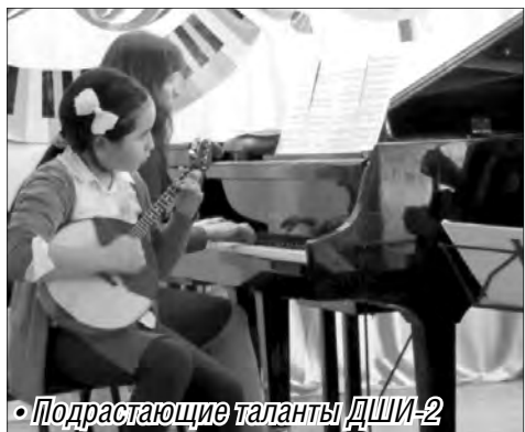
Подрастающие таланты ДШИ-2