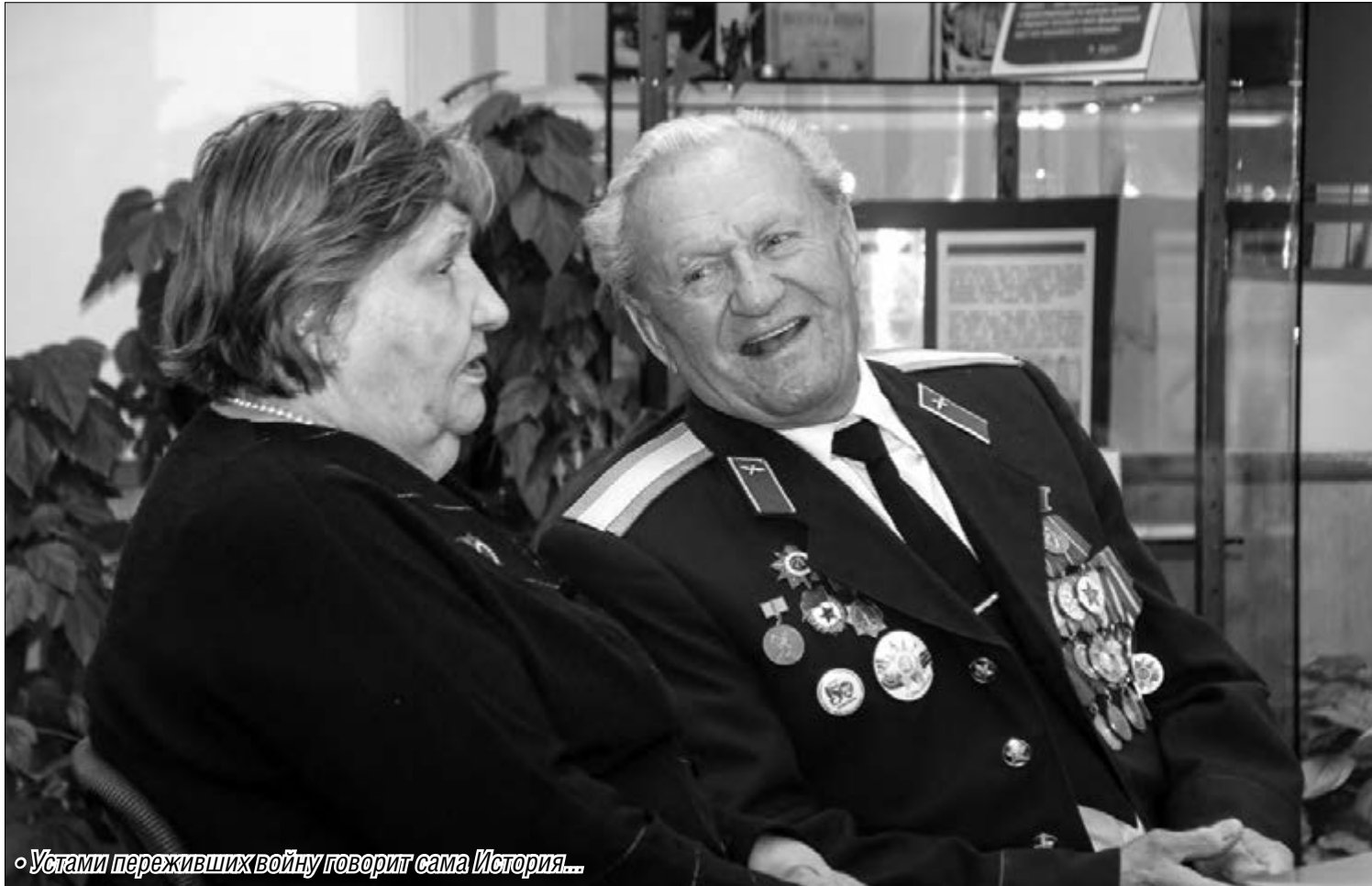
«Устами переживших войну говорит сама История...»

В Магнитогорске отметили очередную годовщину начала контрнаступления советских войск в битве под Москвой