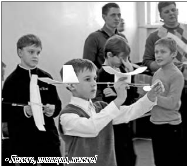
«Летите, планеры, летите!»

В Магнитогорске прошли соревнования юных авиамоделлистов