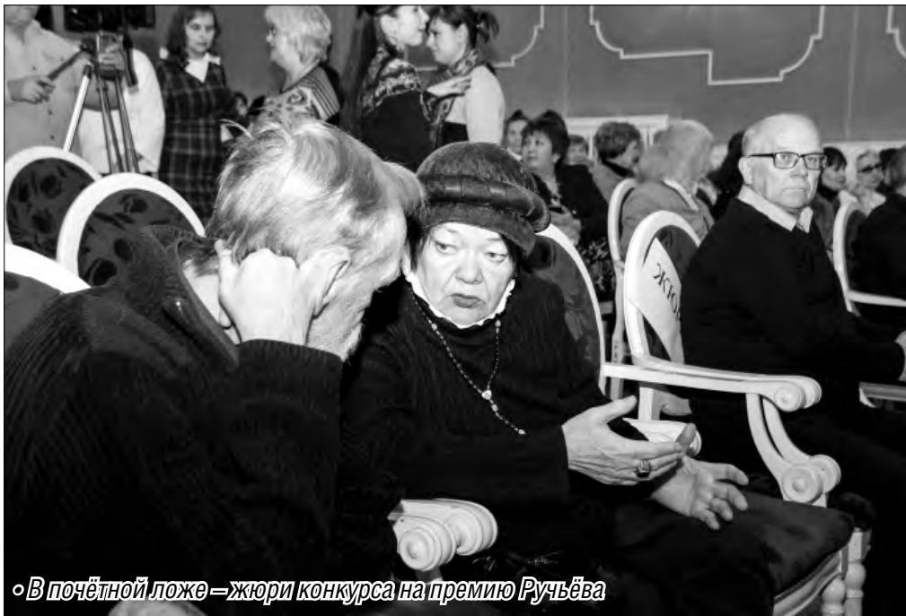
◦ В почётной ложе — жюри конкурса на премию Ручьева

Подведены итоги Года литературы и конкурса на соискание премии имени Ручьева