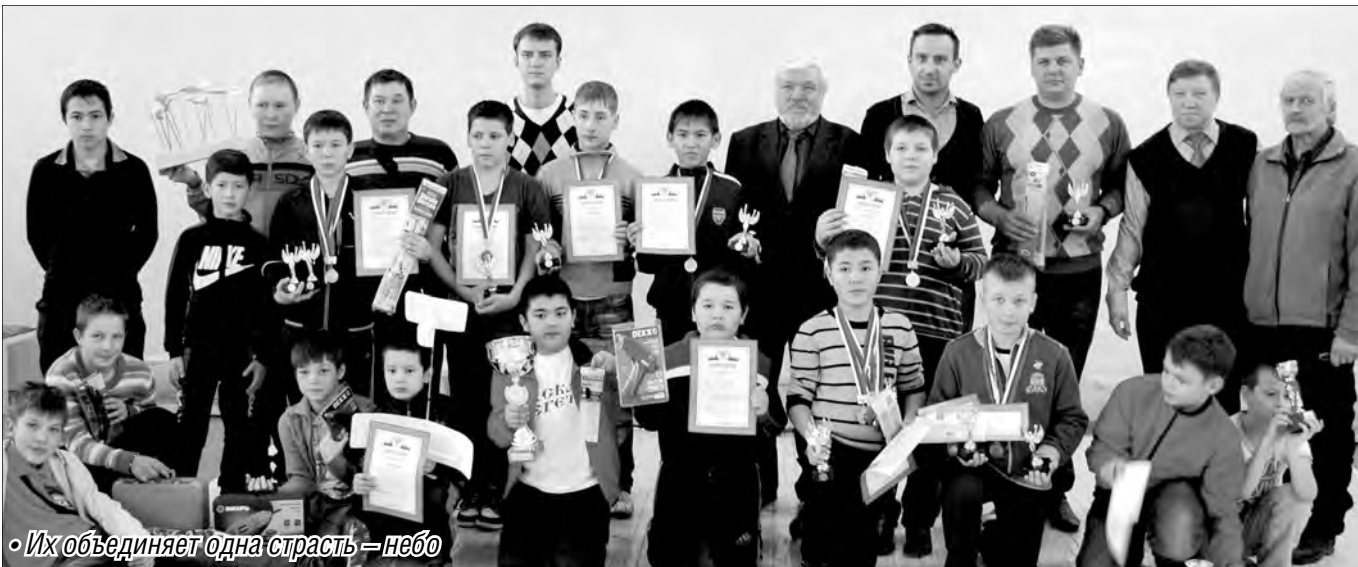
«Их объединяет одна страсть — небо»

На один день спортивный зал Правобережного центра дополнительного образования детей превратился в импровизированный аэродром.