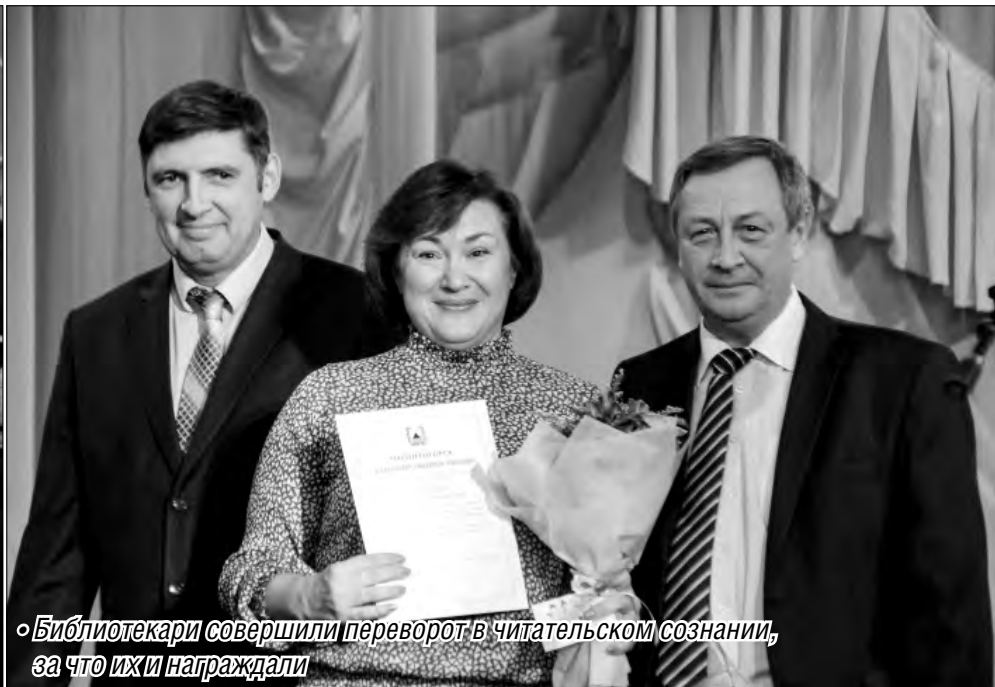
◦ Библиотекари совершили переворот в читательском сознании, за что их и награждали

Наверняка многие события уходящего года, представленные на торжественном подведении его итогов, будут памятными.