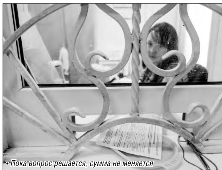
• Пока вопрос решается, сумма не меняется

– Согласно статье 159 Жилищного кодекса РФ предусмотрено предоставление субсидий на оплату жилого помещения и коммунальных услуг. Минимальный размер взноса входит в стандарт стоимости жилищно-коммунальных ус-