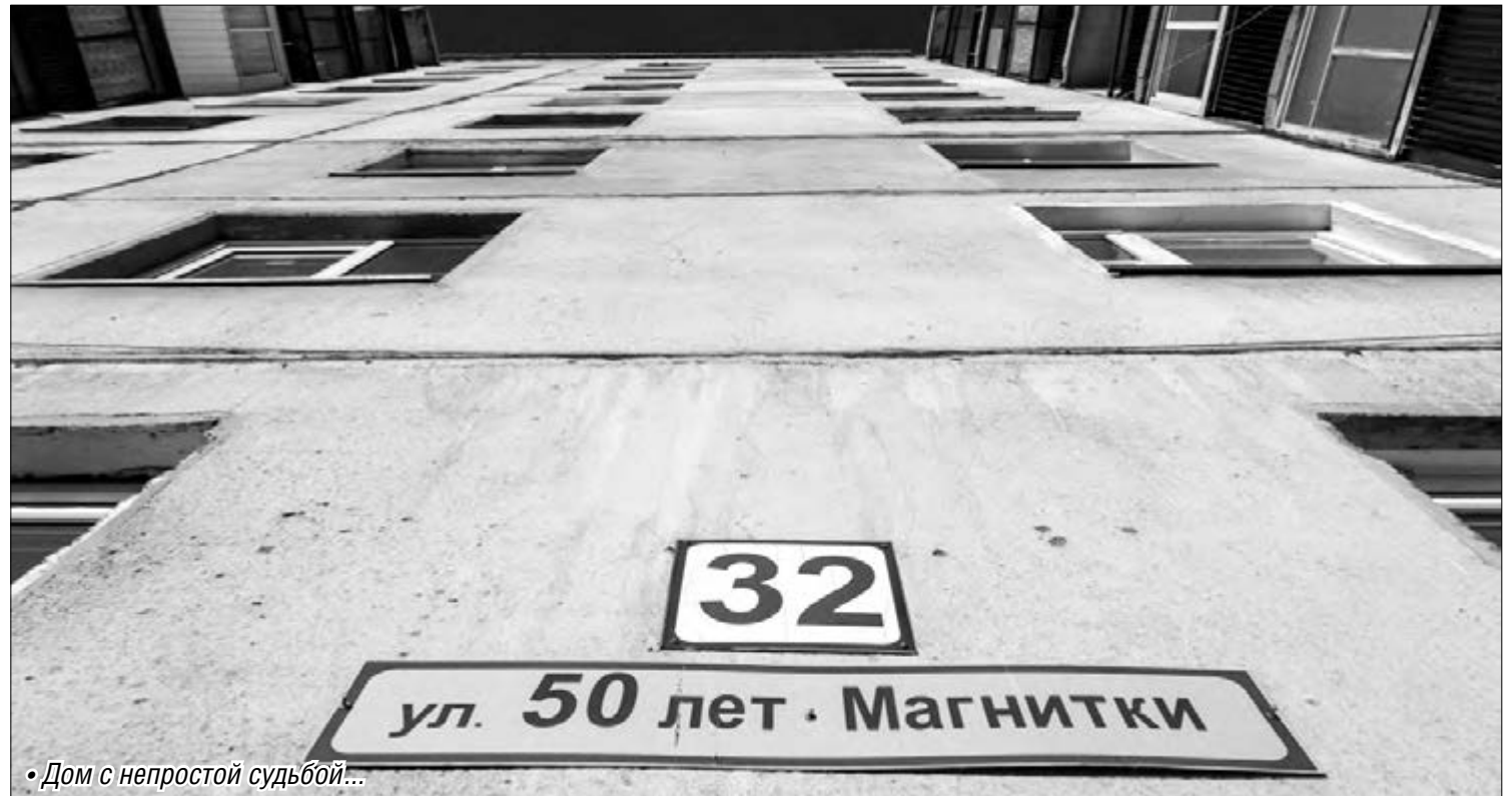
• Дом с непростой судьбой...

В конце 2014 года группа собственников дома №32 обратилась в управляющую компанию ООО «Магнит-Сервис» с предложением, чтобы та взяла на себя ответственность по управлению МКД. В соответствии с действующим законодательством, нормами Жилищного кодекса РФ прошла проце-