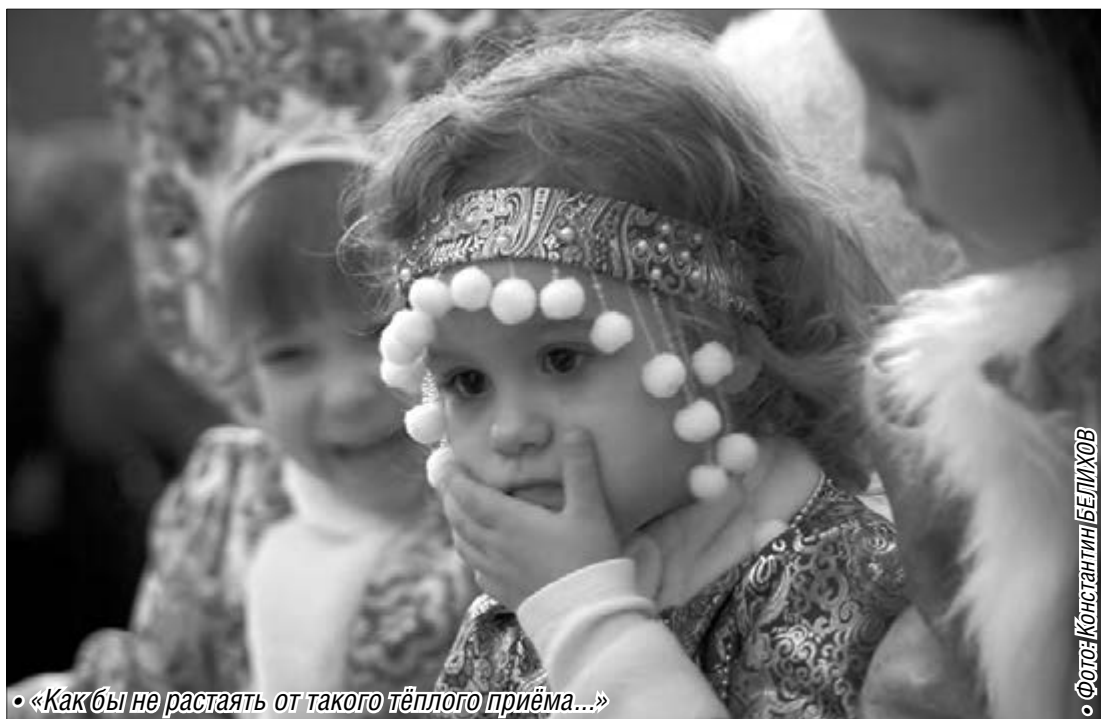
«Как бы не растаять от такого тёплого приёма...»

Каждая из участниц должна была оригинально поздравить гостей и жюри конкурса с предстоящим праздником, а затем под музыку продемонстрировать образ и костюм Снегурочки. И каждая девочка была неотразима во время короткой шоу-презентации. Не только красивые, порой традиционные, а порой и необычные, фан-