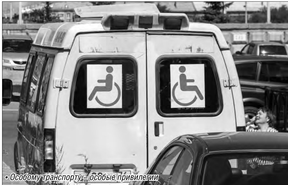
• Особому транспорту – особые привилегии