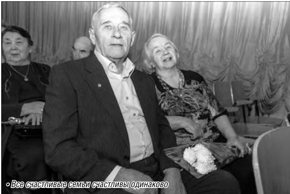
• Все счастливые семьи счастливы одинаково

В Магнитогорске чествуют семейные пары с полувековым стажем