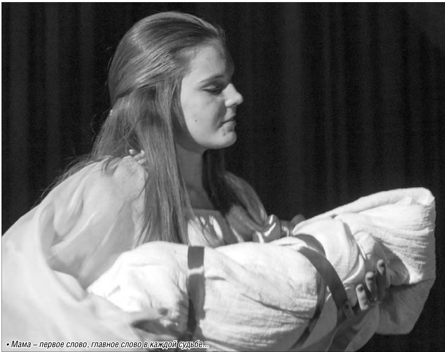
• Мама – первое слово, главное слово в каждой судьбе...

В преддверии Дня матери чествовали магнитогорских женщин