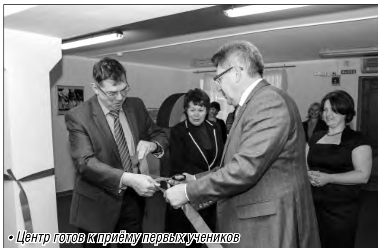
• Центр готов к приёму первых учеников

Следует пояснить, что инклюзивное образование предполагает обучение детей с ограниченными возможностями здоровья в обычном учебном заведении. Кстати, такая возможность закреплена в Законе «Об образовании в РФ». Согласно ему инклюзивное об-