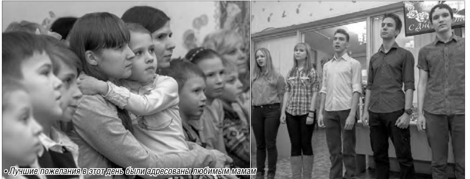
• Лучшие пожелания в этот день были адресованы любимым мамам

Промо-акция под таким девизом состоялась накануне Дня матери в детской библиотеке №6