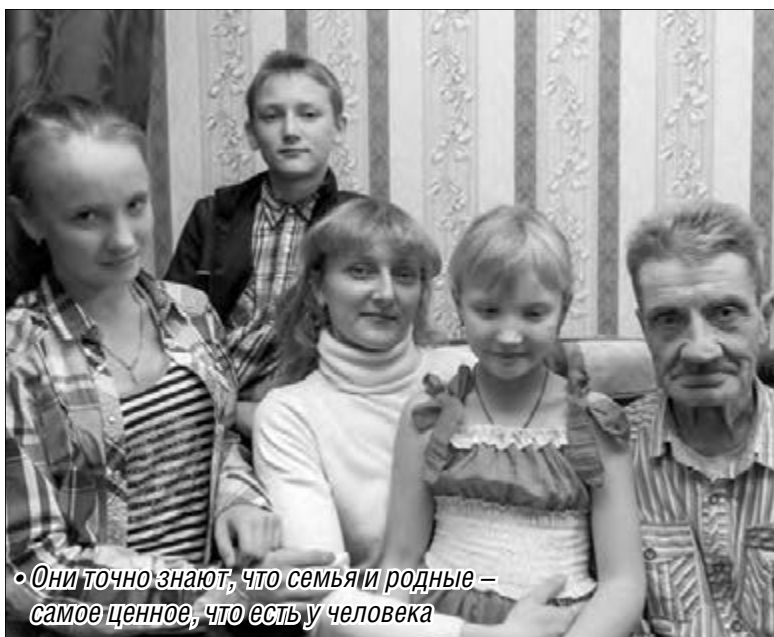
• Они точно знают, что семья и родные – самое ценное, что есть у человека