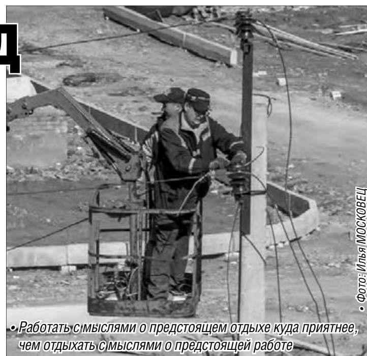
• Фото: Илья МОСКОВЕЦ

Одевайтесь в радостные тона. Наденьте пуловер, блузку или жилет желтого цвета – и вы почувствуете себя гораздо лучше, чем в костюме серого оттенка. Желтый цвет настраивает на благодушный лад. Перед завтраком постелите на стол желтую скатерть, а в вазу поставьте несколько желтых цветов – и начало дня будет радостным.