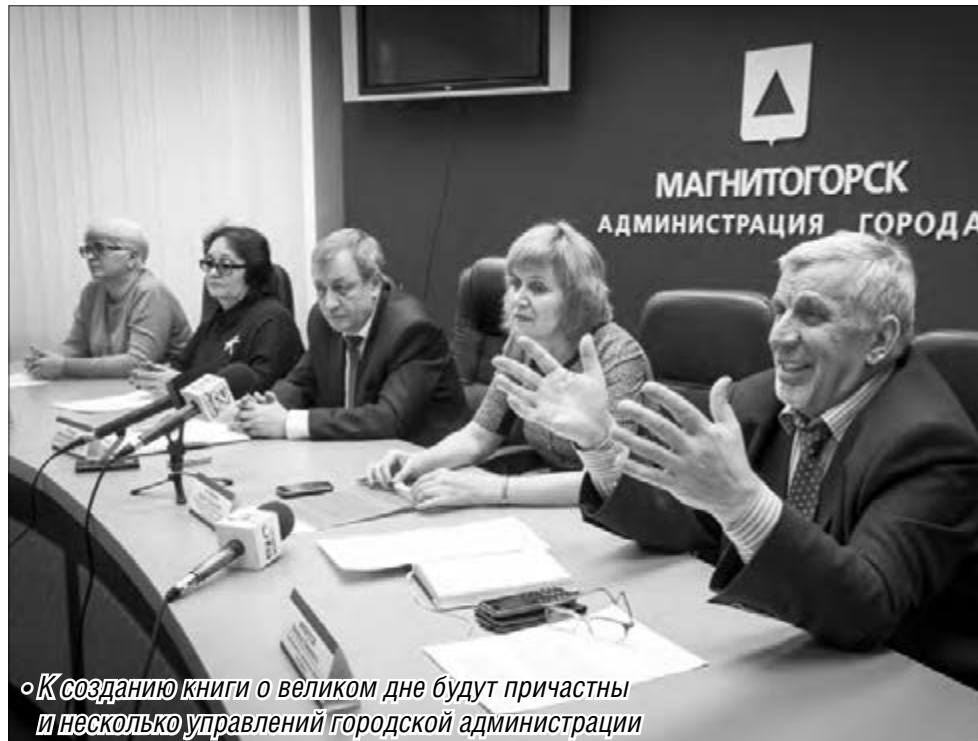
«К созданию книги о великом дне будут причастны и несколько управлений городской администрации»

В распоряжении авторов уже есть воспоминания сорока магнитогорцев о Дне Победы. Каждое из них по-своему уникально и интересно. А сколько еще трогатель-