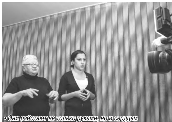
• Они работают не только руками, но и сердцем

От сурдопереводчиков зачастую зависят жизни людей