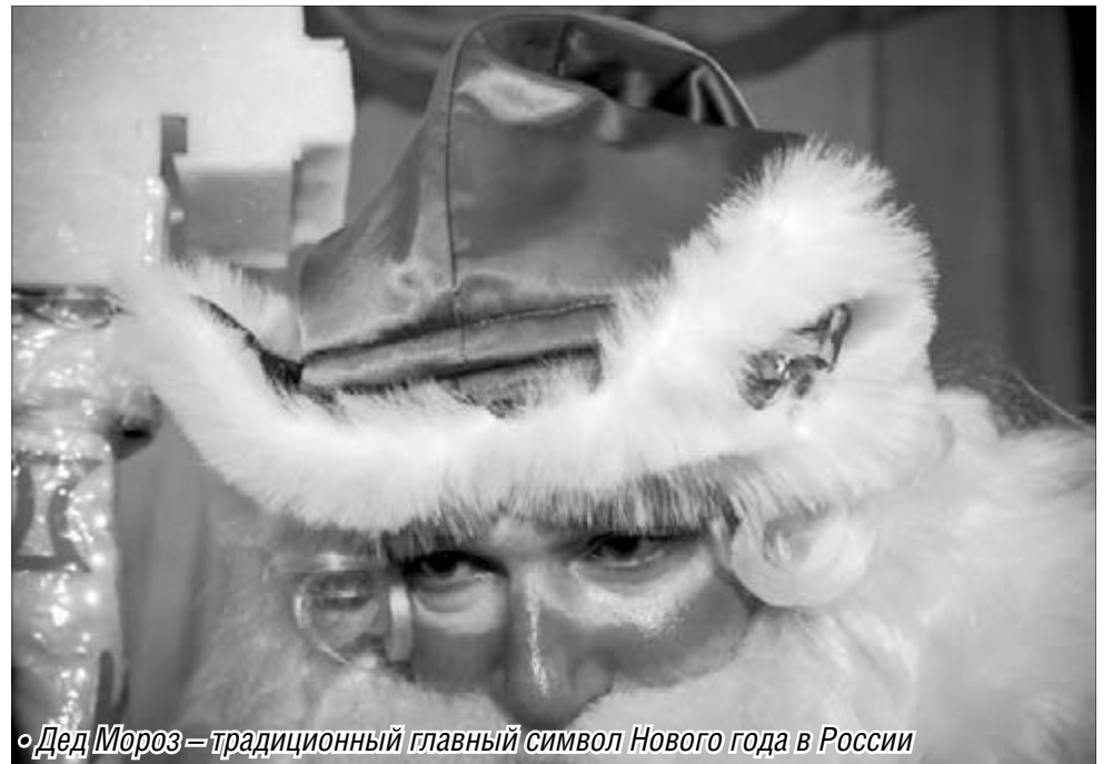
Дед Мороз – традиционный главный символ Нового года в России

Так или иначе, Дед Мороз и Снегурочка навсегда «примерзли» к статусу главных персонажей новогодних праздников. В Магнитогорске уже начались хлопоты, связанные с проведением традиционных елок для детей. Как уже сообщалось в «МР», во Дворце творчества детей и молодежи состоится III городская конкурс Снегурочек: 28 ноября пройдут отборочные туры по трем возрастным категориям, а на следующий день самые активные и творческие девочки борются за почетное звание внучки Деда Мороза в финальных испытаниях. По-