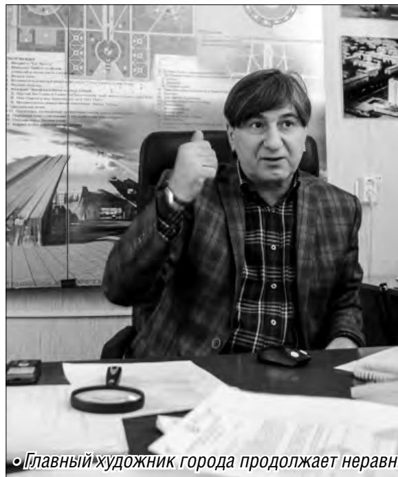
Главный художник города продолжает неравный бой с безвкусицей

Сохранение облика родного города – задача не из простых