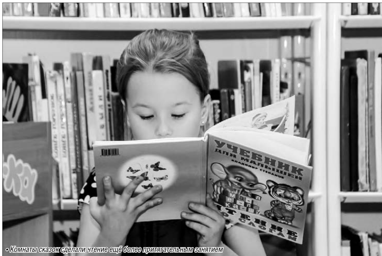
• Комнаты сказок сделали чтение ещё более притягательным занятием

В гости к их героям может теперь прийти любой читатель