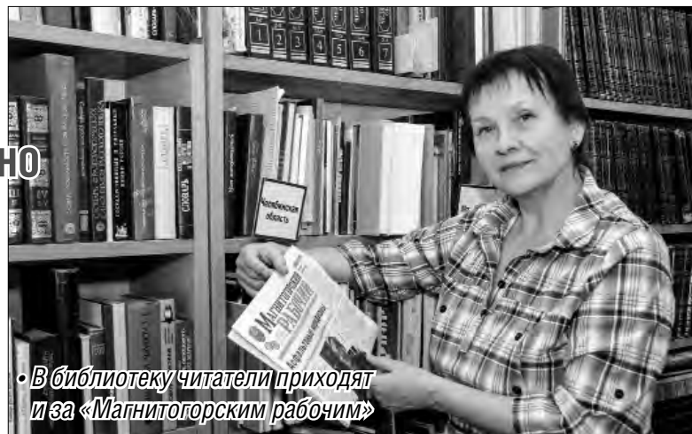
• В библиотеку читатели приходят и за «Магнитогорским рабочим»

– Не могу согласиться с мрачными прогнозами, – говорит она. – Россия – страна особенная. Из-за этого ожидаемое «на завтра» у нас может произойти спустя полвека. С этим мнением согласны многие мои коллеги. К примеру, газета «Магнитогорский рабочий» пережила весьма трудные времена, а все же сохранила свой потенциал и продолжает вызывать интерес горожан. В нашей библиотеке есть постоянные читатели, которые спрашивают именно эту газету. К тому же она связана с такими именами, как Людмила Татьяничева, Борис Ручьев. Это исторический фунда-