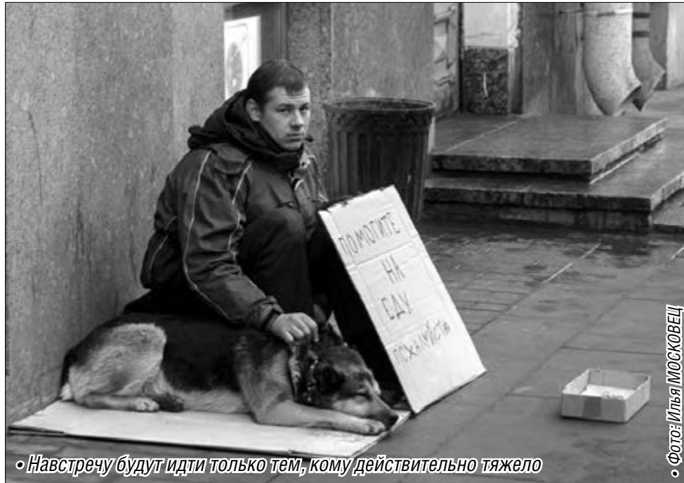
«Навстречу будут идти только тем, кому действительно тяжело»

С другой стороны, злоупотреблять своими правами также не дадут. Банкротство введено в помощь тем, кому тяжело, а не мошенникам. Прощать долги правильно лишь тогда, когда у человека действительно критическая ситуация. Поэтому в исключительных случаях график выплат мо-