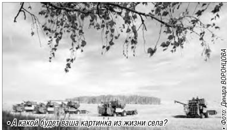
«А какой будет ваша картинка из жизни села?»

В нем могут принять участие как профессиональные фотографы, так и любители. Целью творческого состязания являются будни российского села. Тематами сюжетами могут стать портреты людей, работающих в сельском хозяйстве, праздники урожая, оленеводческие и иные животноводческие торжества и конкурсы, а также пейзажи, демонстрирующие результаты труда на земле, например, вспаханное поле, колосящаяся рожь, сады, пасущиеся животные, дачные и приусадебные участки.