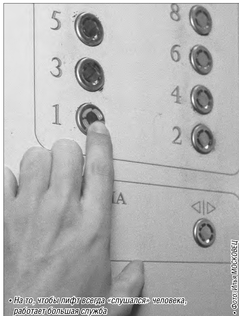
• На то, чтобы лифт всегда «слушался» человека, работает большая служба

А как насчет аварийных случаев? К примеру, часто ли падают лифты? По словам специалистов, раз в сто лет. На подъемнике установлена специальная система блокировки по типу рудничных клетей. В случае обрыва тягового троса, что очень маловероятно, лифтовая кабина просто застревает в шахте. Лифт – самое надежное и безопасное транспортное средство. Нужно очень постараться, чтобы разорвать трос, сделанный из скрученной стали, – и даже если это случилось бы после нескольких лет бесконтрольной постоянной эксплуатации, пришлось бы дожидаться разрыва нескольких тросов (каждая кабина крепится на четырех и более тросах), только в этом случае лифт упал бы.