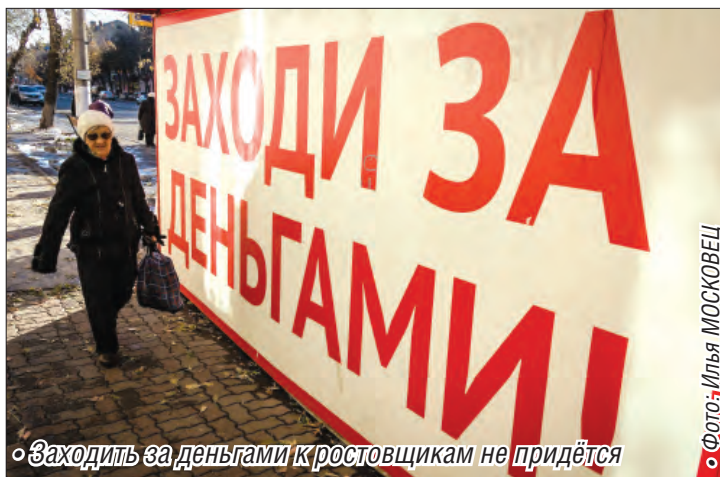
Заходить за деньгами к ростовщикам не придется