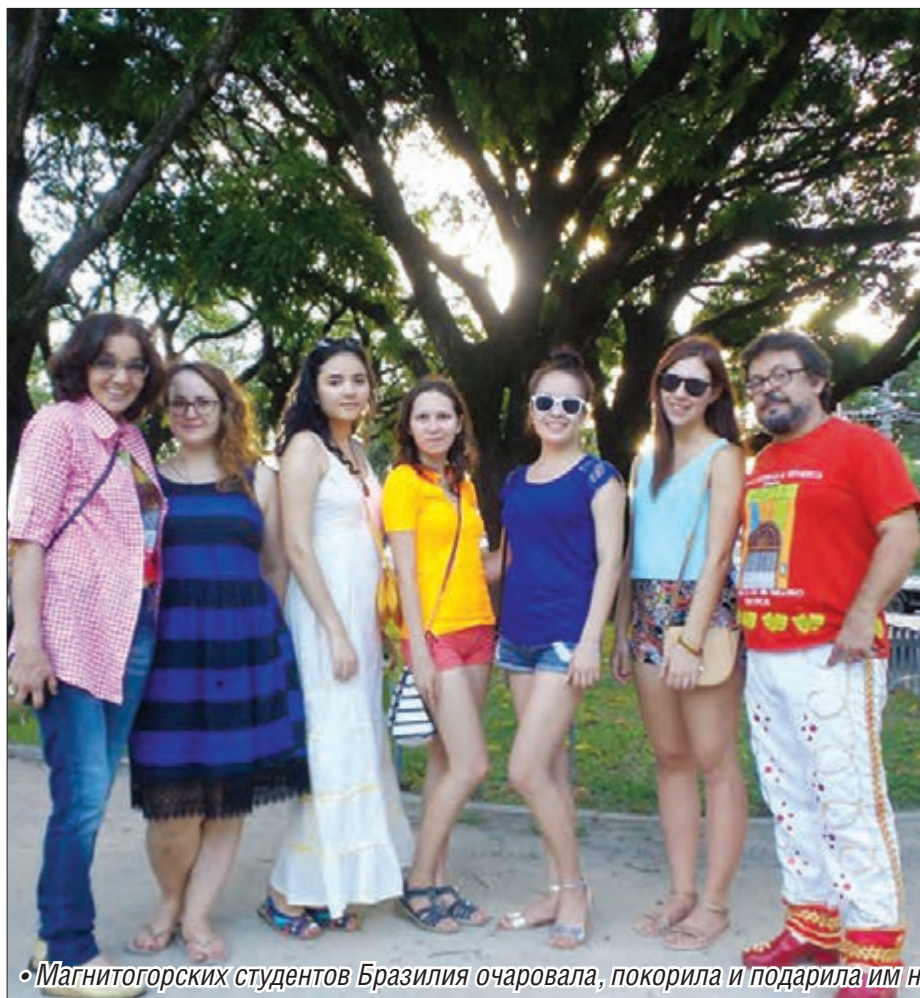
• Магнитогорских студентов Бразилия очаровала, покорила и подарила им новые мечты

Магнитогорские студенты обучаются по системе обмена за границей