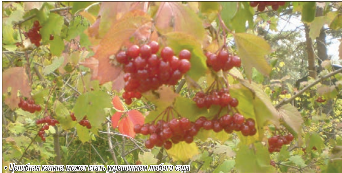
• Целебная калина может стать украшением любого сада

Калина обладает противовоспалительным, мочегонным, кровоостанавливающим, вяжущим и успокаивающим эффек-