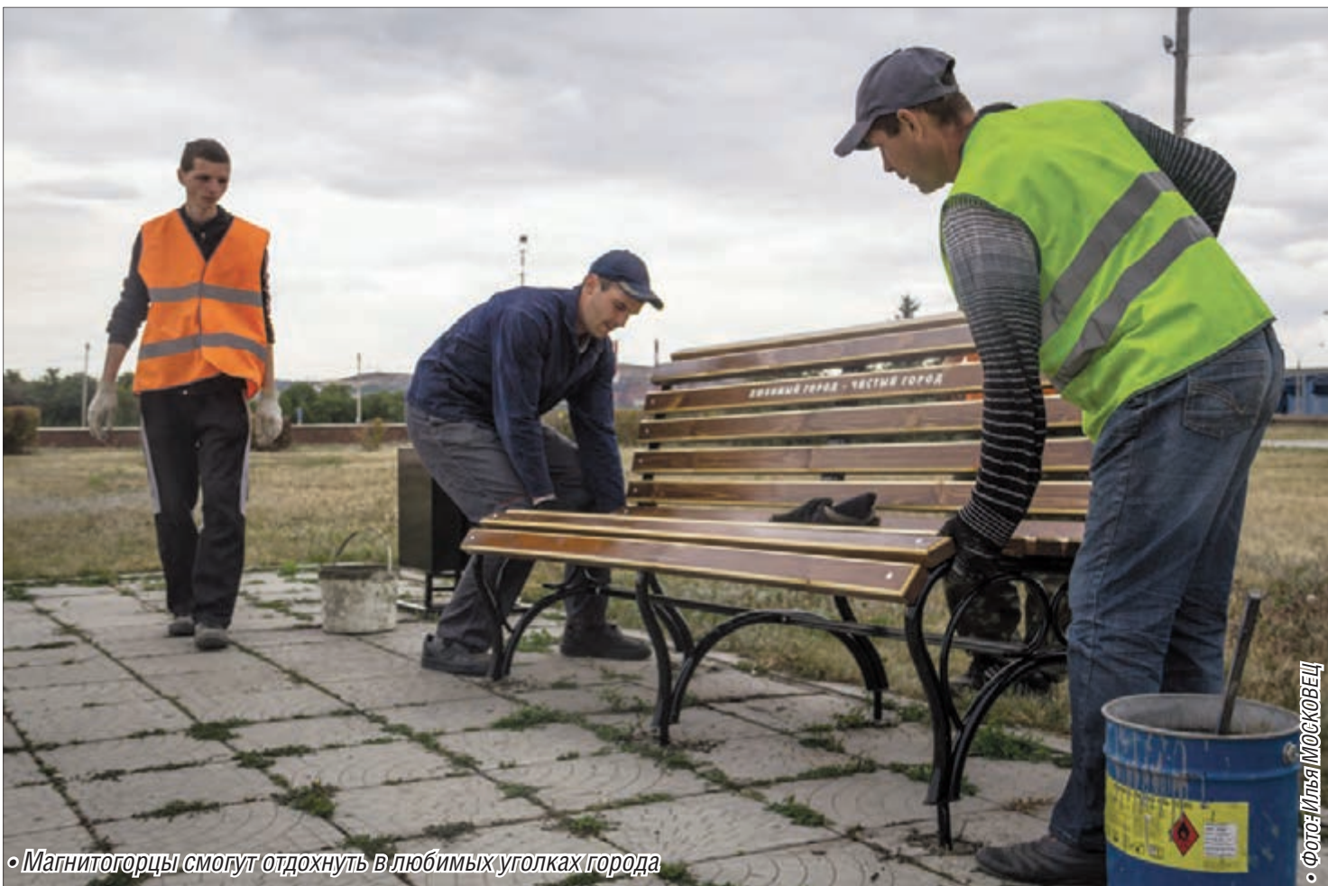
• Магнитогорцы смогут отдохнуть в любимых уголках города

Городские власти подвели итоги работы по благоустройству