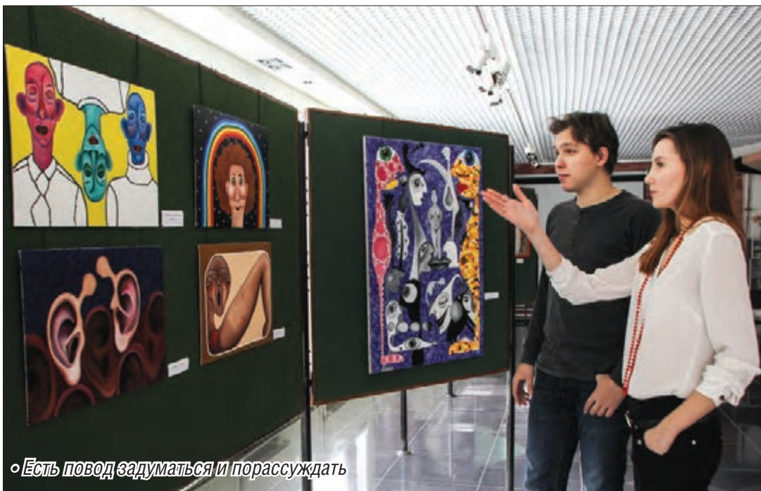
«Есть повод задуматься и порассуждать»

Воображение и фантазия необходимы не только художнику