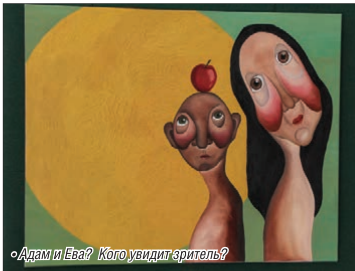
«Адам и Ева? Кого увидит зритель?»