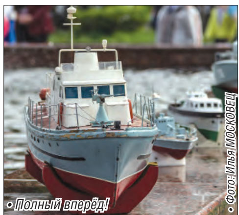
• Полный вперед!

По результатам состязаний с небольшим отставанием от победителей соревнований команда «Субмарина» заняла второе командное место. У команды Правобережного центра дополнительного образования детей – третье командное место и второе место в младшей возрастной группе.