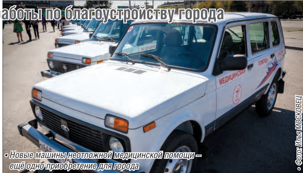
Новые машины неотложной медицинской помощи – ещё одно приобретение для города

В полтора миллиона рублей обошлась организация в 138-м микрорайоне Магнитогорска спортивного стадиона. Стоит ли говорить, с каким нетерпением жители микрорайона ждали этого события долгие