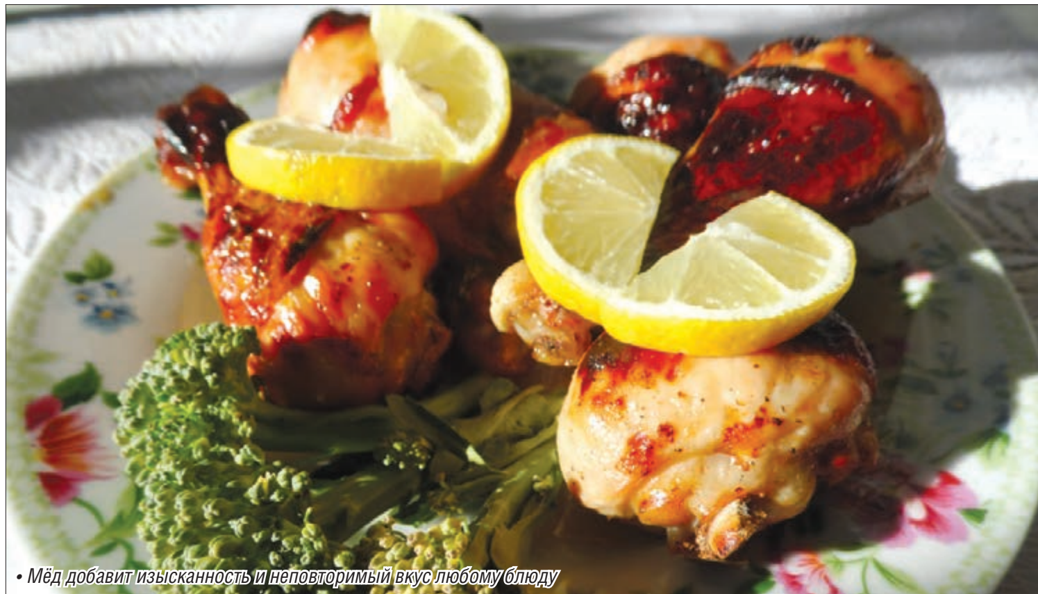
• Мёд добавит изысканность и неповторимый вкус любому блюду

Мы ждем откликов от других читателей нашей рубрики.