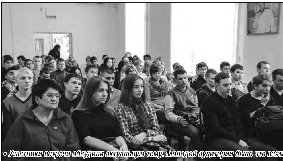
Участники встречи обсудили актуальную тему. Молодой аудитории было что взять на заметку

Мошенники изобретают новые методы обмана обывателей