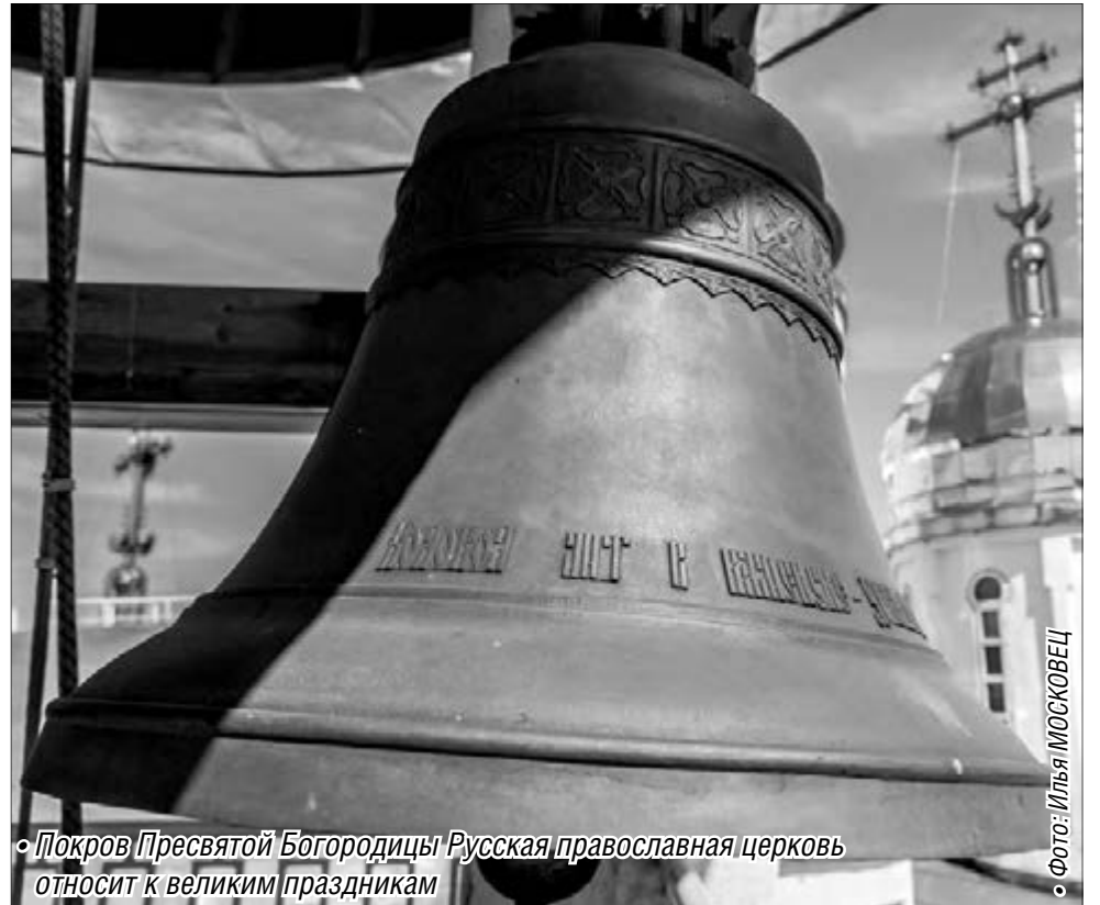
Покров Пресвятой Богородицы Русская православная церковь относит к великим праздникам

Веселый праздник в честь Покрова, следуя традициям, для магнитогорцев ежегодно устраивает Дом дружбы народов. Правда, в этом году гуляния прошли немного раньше – в минувшую субботу, 10 октября,