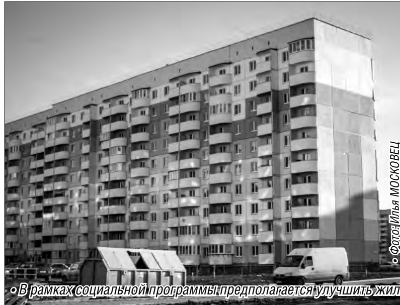
В рамках социальной программы предполагается улучшить жилищные условия 14 тысяч южноуральских семей

Губернатор Челябинской области принял решение расширить перечень участников социальной программы