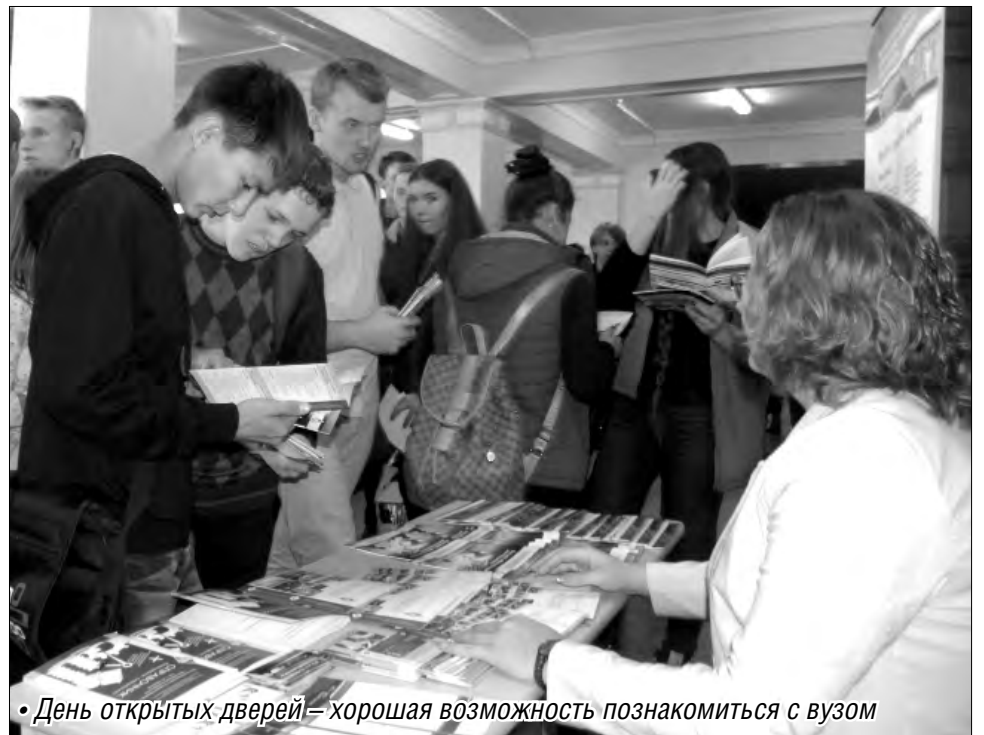
• День открытых дверей – хорошая возможность познакомиться с вузом

В ближайшее время Рособрнадзор опубликует сведения о количестве проходных баллов по ЕГЭ, которые, как утверждает Министерство образования, «значительно увеличатся, но суть вступительных и выпускных экзаменов в целом не сильно изменится». 2016 год порадует серьезным государственным заказом, вузу выделено более двух тысяч бюджетных мест.