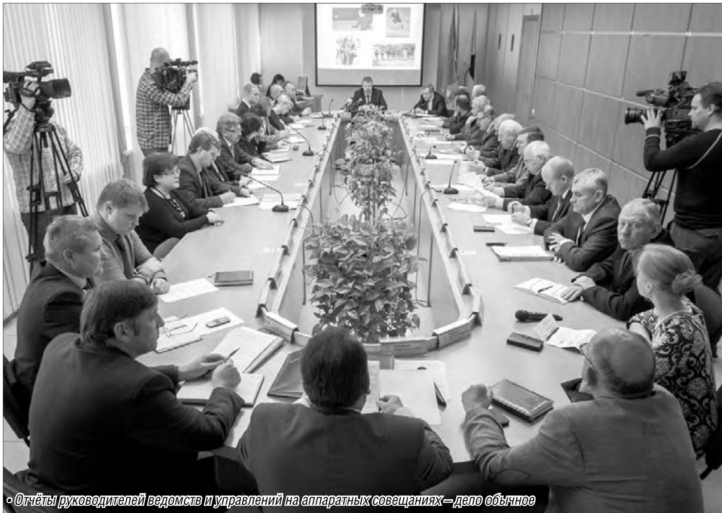
• Отчёты руководителей ведомств и управлений на аппаратных совещаниях – дело обычное

Санитарная уборка города остаётся на повестке дня