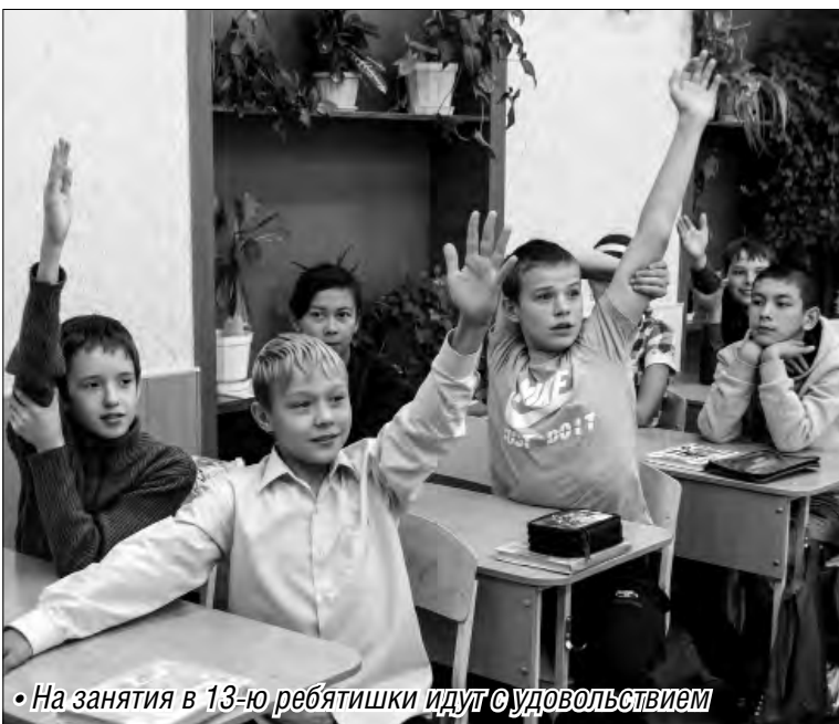
• На занятия в 13-ю ребята идут с удовольствием