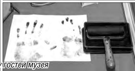
Экспонаты вызывают живой интерес не только у гостей музея

Вообще-то днем рождения музея УМВД принято считать 10 ноября 2005 года – именно тогда, в профессиональный праздник, его экспозиция впервые была открыта гостям.