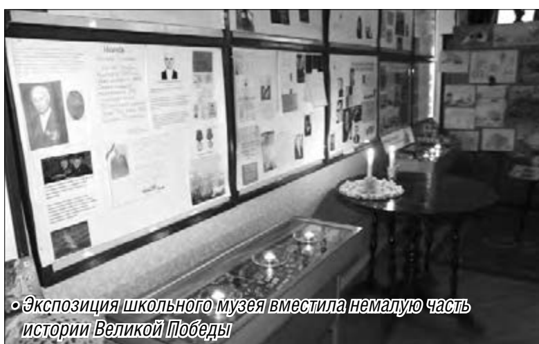
Экспозиция школьного музея вместила немалую часть истории Великой Победы

Петр Иванович воевал и в партизанском отряде имени Козьмы Минина второй Белорусской партизанской бригады имени Пономаренко. Вместе с партизанами он уничтожал эшелоны с живой силой противника, техникой, боеприпасами. При взятии Кенигсберга подбил пять немецких тан-