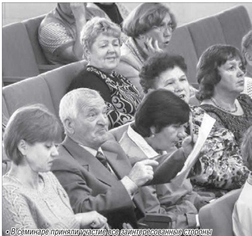
В семинаре приняли участие все заинтересованные стороны