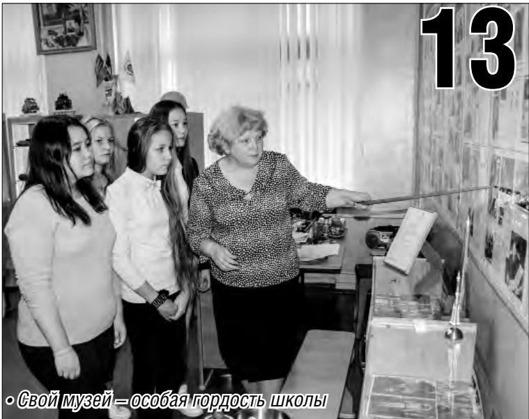
• Свой музей – особая гордость школы

Старейшая школа Магнитогорска отмечает юбилей