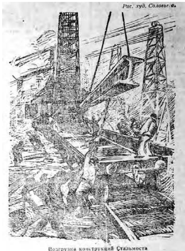
Позрузка конструкций Стальмоста

Рабкоры-чеканщики сообщают, что чеканные работы на каупере стоят. «Рабочая сила расставлена неправильно», – сетует бригада Залышкина. Неправильная организация труда не дает ударно работать и бригаде клепальщиков Боровко. Подвергнут критике конный двор, сорвавший работу Общестроя, занятого на отделке воздухоудовки и насосной станции №2, необходимых для пуска домна.