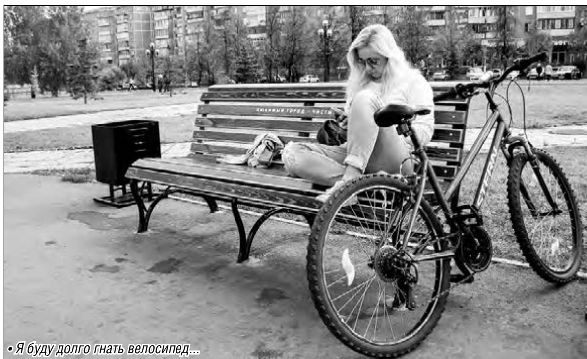
• Я буду долго гнать велосипед...

Традиция проводить День без автомобиля началась в Англии в 1997 году, а еще через год появилась во Франции. Тогда этот день отметили всего около двух десятков населенных пунктов.