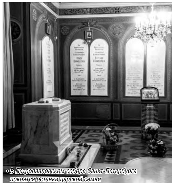
◦ В Петропавловском соборе Санкт-Петербурга покоятся останки царской семьи