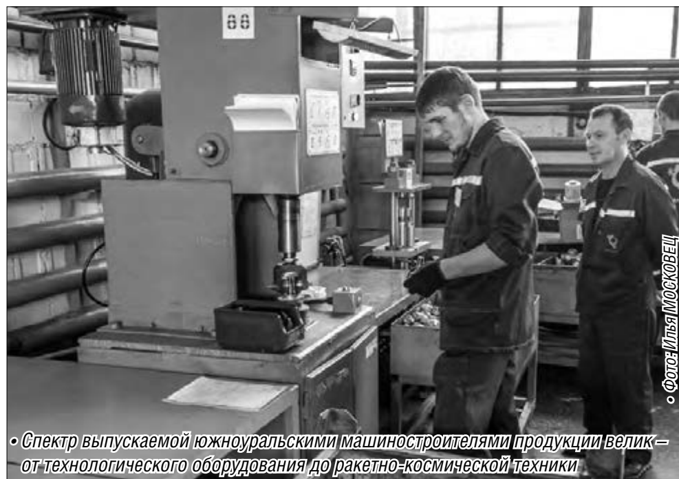
• Спектр выпускаемой южноуральскими машиностроителями продукции велик – от технологического оборудования до ракетно-космической техники

«Уважаемые машиностроители! Ваш профессиональный праздник давно и надежно вписан в трудовой календарь Челябинской области. В ваших руках оживает металл, воплощаясь в узлы и детали машин, а научная мысль обретает практические очертания в новых технологиях и конструкторских разработках. Именно по машиностроительной отрасли судят об экономическом развитии региона, его интеллектуальном и кадровом потенциале. Сегодня наши предприятия успешно участвуют в госпрограммах по перевооружению и импортозамещению. Уверен в южноуральских машиностроите-