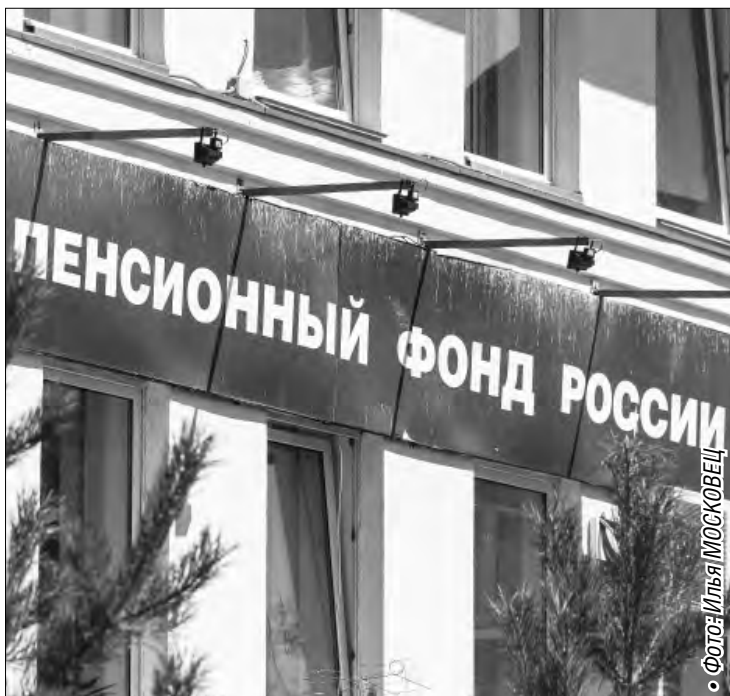
• Фото Илья МОСКОВЕЦ