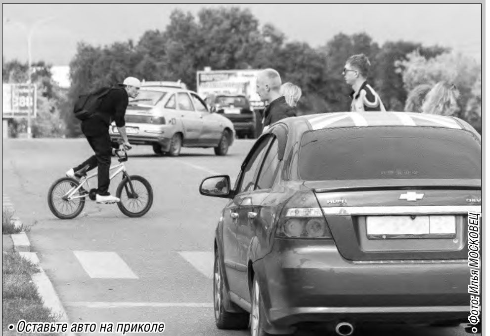
• Оставьте авто на приколе