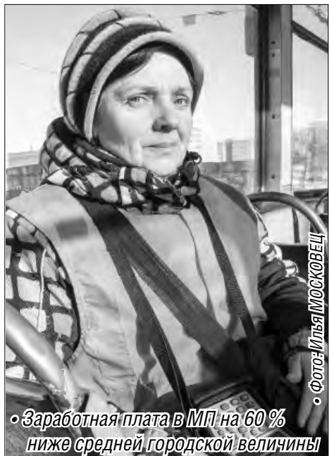
• Заработная плата в МП на 60% ниже средней городской величины