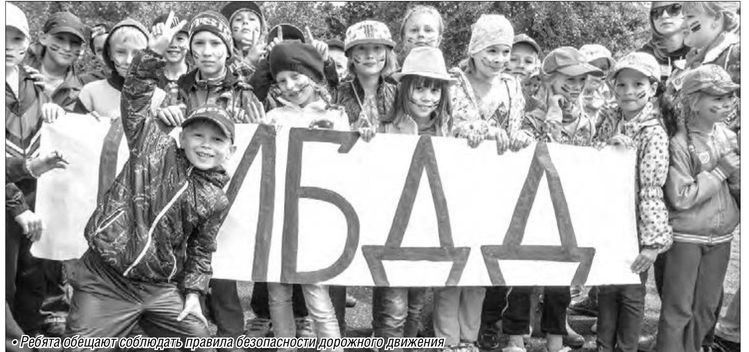
• Ребята обещают соблюдать правила безопасности дорожного движения

По статистике дети чаще попадают в дорожные происшествия вблизи школ и родного дома