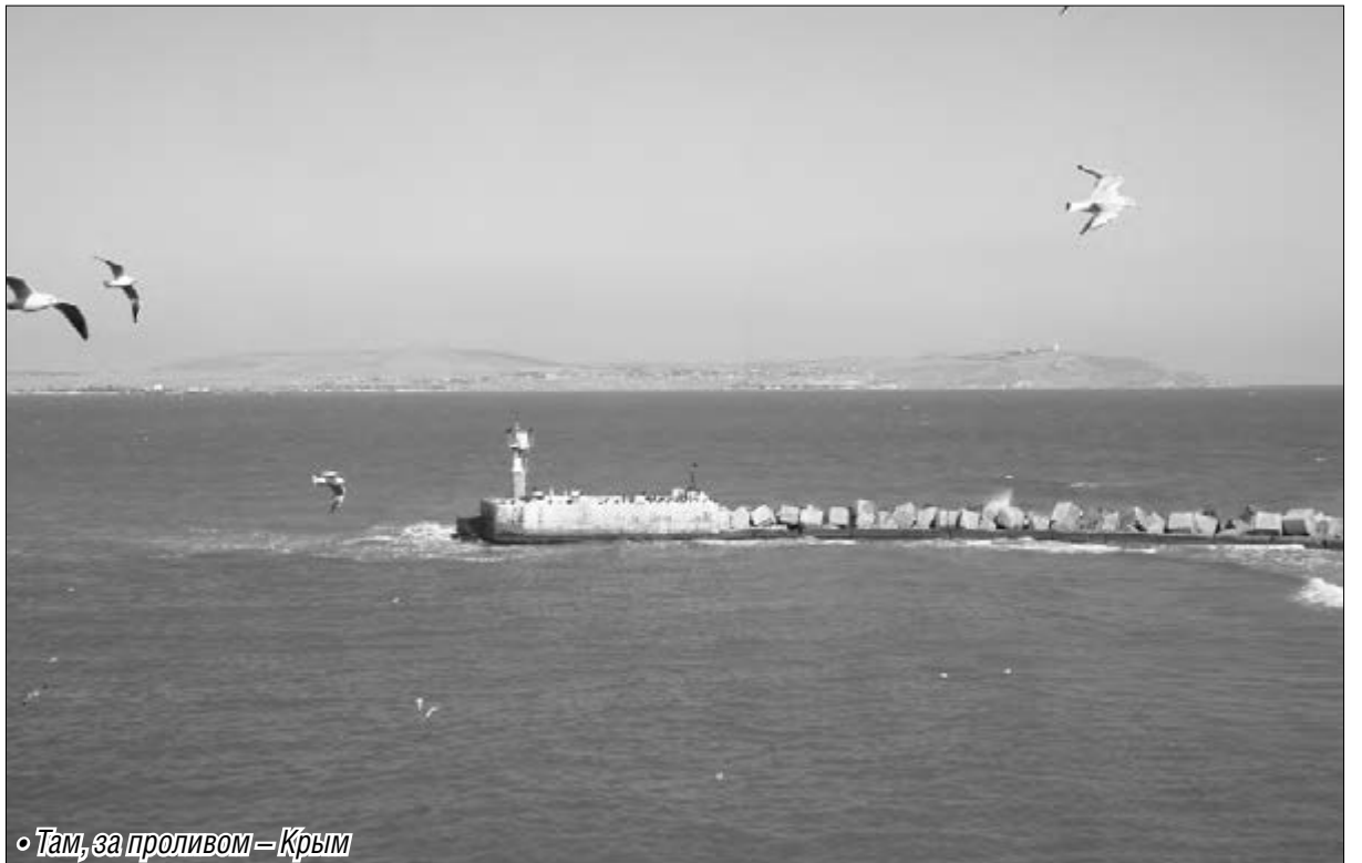
• Там, за проливом — Крым

«Махнем в Крым!» — решили мы в прошлом году на семейном совете.