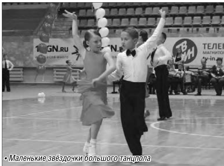
Маленькие звездочки большого танцпола

Воспитанники клуба приняли участие и в торжественном открытии турнира по спортивным танцам, продемонстрировав арсенал приемов рукопашного боя и смешанных единоборств. Толь-