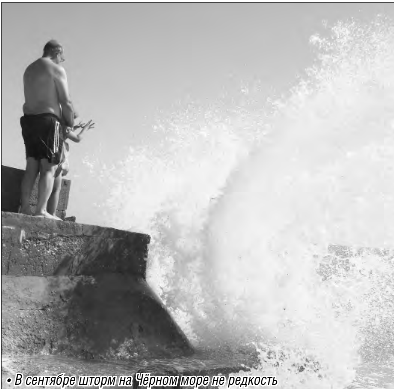
• В сентябре шторм на Чёрном море не редкость

Бархатный сезон на 45-й параллели оставил тёплое впечатление