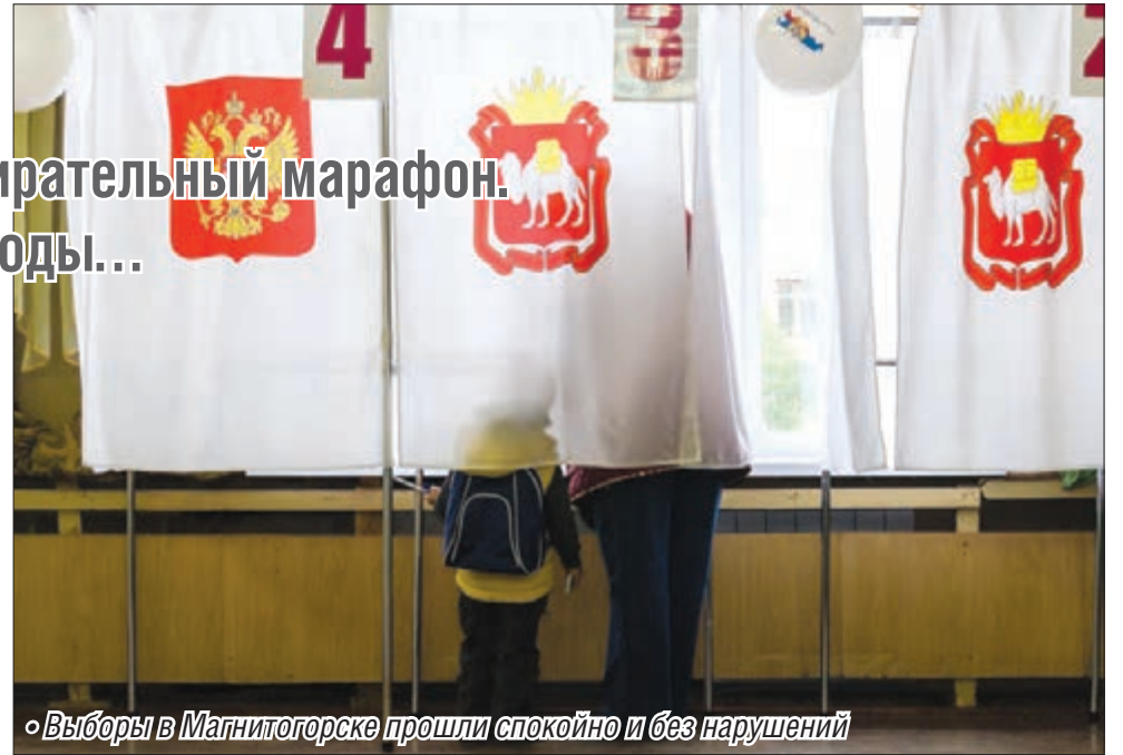
Выборы в Магнитогорске прошли спокойно и без нарушений

А вот качество самого процесса дает повод для размышлений. Тут по традиции не все так просто. Достаточно вспомнить о том, что за всю историю внедрения демо-