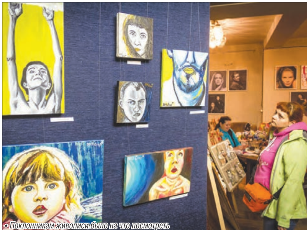
• Поклонникам живописи было на что посмотреть

На весь пятничный вечер карнавал захватил окрестности драмтеатра