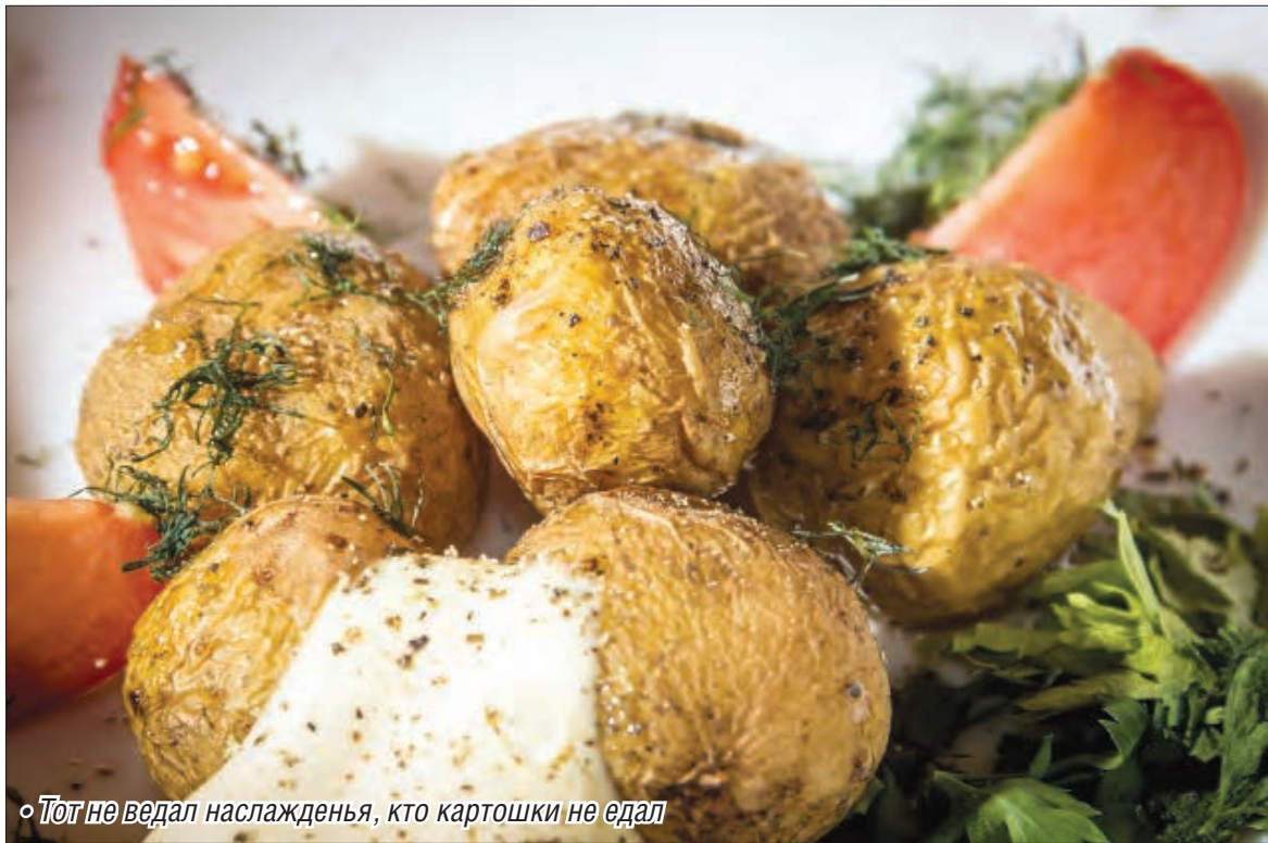
◦ Тот не ведал наслажденья, кто картошки не едал

Индейцы называли этот корнеплод «папа». Когда он на столе – вся семья сыта