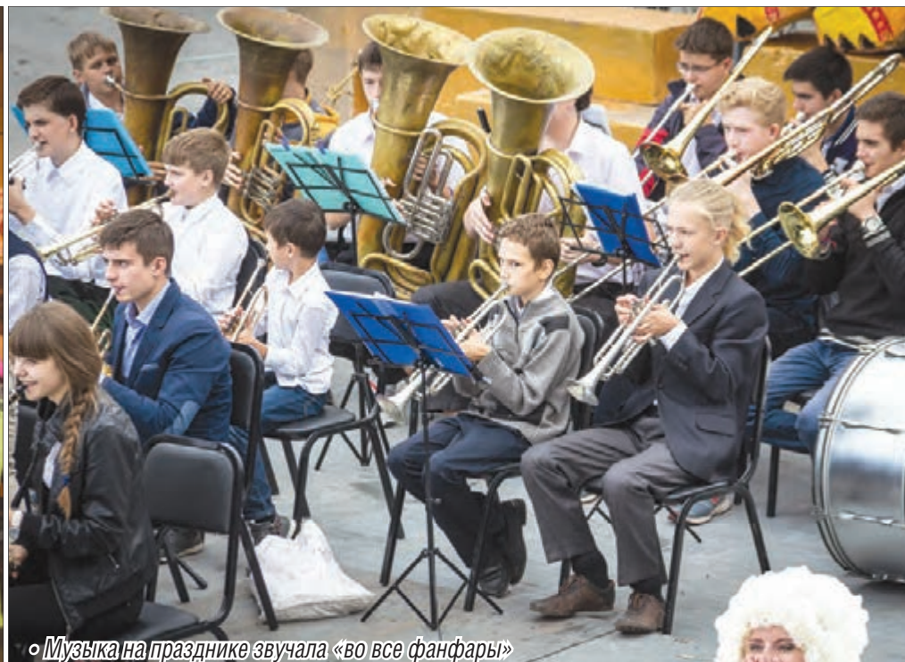
• Музыка на празднике звучала «во все фанфары»

Свобода самовыражения при отсутствии алкоголя и нецензурных слов стала характерным признаком этого праздника.