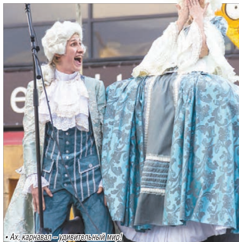
• Ах, карнавал – удивительный мир!

Пожалуй, наибольший ажиотаж в Год литературы на карнавале вызвали «Развал книг» и «Балкон поэтов». Расхватили почти все, что было выставлено на прилавке. А вот «Балкон поэтов» не терял своего лоска на протяжении четырех часов. Он разместился в пространстве средней сцены, и кулиса, которую волонтеры старательно украсили множеством бумажных листов, вполне соответствовала общему лирическому настрою.