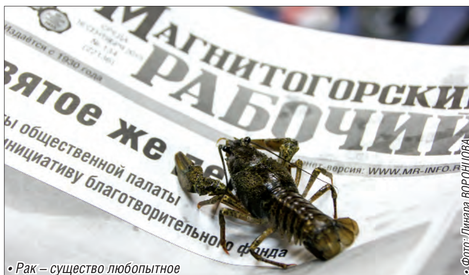
• Рак – существо любопытное

Разведение раков в домашних условиях – не такая уж и экзотика. Это неприхотливые животные, но условия им все же нужно создать. Как правило, на дно аквариумов с раками помещают полые камни и растения. Аквариум должен стоять в теплом месте, так как раки любят тепло. В аквариуме обязательно система фильтрации. Раки любят одиночество, поэтому необходимо создать им нужный ландшафт, поставив несколько укрытий в виде коряг, домиков. Опытные