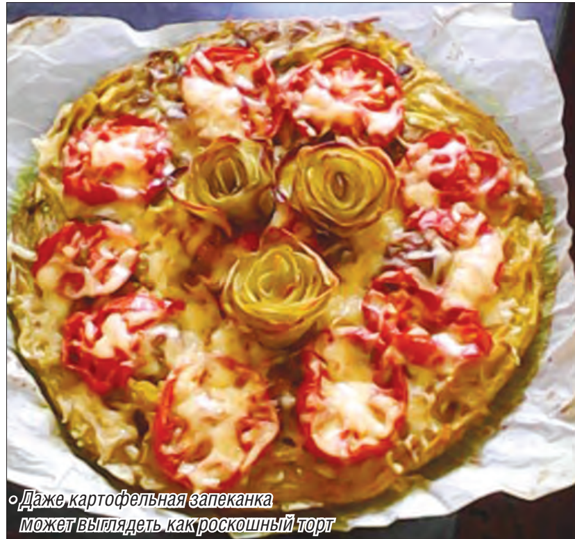
◦ Даже картофельная запеканка может выглядеть как роскошный торт

Сегодня мы поговорим о картошечке. Сейчас самое время кушать ее, ароматную, жареную, печеную, вареную. Мы выбрали рецепты, которые прислали наши читатели.