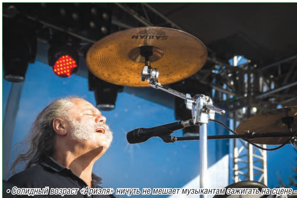
«Солидный возраст «Ариэля» ничуть не мешает музыкантам зажигать на сцене – они так же молоды, активны и энергичны»

Наши знаменитые земляки – ВИА «Ариэль» – выступили с концертом на юбилее «МР»