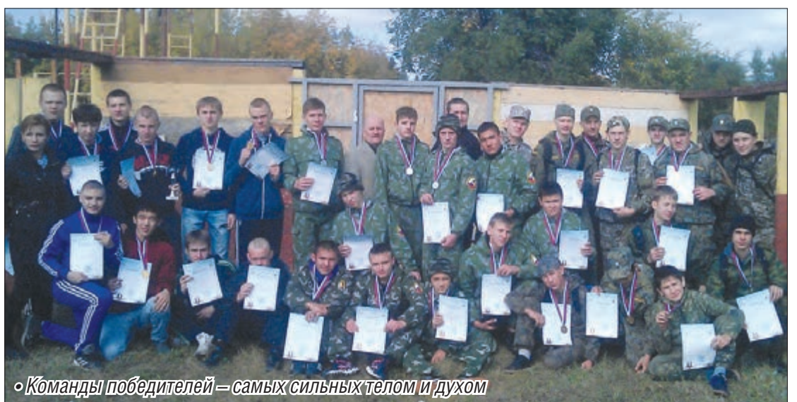
Команды победителей – самых сильных телом и духом

В финале приняли участие команды-победители районных отборочных состязаний. Ленинский район представлял «Сармат», Правобережный район – правобережный центр дополнительного образования детей, Орджоникидзеветский район – военно-спортивный клуб «Штурм» и команда Магнитогорской епархии – военно-патриотический клуб «Пересвет». Возраст от 15 до 17 лет.