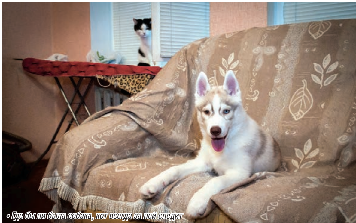
• Где бы ни была собака, кот всегда за ней следит