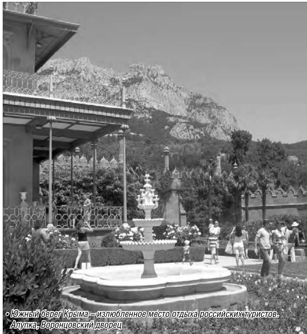
Южный берег Крыма – излюбленное место отдыха российских туристов. Алупка, Воронцовский дворец