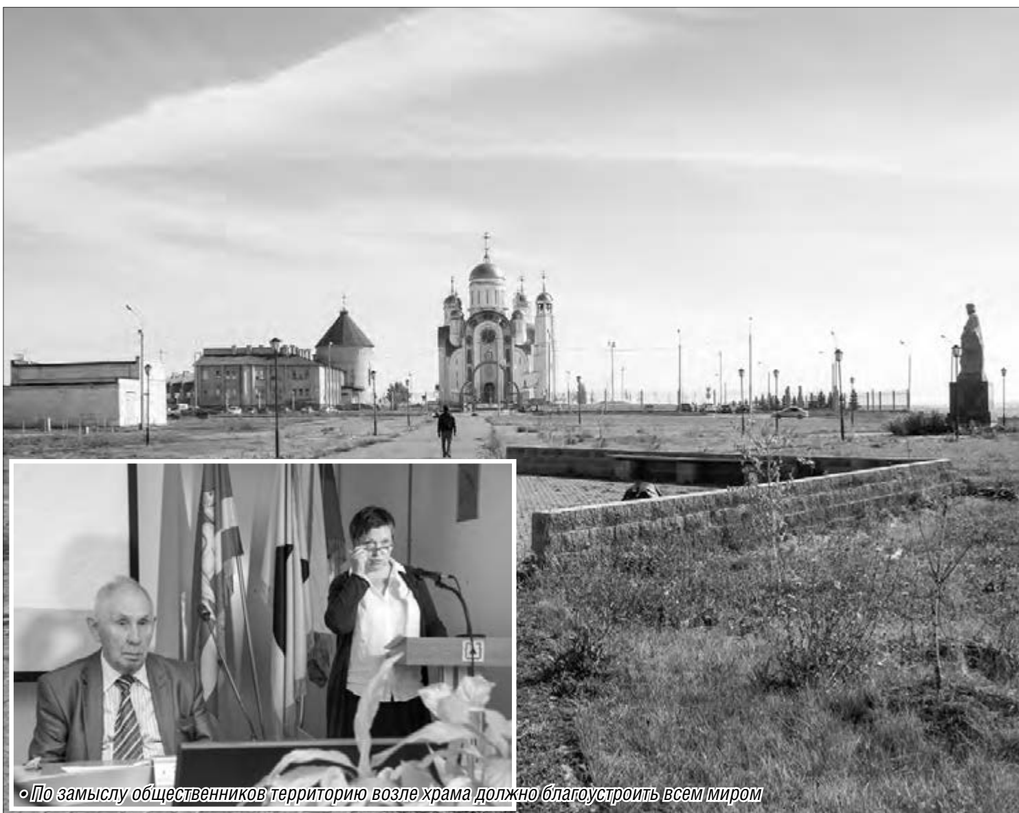
По замыслу общественников территорию возле храма должно благоустроить всем миром

Активисты общественной палаты обсудили инициативу благотворительного фонда