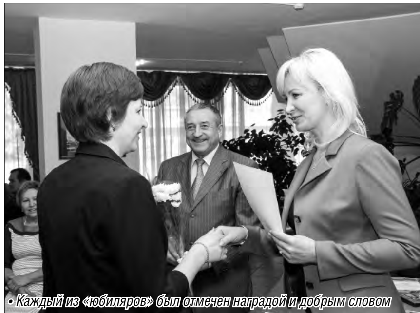
• Каждый из «юбиляров» был отмечен наградой и добрым словом

14 сентября Дворец спорта имени Ивана Ромазана отмечал 25-летие